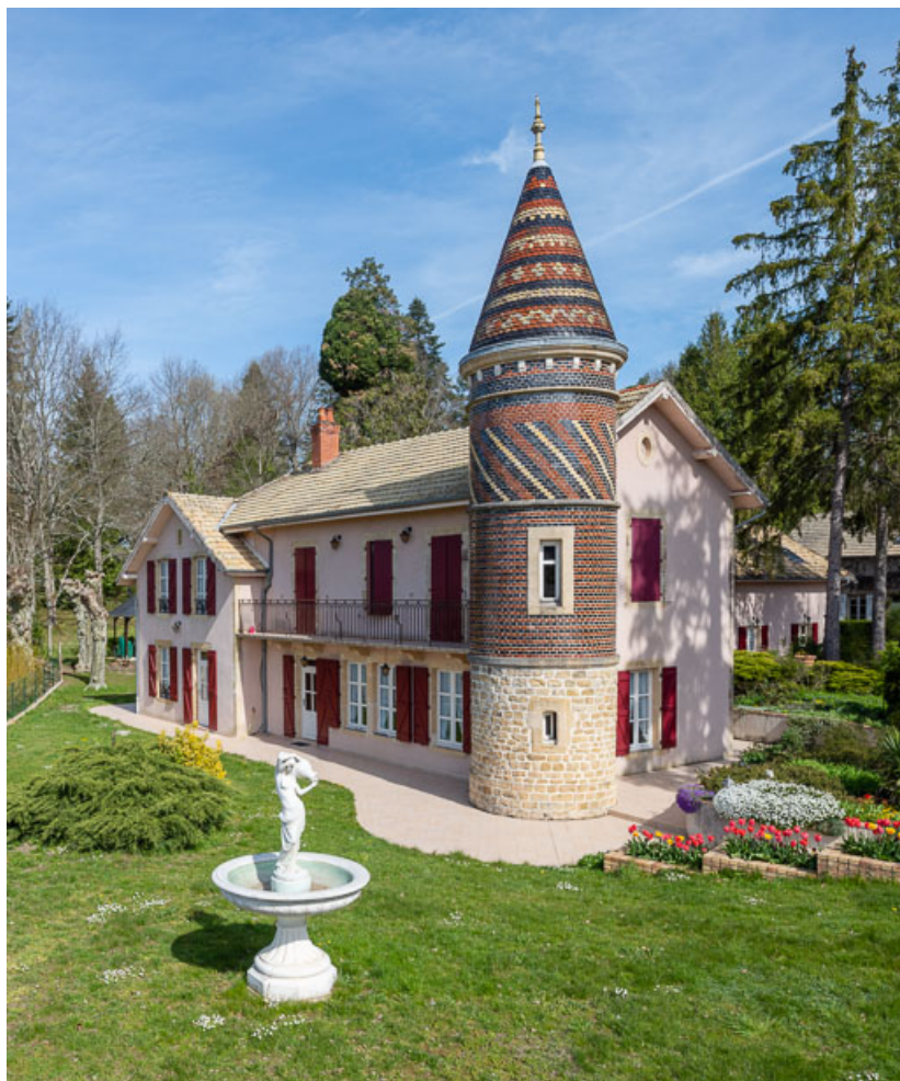
Façade sud-ouest, vue depuis le sud.

58, Saint-Honoré-les-Bains, 26 avenue Jean Mermoz