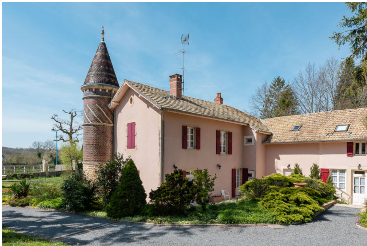
Façade nord-est, vue depuis l'est.

58, Saint-Honoré-les-Bains, 26 avenue Jean Mermoz