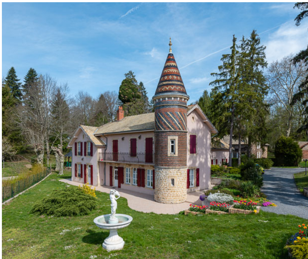
Façade sud-ouest, vue depuis le sud.

58, Saint-Honoré-les-Bains, 26 avenue Jean Mermoz