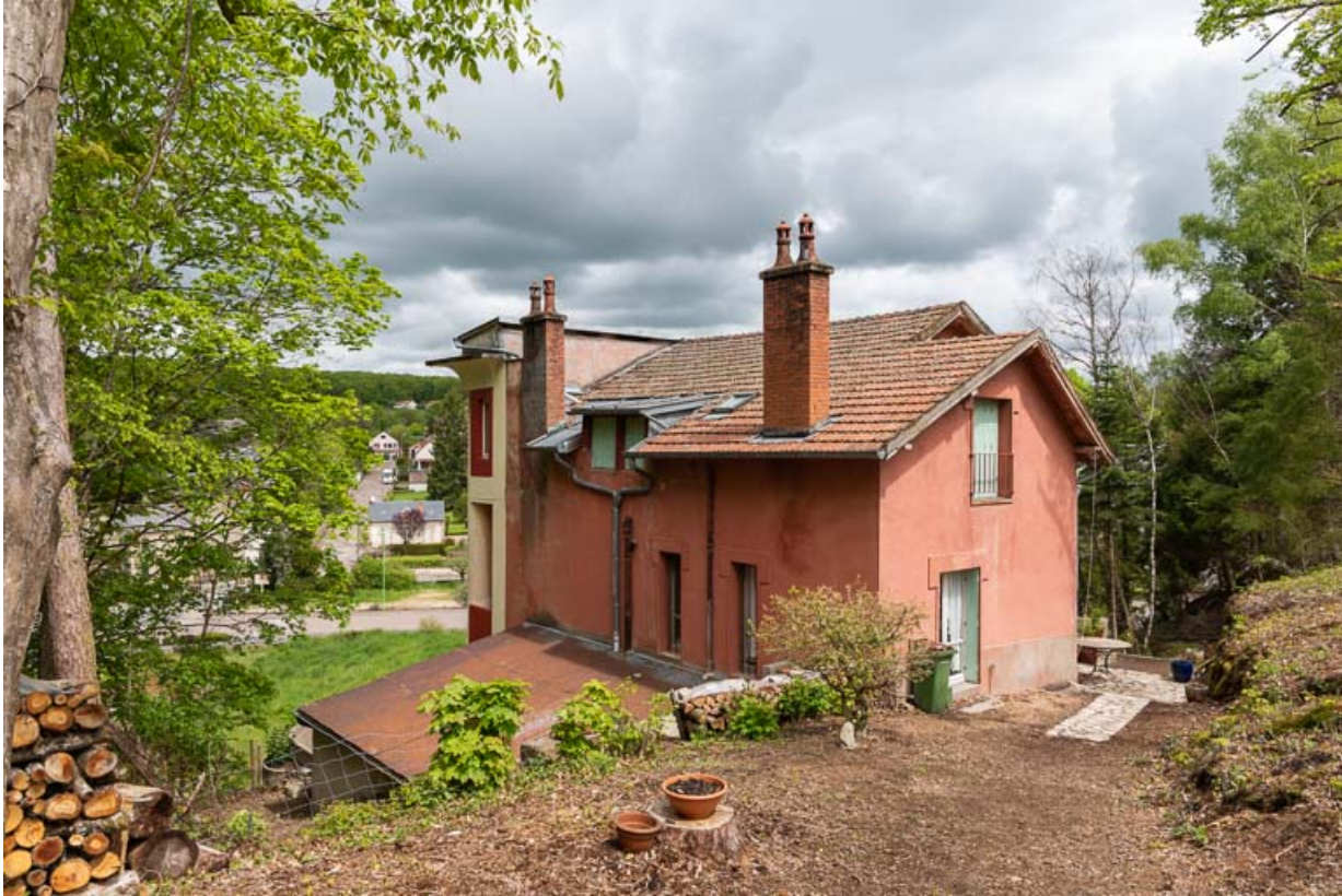
Façade sud, vue de trois-quarts.

58, Saint-Honoré-les-Bains, 1 allée de la Chapelle