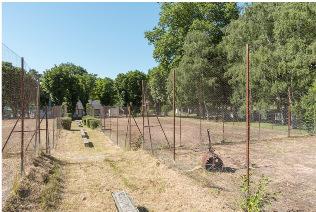
Allée centrale des courts de tennis, vue en direction du nord.

58, Saint-Honoré-les-Bains rue du Docteur Segard