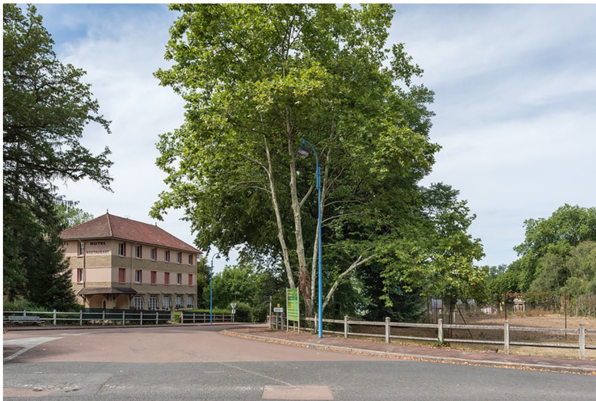
Situation des terrains au croisement de la rue Joseph Duriaux et de l'avenue du Docteur Segard.

58, Saint-Honoré-les-Bains rue du Docteur Segard