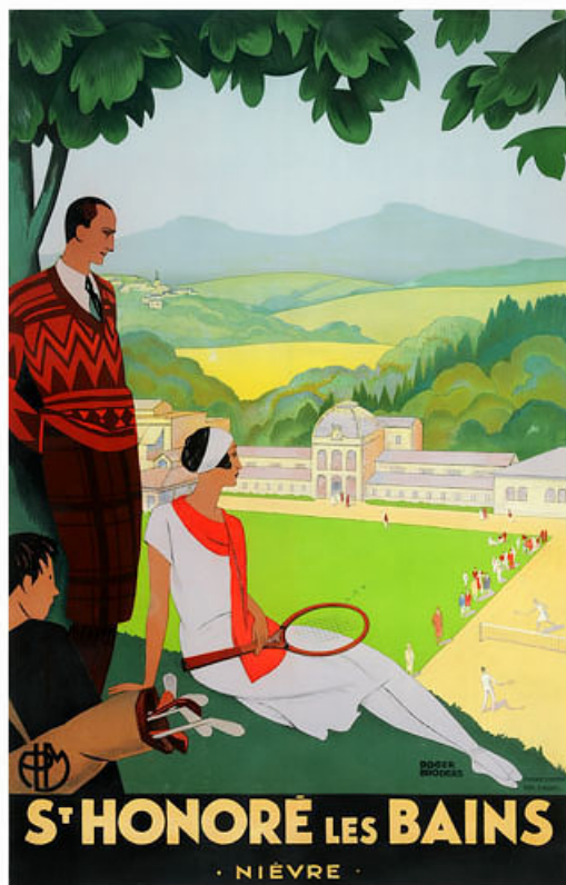
Affiche publicitaire de la Compagnie des chemins de fer de Paris à Lyon et à la Méditerranée (1928).

58, Vandenesse route départementale 3, lieudit : Chèvres