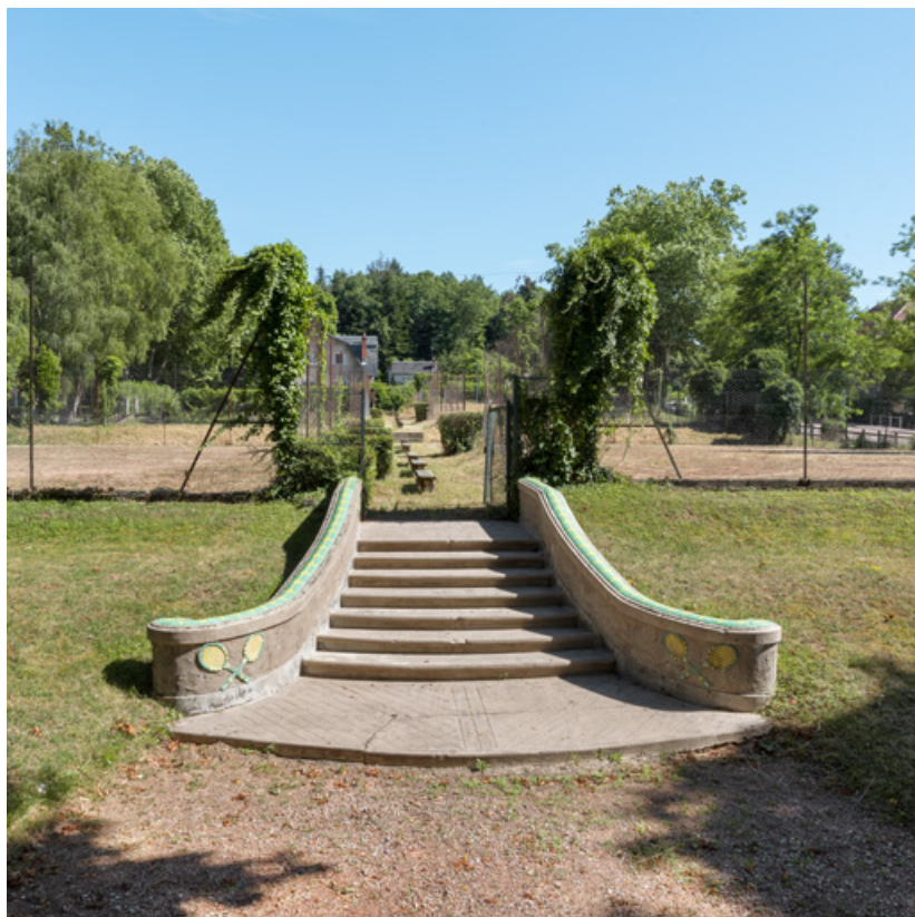
Escalier conduisant aux courts de tennis, vue de face.

58, Saint-Honoré-les-Bains rue du Docteur Segard