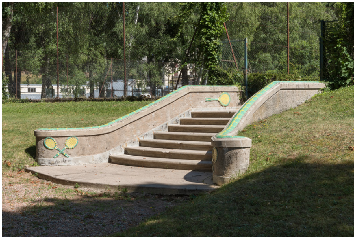
Escalier conduisant aux courts de tennis, vue de trois-quarts.

58, Saint-Honoré-les-Bains rue du Docteur Segard