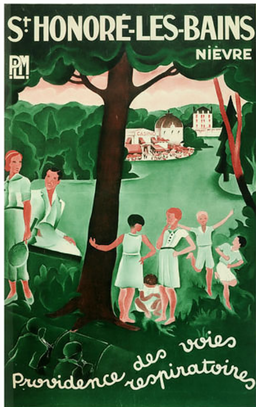
Affiche publicitaire de la Compagnie des chemins de fer de Paris à Lyon et à la Méditerranée (vers 1930). 58, Saint-Honoré-les-Bains rue du Docteur Segard