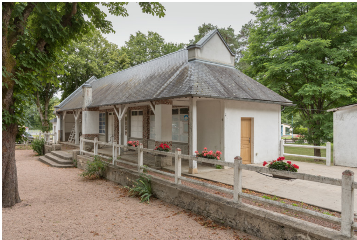
Club-house, vue d'ensemble.

58, Saint-Honoré-les-Bains rue du Docteur Segard