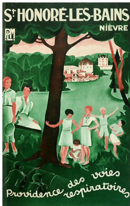
Affiche publicitaire de la Compagnie des chemins de fer de Paris à Lyon et à la Méditerranée (vers 1930).

58, Saint-Honoré-les-Bains rue du Docteur Segard