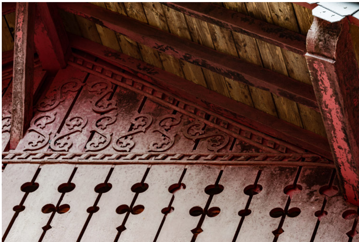
Placage de planches en bois ajourées et sculptées du pignon, détail de la partie droite.

58, Saint-Honoré-les-Bains, 12 avenue Jean Mermoz