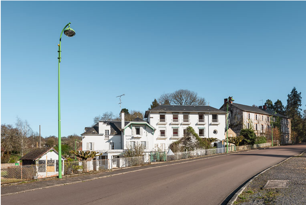
Vue d'ensemble depuis l'avenue Jean Mermoz.

58, Saint-Honoré-les-Bains, 4 avenue Jean Mermoz