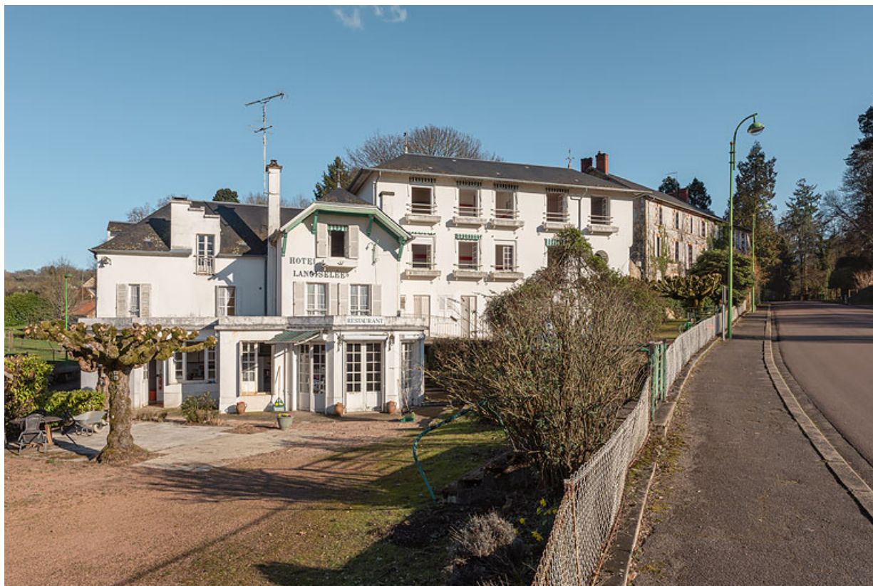
Vue d'ensemble depuis l'avenue Jean Mermoz.

58, Saint-Honoré-les-Bains, 4 avenue Jean Mermoz