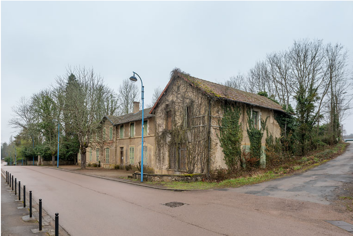
Façade principale, vue depuis le sud-est.

58, Saint-Honoré-les-Bains, 16 avenue Jean Mermoz