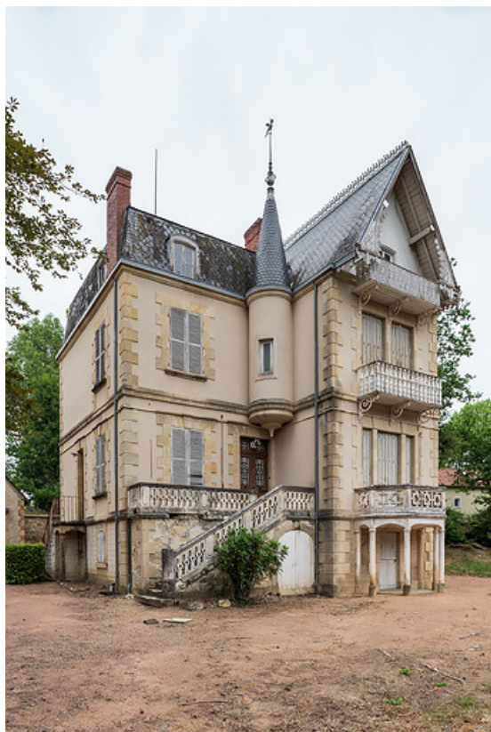
Façade principale, vue depuis le sud, état actuel.

58, Saint-Honoré-les-Bains, 8 avenue Jean Mermoz