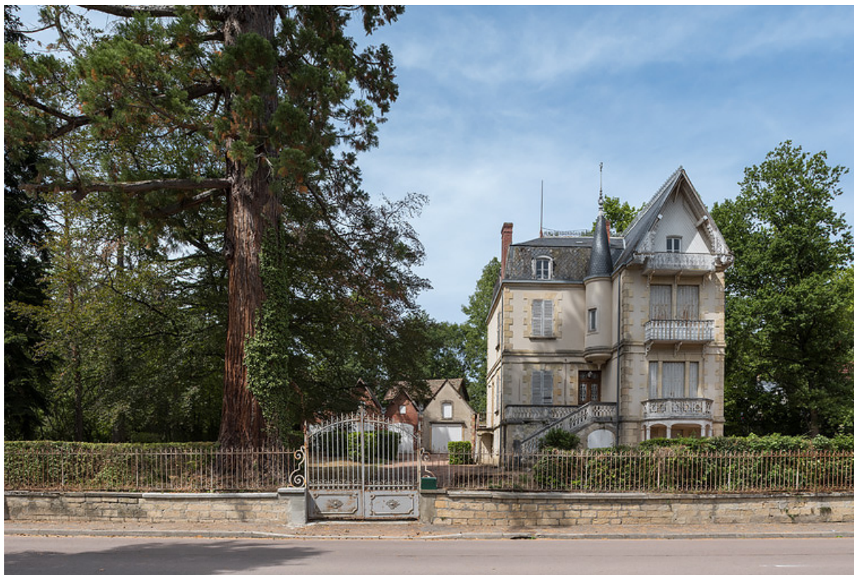
Situation de la villa, actuelle avenue Jean Mermoz.

58, Saint-Honoré-les-Bains, 8 avenue Jean Mermoz