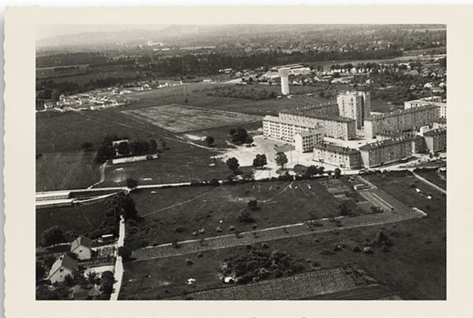
Vue aérienne du quartier Saint-Laurent en construction. Photographie ancienne, s.d., [1970-1971].

58, Cosne-Cours-sur-Loire avenue de Verdun