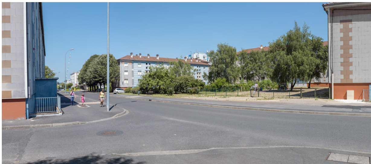
Vue depuis le croisement de l'avenue de la Paix et l'allée Antoine de Saint-Exupéry sur le square entre les bâtiments J, D et C. 58, Cosne-Cours-sur-Loire avenue de Verdun