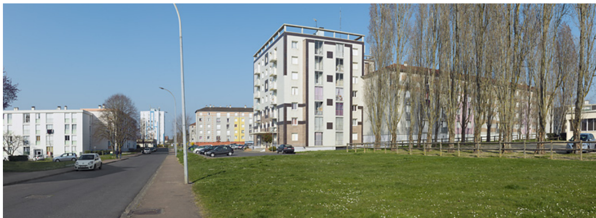
Vue générale depuis le croisement de la rue du Berry et de la rue Pierre et Marie Curie en direction du nord. 58, Cosne-Cours-sur-Loire avenue de Verdun