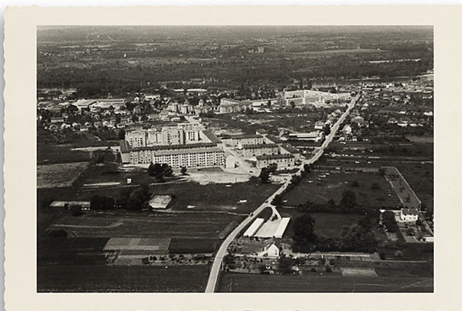
Vue aérienne du quartier Saint-Laurent en construction. Photographie ancienne, s.d., [1970-1971].

58, Cosne-Cours-sur-Loire avenue de Verdun