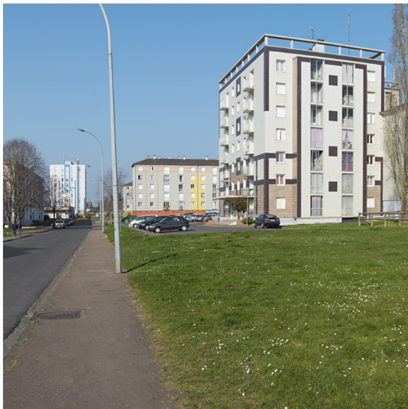
Vue générale depuis la rue du Berry en direction du nord, au premier plan le bloc G. 58, Cosne-Cours-sur-Loire avenue de Verdun