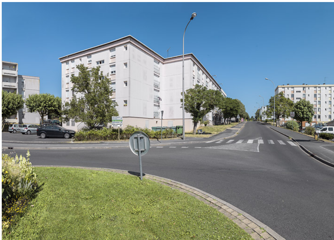
Vue depuis l'extrémité ouest de l'avenue de la Paix en direction de l'est.

58, Cosne-Cours-sur-Loire avenue de Verdun