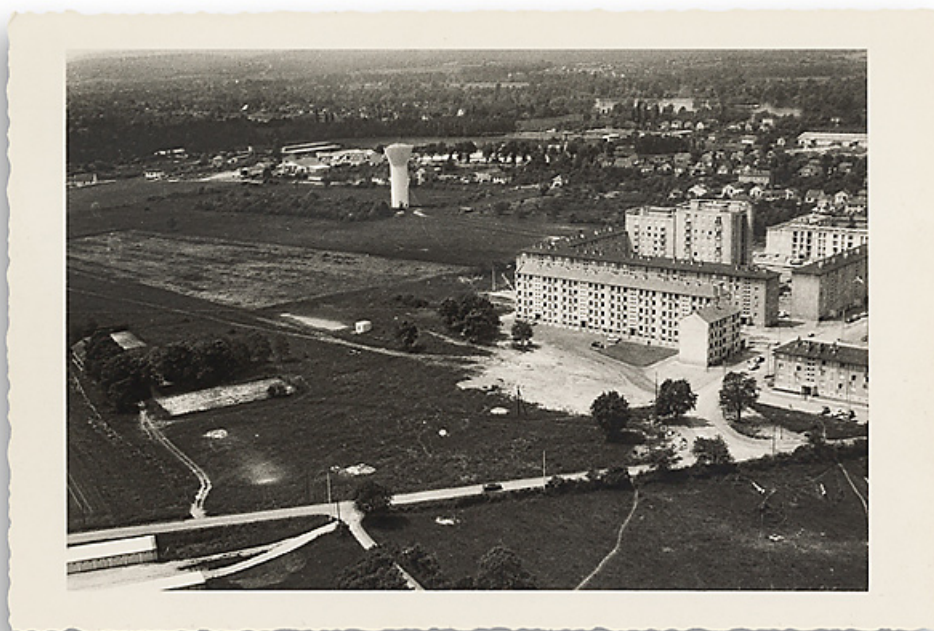
Vue aérienne du quartier Saint-Laurent en construction. Photographie ancienne, s.d., [1970-1971].

58, Cosne-Cours-sur-Loire avenue de Verdun