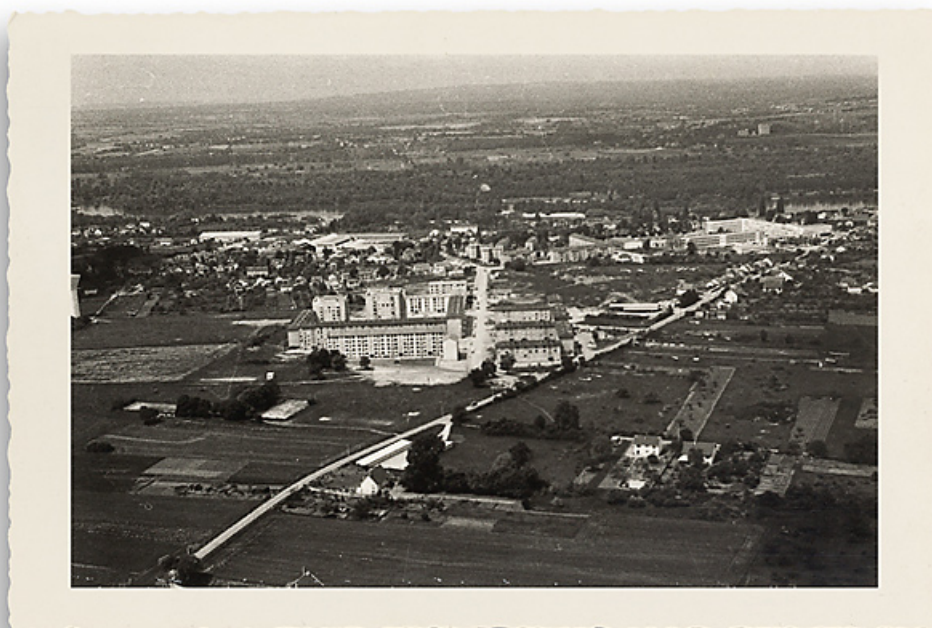
Vue aérienne du quartier Saint-Laurent en construction. Photographie ancienne, s.d., [1970-1971].

58, Cosne-Cours-sur-Loire avenue de Verdun