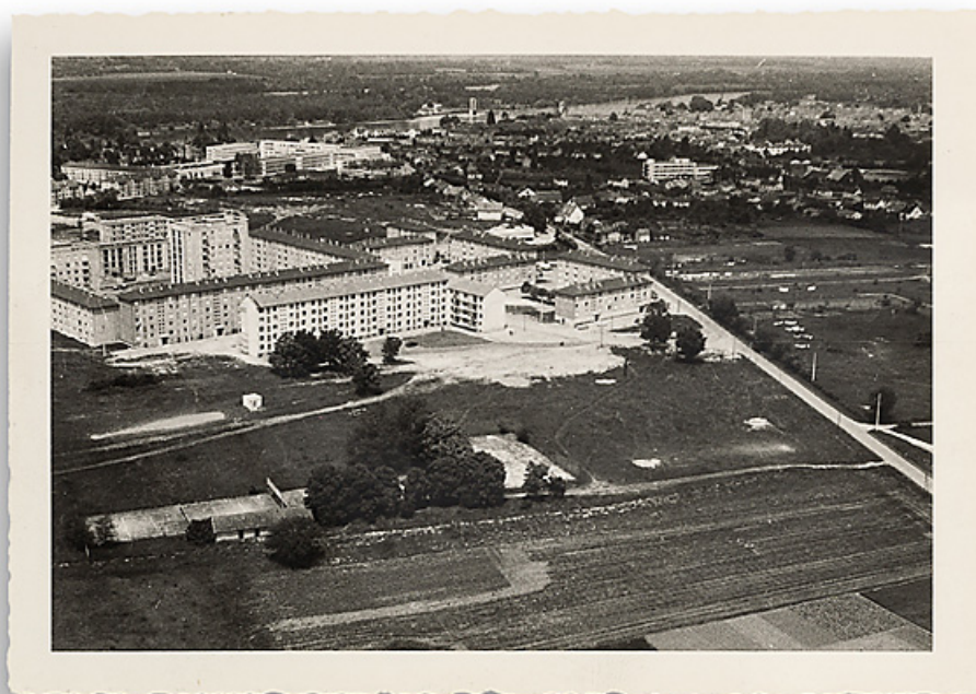
Vue aérienne du quartier Saint-Laurent en construction. Photographie ancienne, s.d., [1970-1971].

58, Cosne-Cours-sur-Loire avenue de Verdun