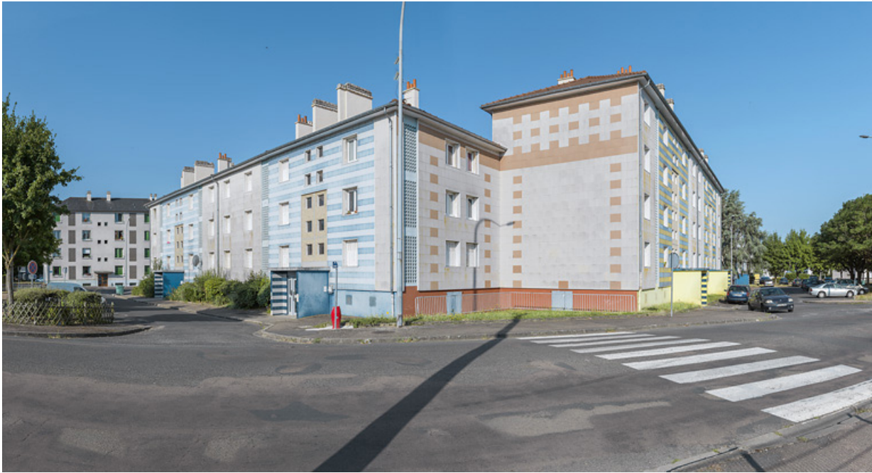
Bâtiments A et B, façades antérieures et latérales.

58, Cosne-Cours-sur-Loire avenue de Verdun