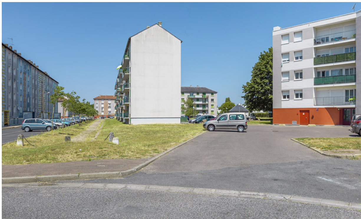
Bâtiment SIDEN, façades postérieure ouest et latérale sud.

58, Cosne-Cours-sur-Loire avenue de Verdun