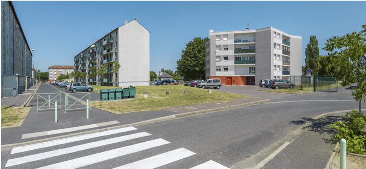
Bâtiment E, SIDEN et X depuis la place Pierre et Marie Curie.

58, Cosne-Cours-sur-Loire avenue de Verdun