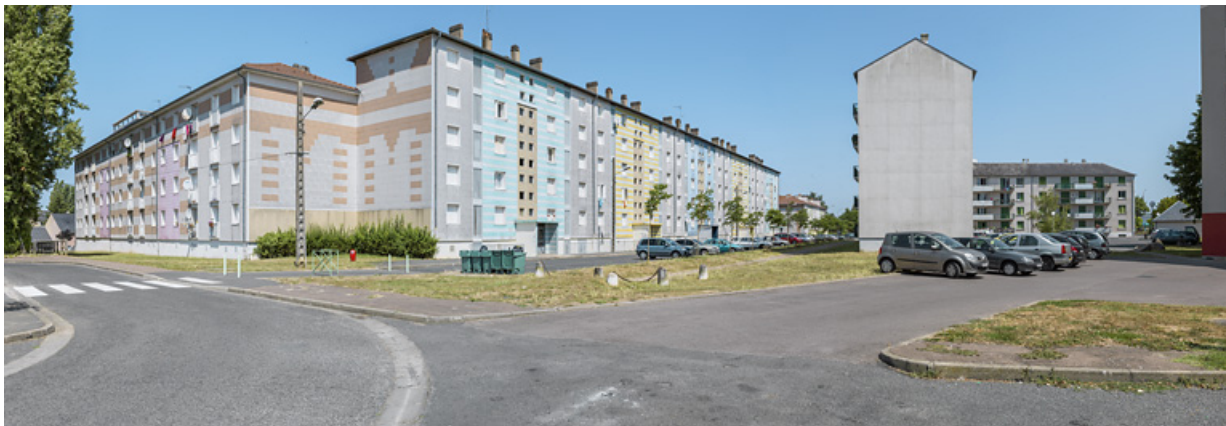
Bâtiment F, E et SIDEN depuis la place Pierre et Marie Curie.

58, Cosne-Cours-sur-Loire avenue de Verdun