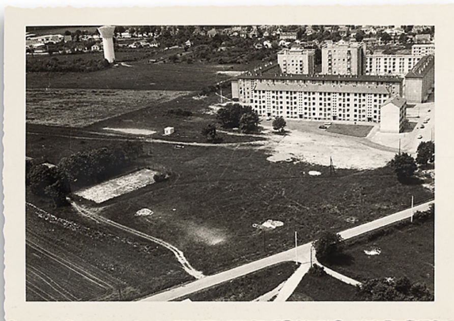
Vue aérienne du quartier Saint-Laurent en construction. Photographie ancienne, s.d., [1970-1971].

58, Cosne-Cours-sur-Loire avenue de Verdun