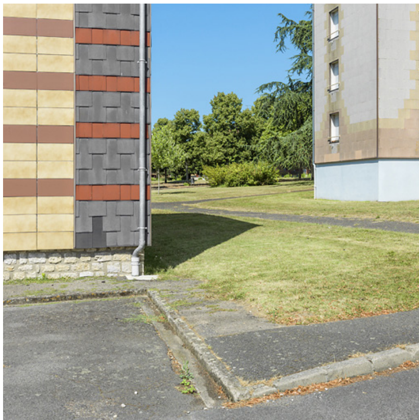
Vue sur le parc de la cité Binot, entre les bâtiments Binot-A et Million-1.

58, Cosne-Cours-sur-Loire avenue de Verdun