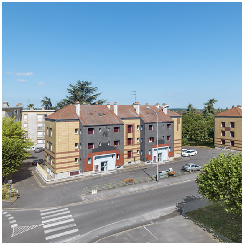
Bâtiment Binot-D, façade antérieure est. 58, Cosne-Cours-sur-Loire avenue de Verdun