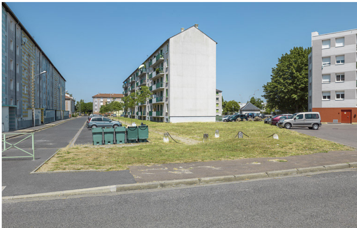
Bâtiment SIDEN, façades postérieure ouest et latérale sud.

58, Cosne-Cours-sur-Loire avenue de Verdun