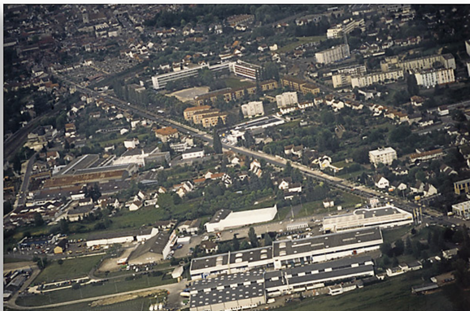
Vue aérienne du sud de Cosne-Cours-sur-Loire et du quartier Saint-Laurent. Photographie ancienne, s.d., [1990-2000].

58, Cosne-Cours-sur-Loire avenue de Verdun