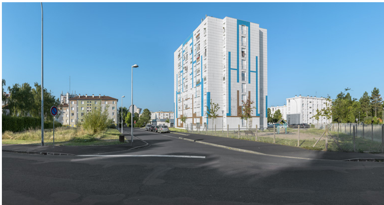
Tour Schweitzer, façade postérieur est et façade latérale nord.

58, Cosne-Cours-sur-Loire avenue de Verdun