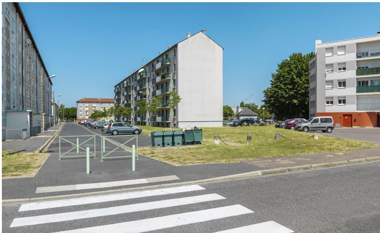
Vue générale depuis la place Perre et Marie Curie en direction du nord. 58, Cosne-Cours-sur-Loire avenue de Verdun