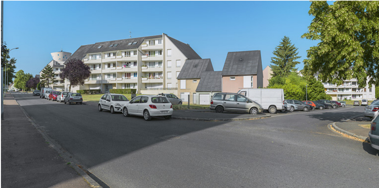
Les Hauts de Loire, vue générale.

58, Cosne-Cours-sur-Loire avenue de Verdun