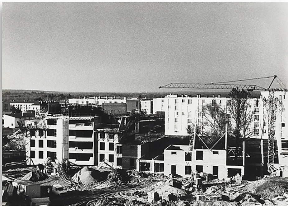
Construction des immeubles du programme Les Hauts de Loire. Photographie ancienne, ca. novembre 1981. (Archives municipales Cosne-Cours-sur-Loire, 202W683 - 2Fi182) 58, Cosne-Cours-sur-Loire avenue de Verdun

Lieu de conservation : Archives municipales, Cosne-Cours-sur-Loire - Cote du document : 202W683 - 2Fi182