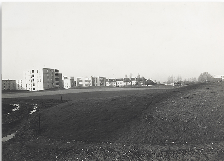
Aménagement du parc Schweitzer, à l'arrière-plan les immeubles 27 et 26. Photographie ancienne, ca.1982.

58, Cosne-Cours-sur-Loire avenue de Verdun