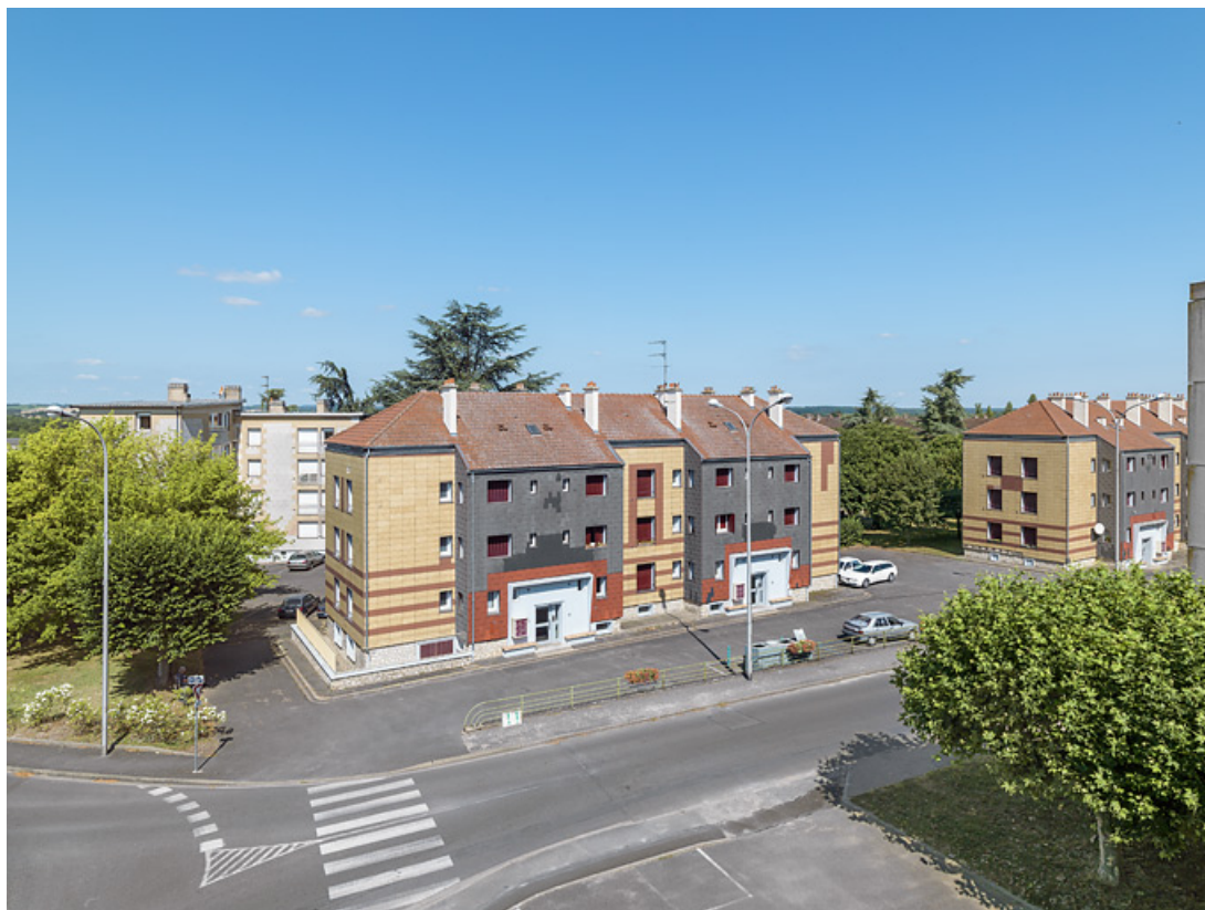
Bâtiment Binot-D, vue en situation.

58, Cosne-Cours-sur-Loire avenue de Verdun