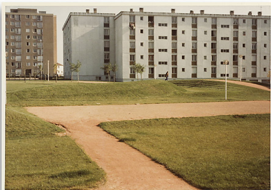
Aménagement du parc Schweitzer, à l'arrière-plan les immeubles B-1 et B-2 et la tour Schweitzer. Photographie ancienne, 1982.

58, Cosne-Cours-sur-Loire avenue de Verdun