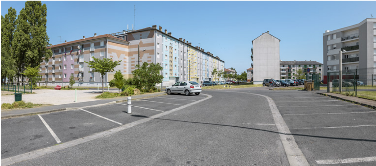
Vue générale depuis la place Pierre et Marie Curie.

58, Cosne-Cours-sur-Loire avenue de Verdun