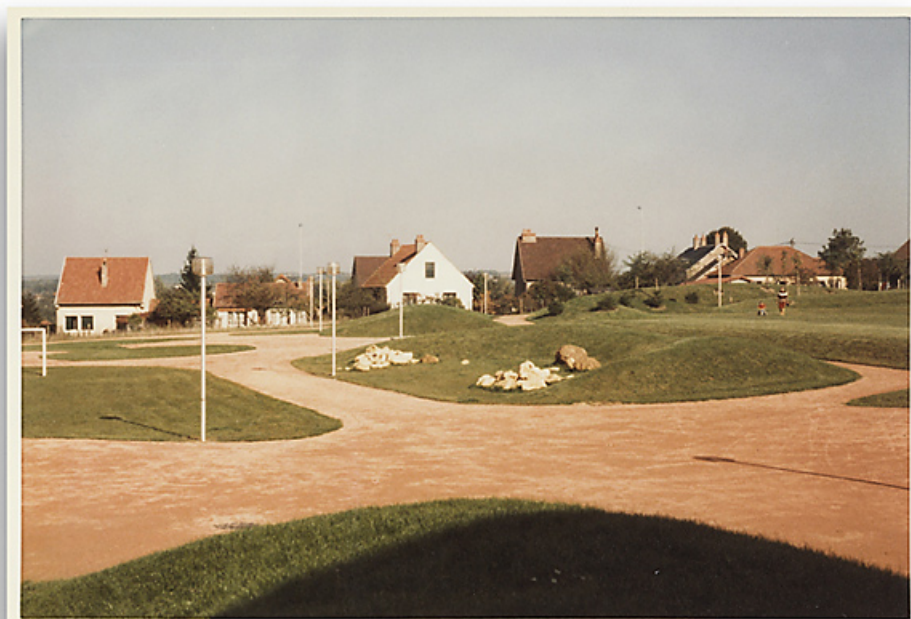
Aménagement du parc Schweitzer. Photographie ancienne, 1982. (Archives municipales Cosne-Cours-sur-Loire, 202W683 - 2Fi50) 58, Cosne-Cours-sur-Loire avenue de Verdun

Lieu de conservation : Archives municipales, Cosne-Cours-sur-Loire - Cote du document : 202W683 - 2Fi50