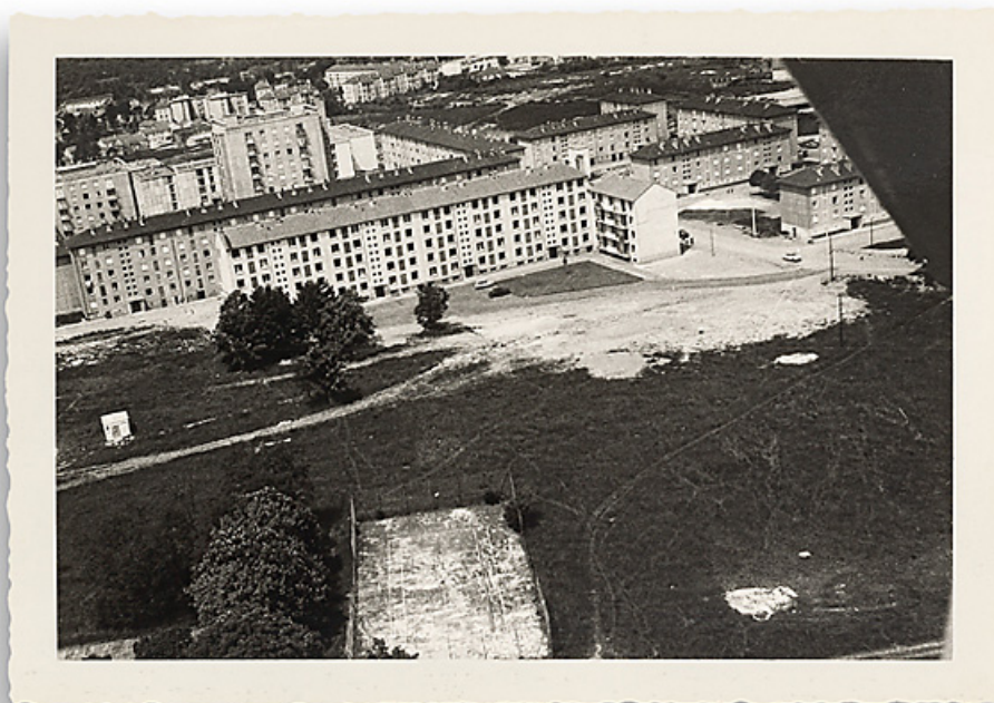
Vue aérienne du quartier Saint-Laurent en construction. Photographie ancienne, s.d., [1970-1971].

58, Cosne-Cours-sur-Loire avenue de Verdun