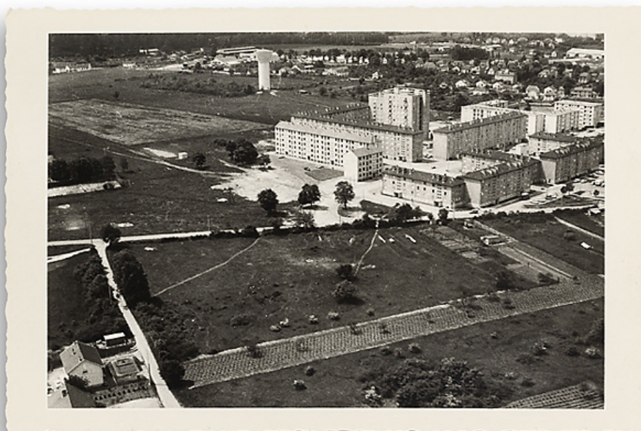
Vue aérienne du quartier Saint-Laurent en construction. Photographie ancienne, s.d., [1970-1971].

58, Cosne-Cours-sur-Loire avenue de Verdun