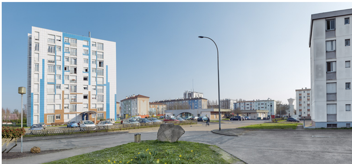
Vue générale entre la tour Schweitzer et le bâtiment B.1 en direction du sud.

58, Cosne-Cours-sur-Loire avenue de Verdun