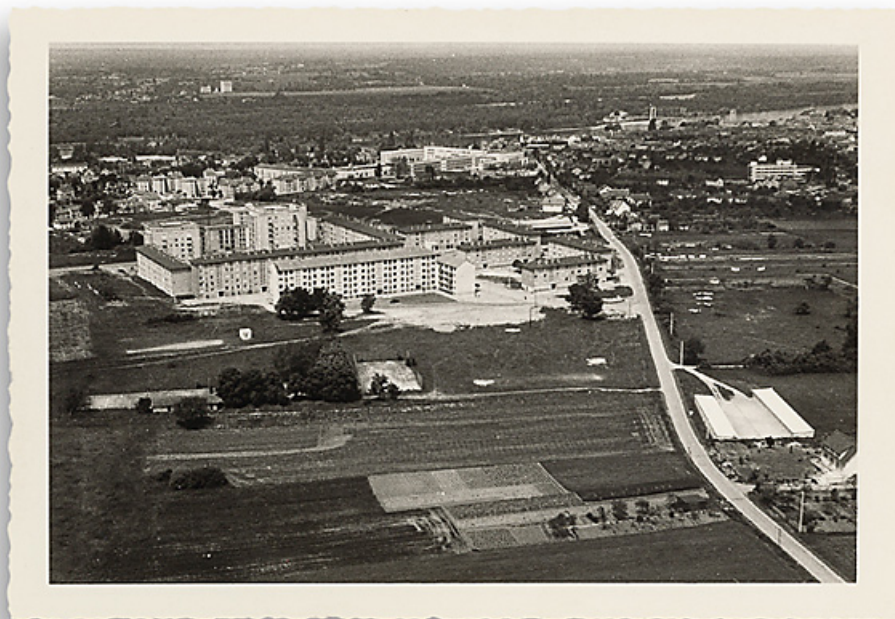
Vue aérienne du quartier Saint-Laurent en construction. Photographie ancienne, s.d., [1970-1971].

58, Cosne-Cours-sur-Loire avenue de Verdun