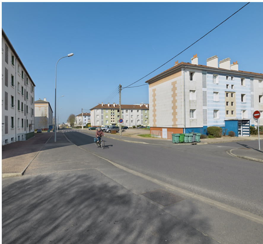
Vue générale depuis le nord de l'avenue de la Paix en direction de l'ouest.

58, Cosne-Cours-sur-Loire avenue de Verdun