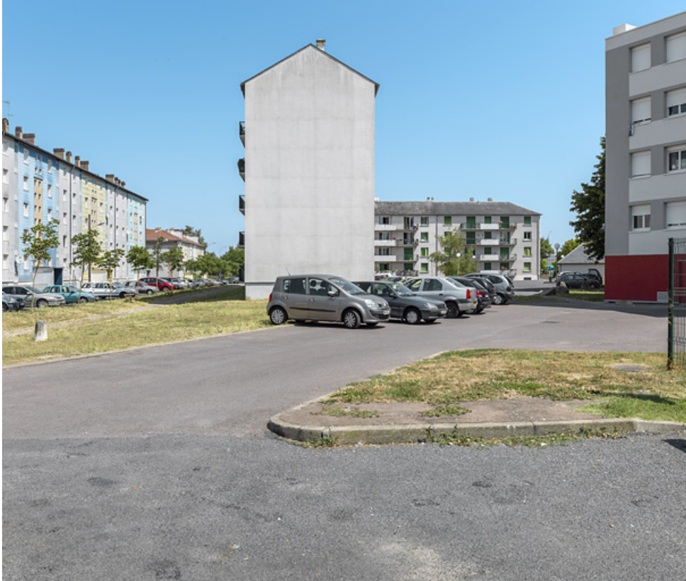
Bâtiment SIDEN, façade latérale sud et façade postérieure sud.

58, Cosne-Cours-sur-Loire avenue de Verdun