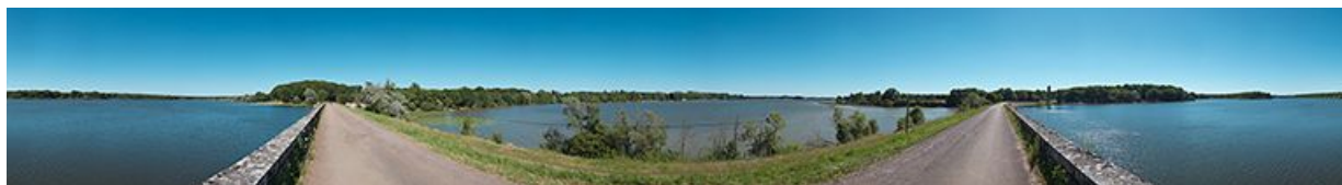
Vue panoramique des étangs de Baye et de Vaux depuis la digue les séparant.

58, La Collancelle, lieudit : bief de partage