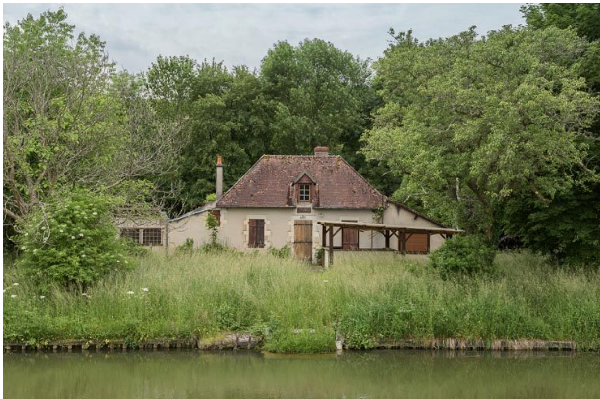
Vue de face de la maison éclusière, depuis la rive droite.

58, Surgy, lieudit : bief 50 du versant Seine