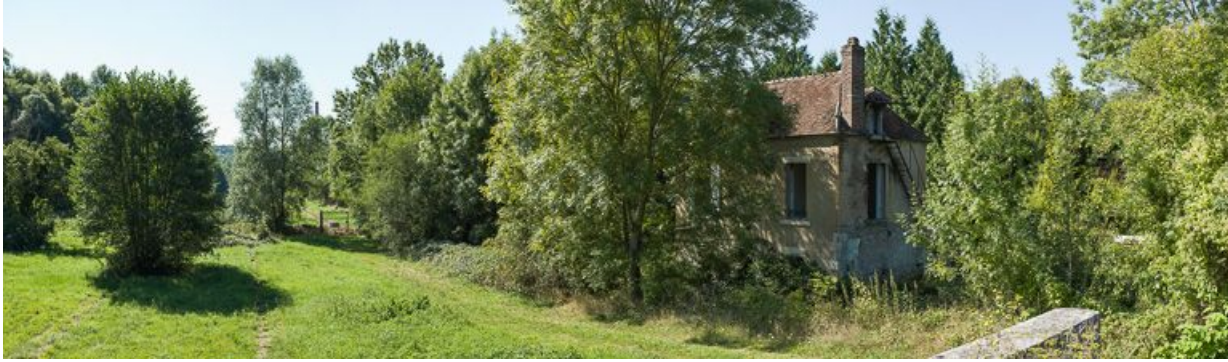
Vue d'ensemble du site avec l'ancienne maison éclusière et le sas comblé.

58, Surgy, lieudit : bief 48 du versant Seine