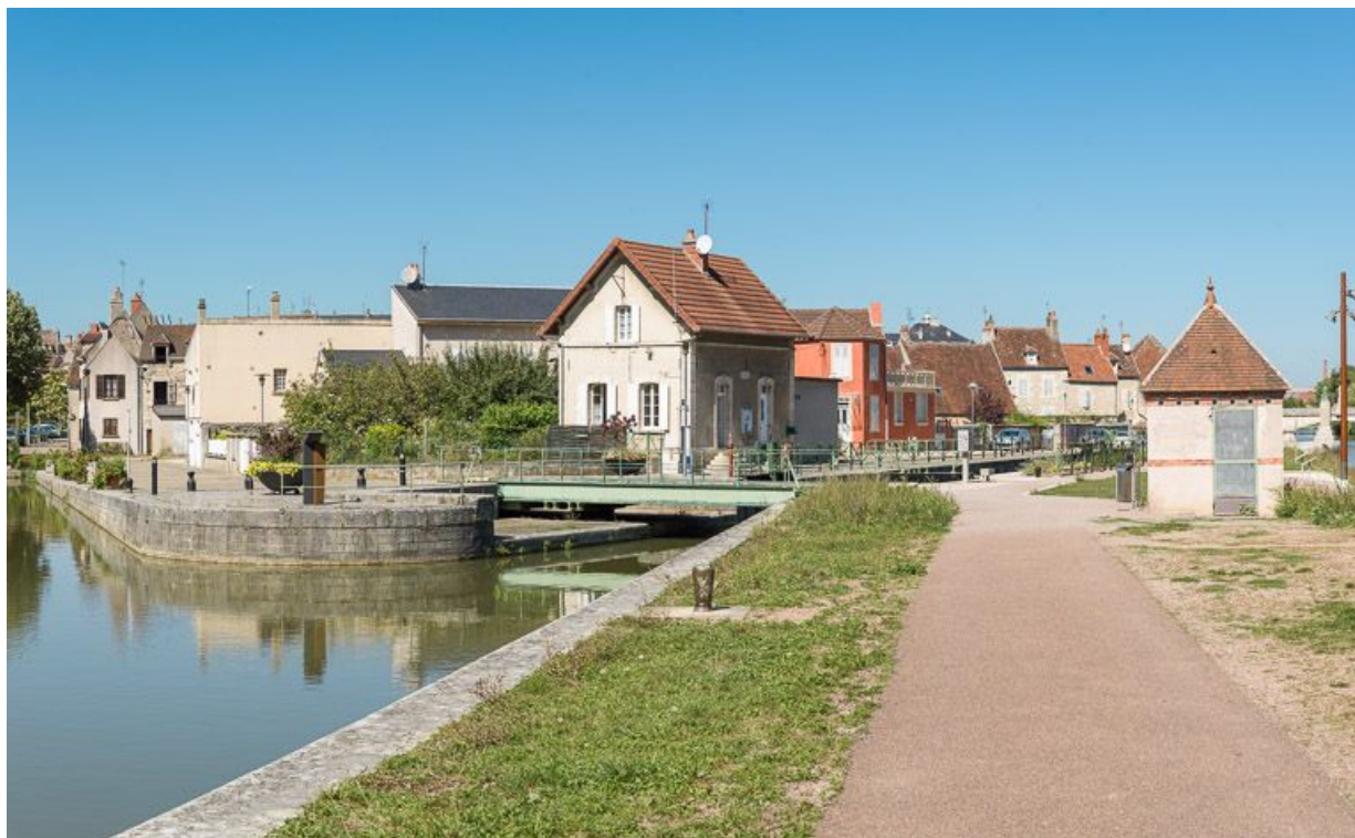
Vue d'ensemble du site, pris d'amont. Au premier plan, le pont mobile (IA58000966). 58, Clamecy, lieudit : bief 47 du versant Seine

N° de l'illustration : 20135800460NUC4AQ