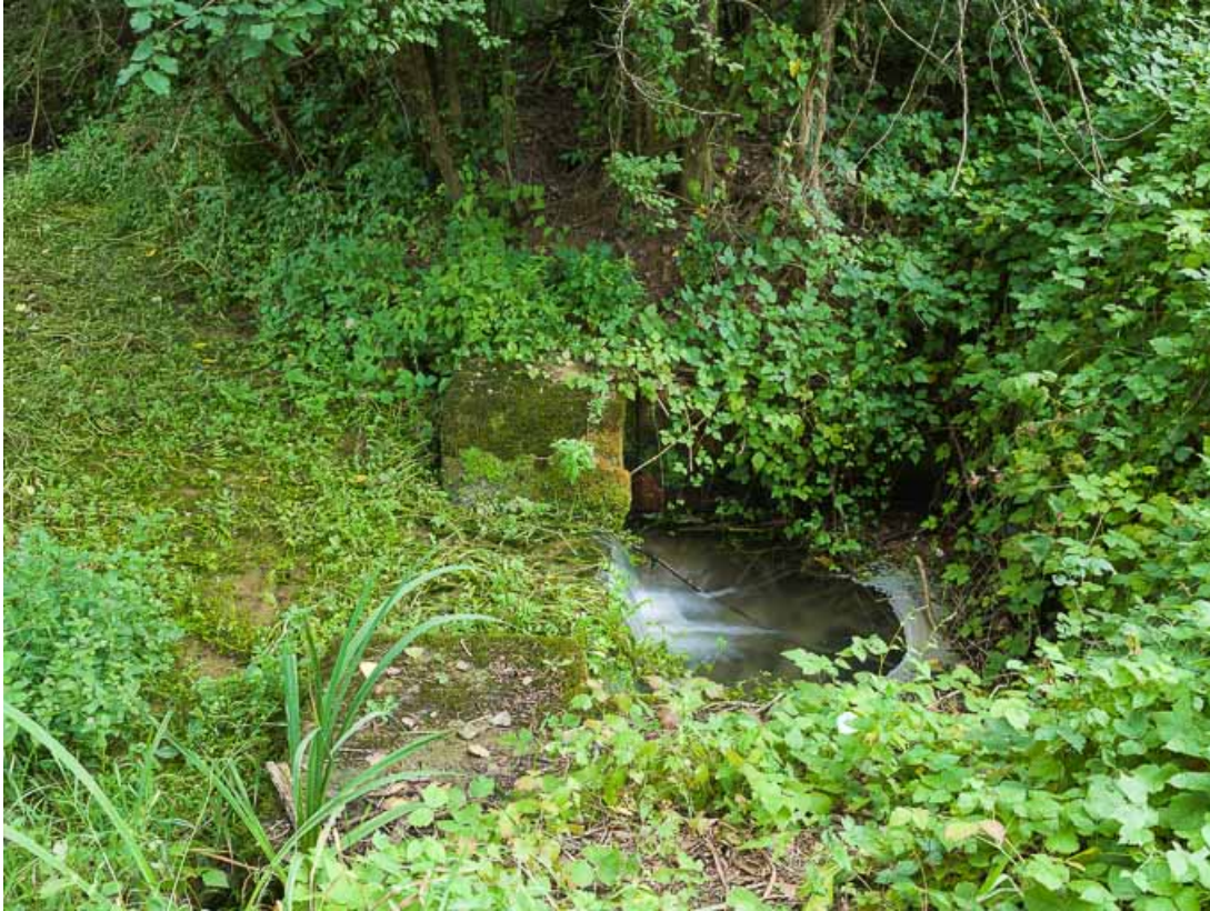
Vue de l'aqueduc dans la végétation.

58, Villiers-sur-Yonne, lieudit : bief 43 du versant Seine