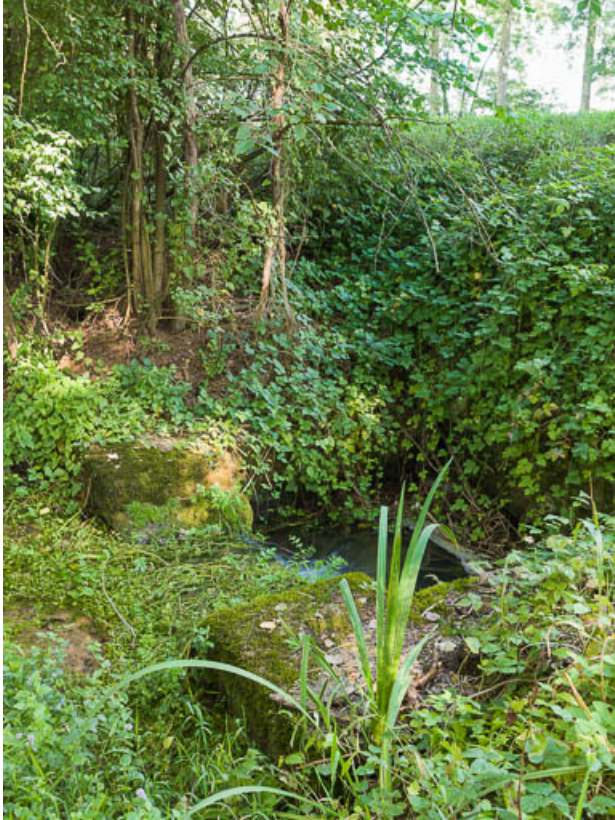
Vue de l'aqueduc dans la végétation.

58, Villiers-sur-Yonne, lieudit : bief 43 du versant Seine