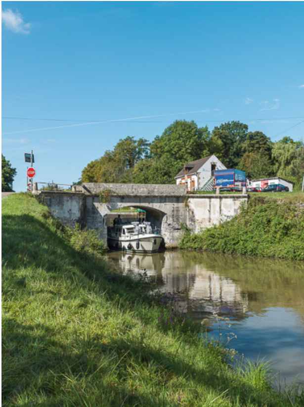
Vue d'ensemble du pont, avec passage d'un bateau. 58, Marigny-sur-Yonne, lieudit : bief 31 du versant Seine