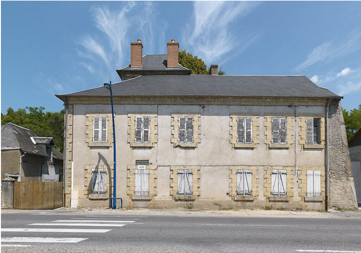
La maison éclusière, vue de face.

58, Saint-Léger-des-Vignes, lieudit : bief 35 du versant Loire