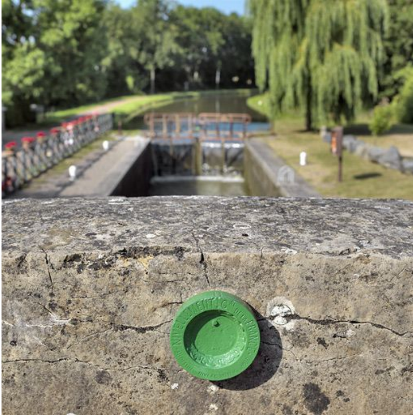
Parapet du pont sur écluse, avec au premier plan le repère de nivellement Bourdalouë. 58, Biches, lieudit : bief 21 du versant Loire