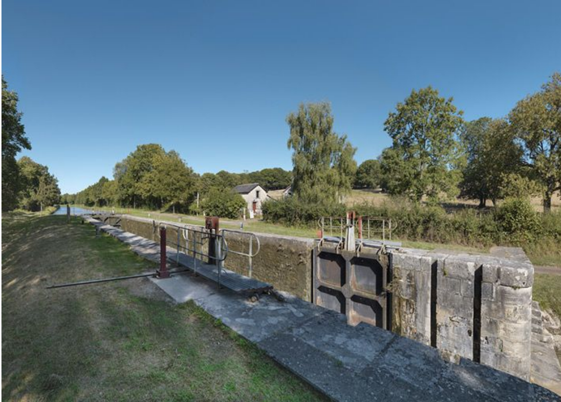
Le sas d'écluse au premier plan et la maison éclusière en arrière-plan.

58, Mont-et-Marré, lieudit : bief 11 du versant Loire