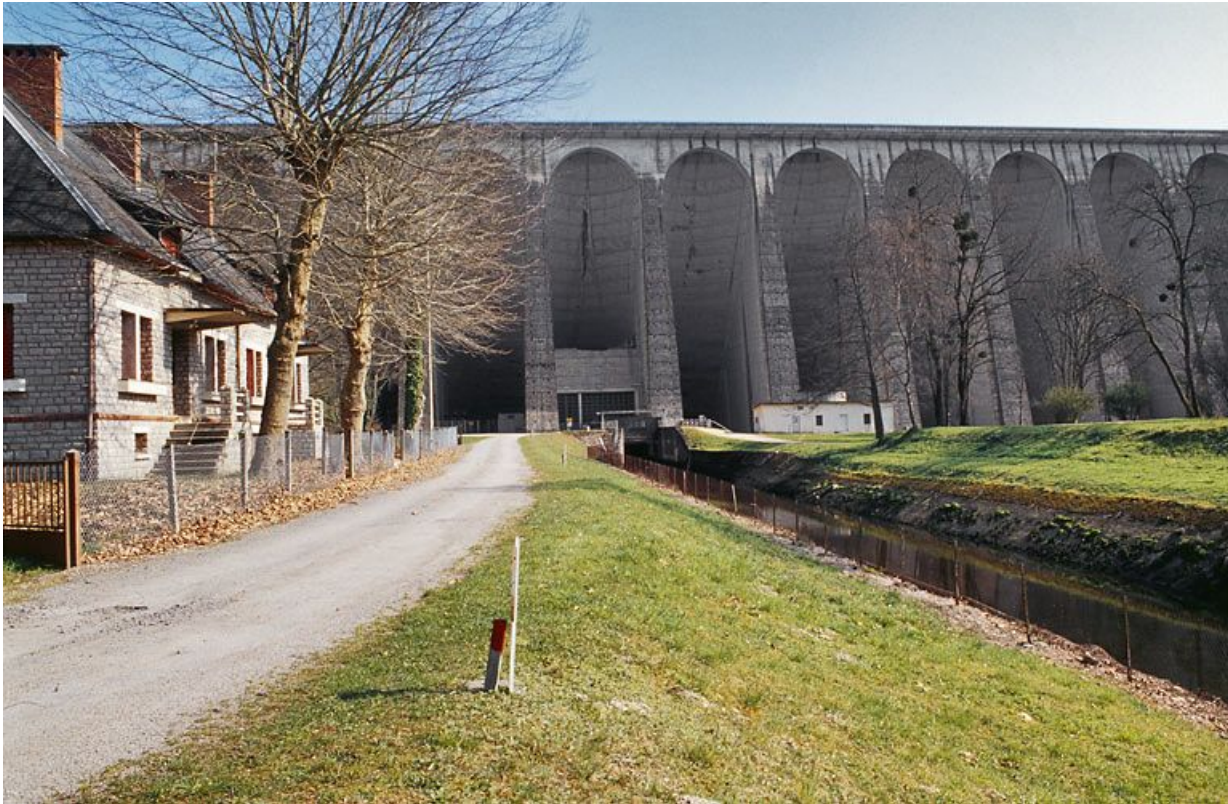
Vue d'aval : maisons et bureaux.