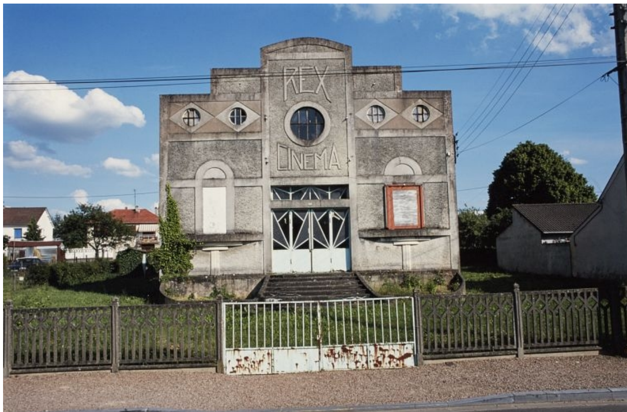
Élévation principale, en 2000.