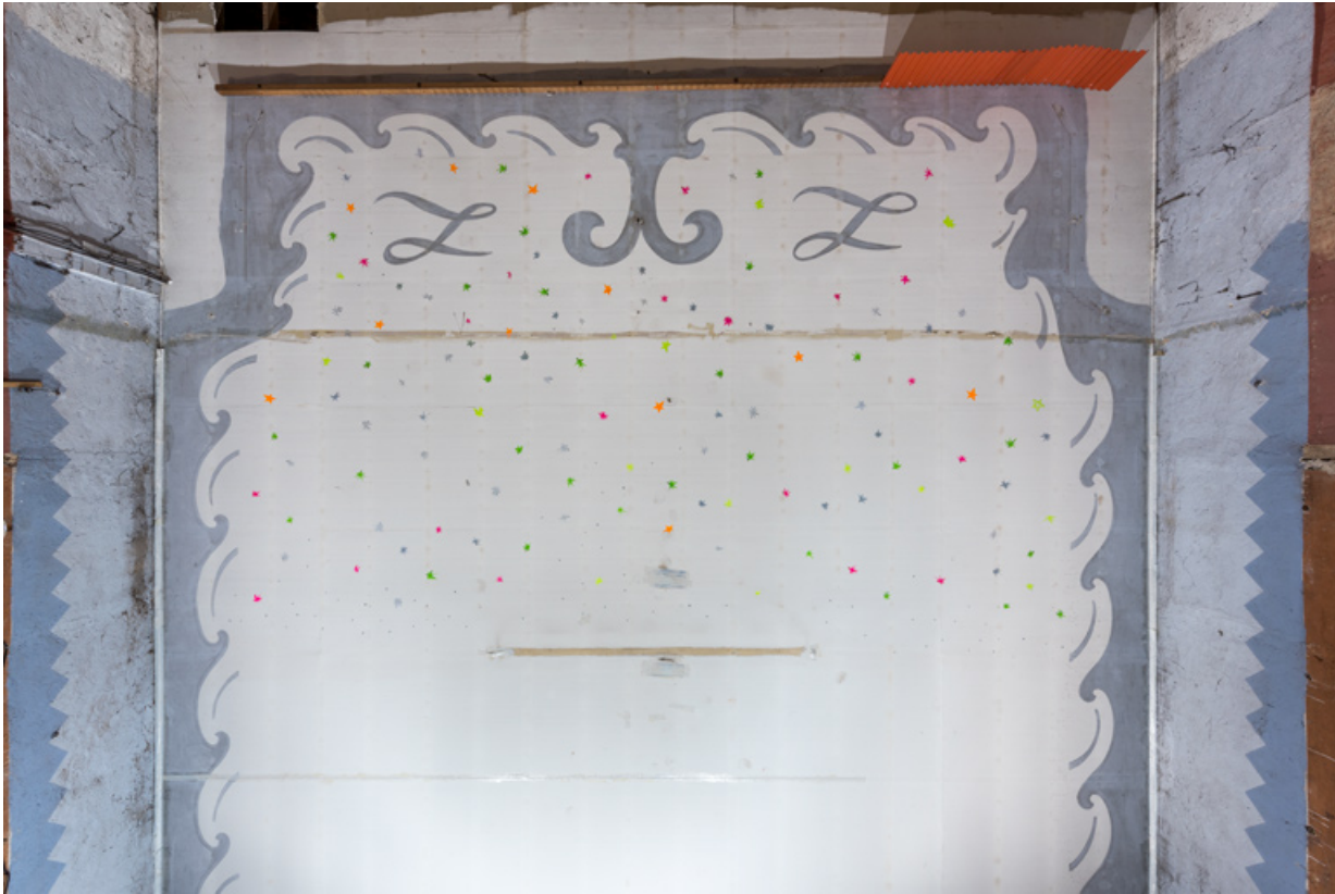
Salle : décor du plafond (côté écran). 58, Guérigny, 13 rue Masson