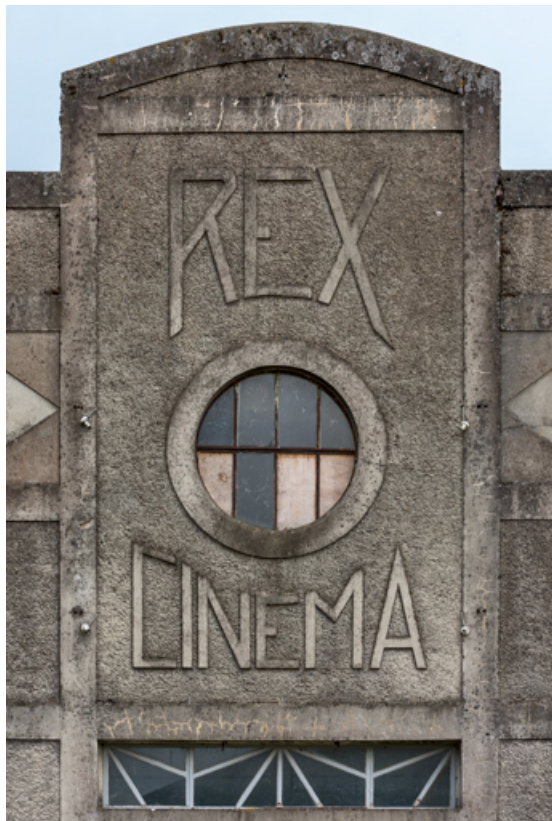
Façade antérieure : cabine du projectionniste et enseigne. 58, Guérigny, 13 rue Masson