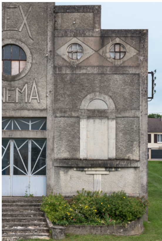
Façade antérieure : travée à droite.