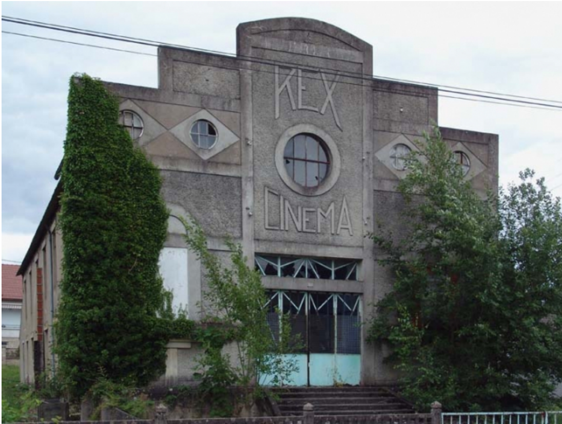
Elévation principale, en 2005.