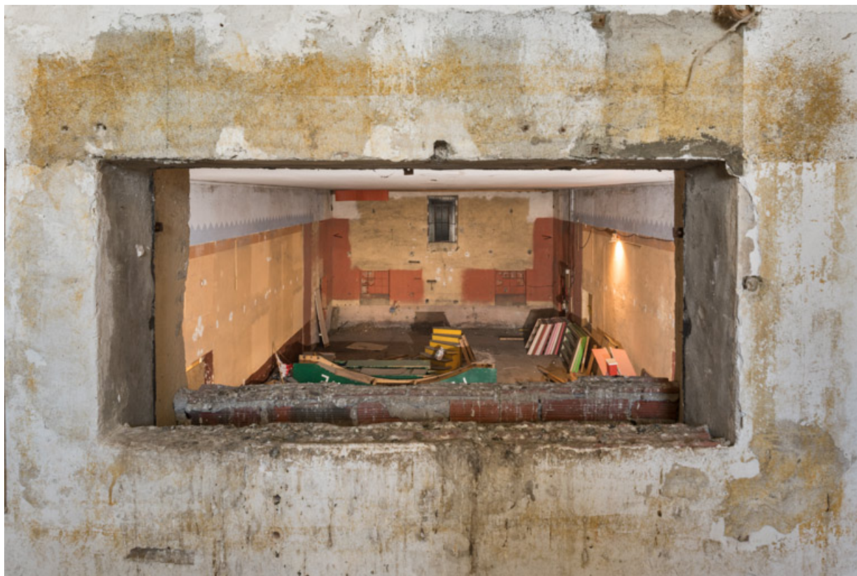
Salle, vue de la cabine du projectionniste. 58, Guéigny, 13 rue Masson