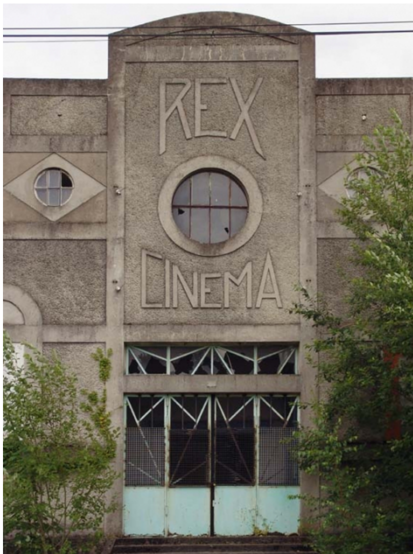
Elévation principale, en 2005 : travée centrale.