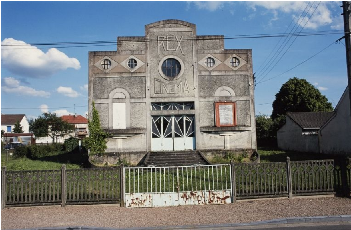
Élévation principale, en 2000.