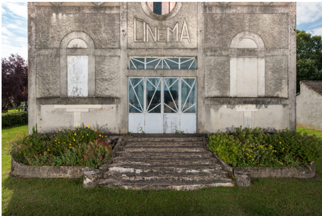
Façade antérieure : entrée et perron.