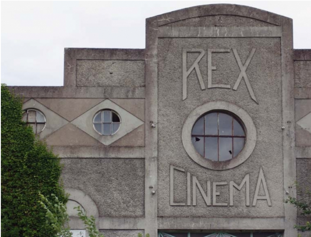
Elévation principale, en 2005 : décor en partie haute.