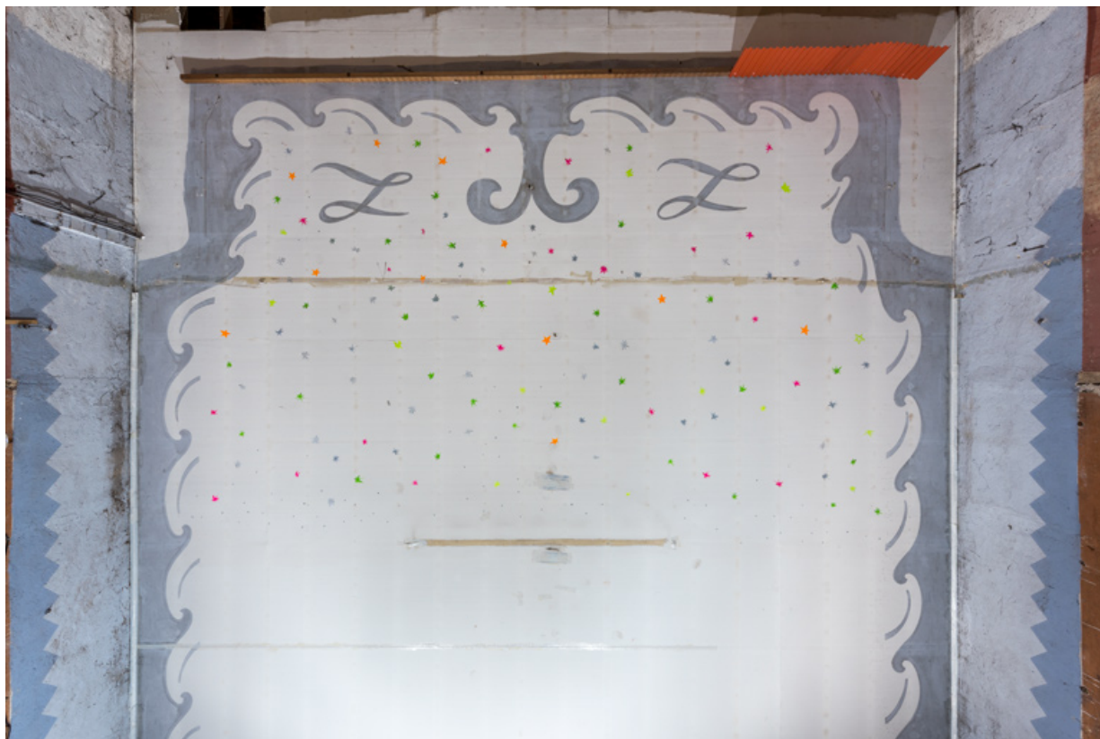
Salle : décor du plafond (côté écran).