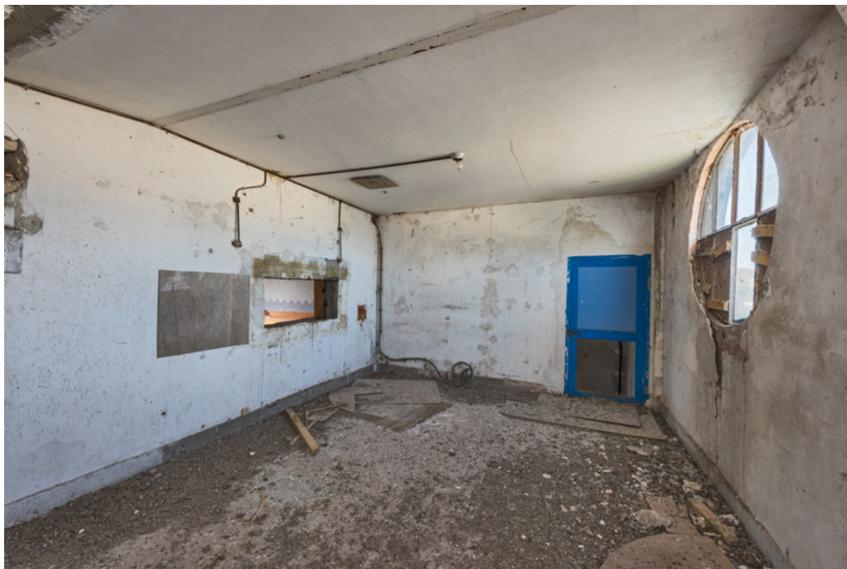
Cabine du projectionniste.