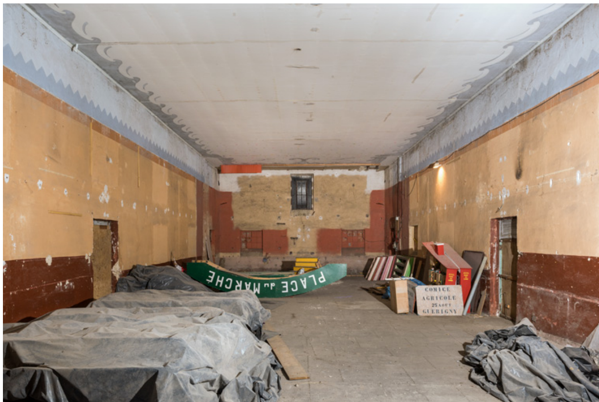
Salle, depuis l'entrée.