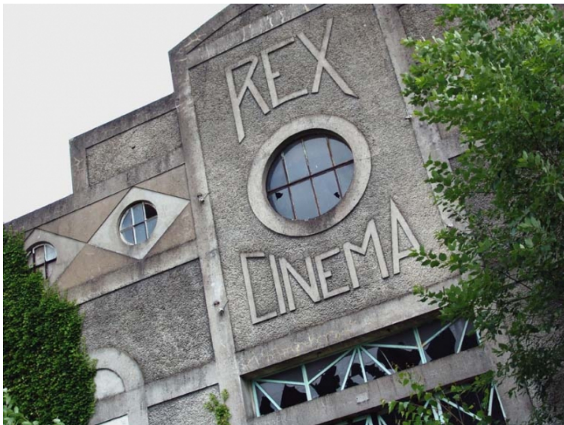
Elévation principale (en biais), en 2005.