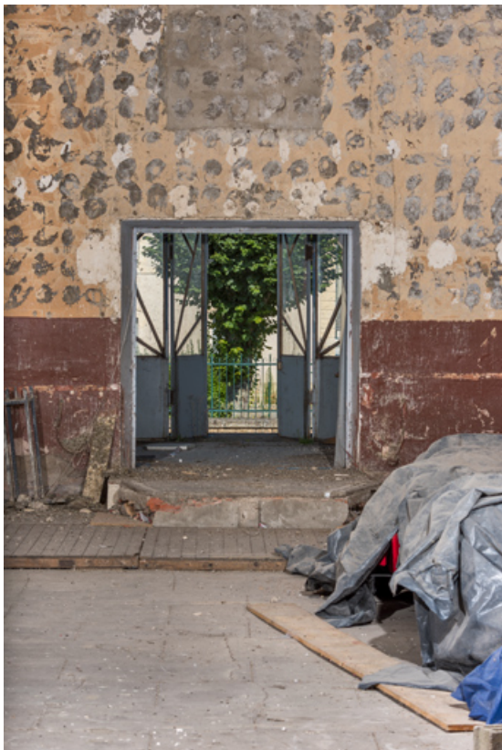
Salle : entrée.