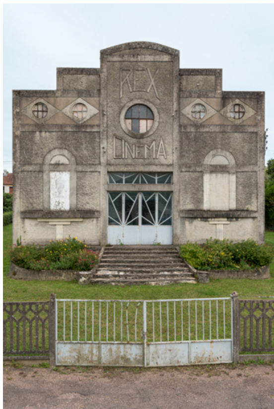
Façade antérieure (cadrage vertical).