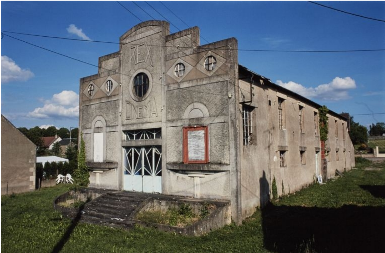
Élévation principale et latérale droite (en 2000), vue de trois-quarts. 58, Guérigny, 13 rue Masson