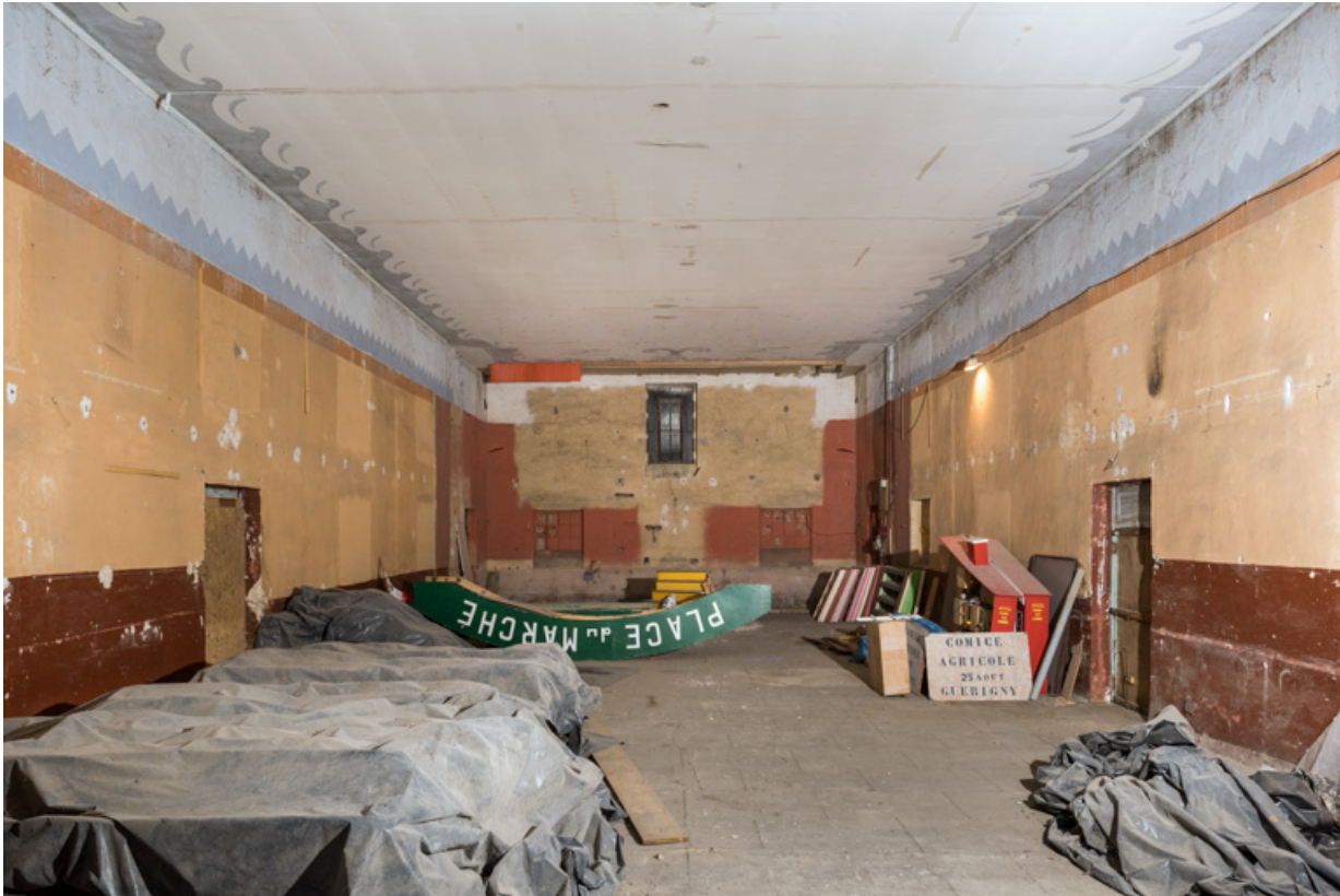
Salle, depuis l'entrée.