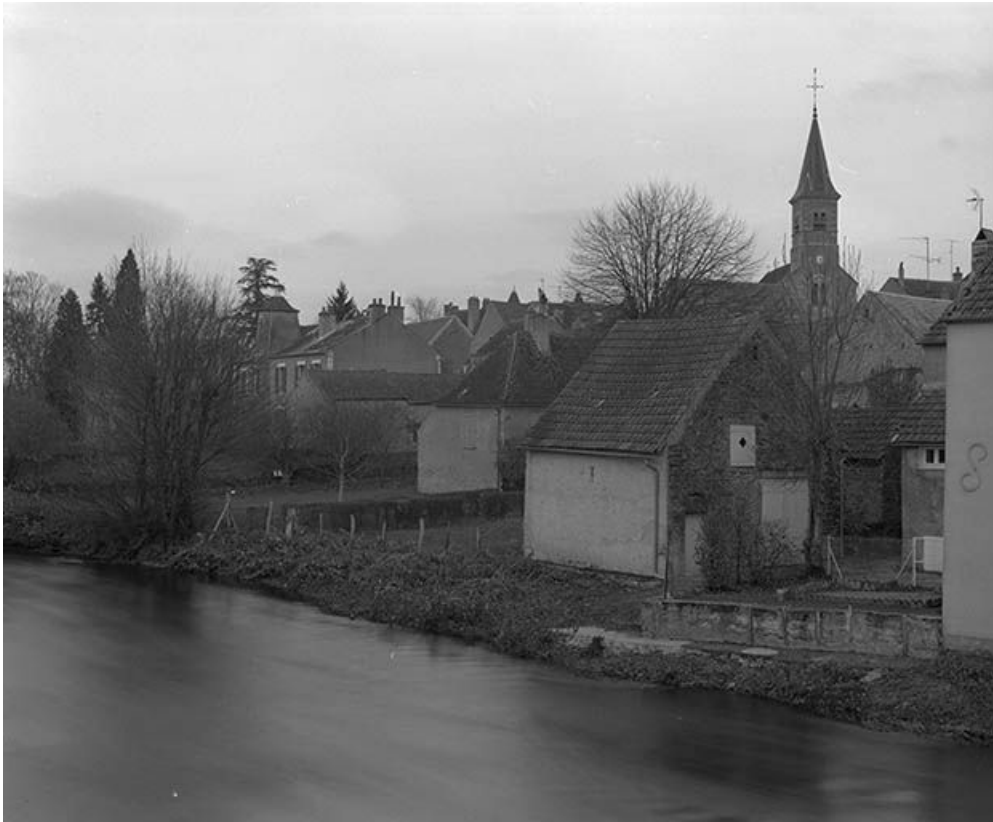
Vue d'ensemble prise depuis le pont sur l'Yonne.