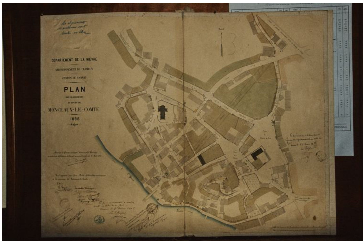
Plan de situation et plan masse, extrait du plan des alignements du bourg de Monceaux-le-Comte, échelle 1/500e, 1896. 58, Monceaux-le-Comte