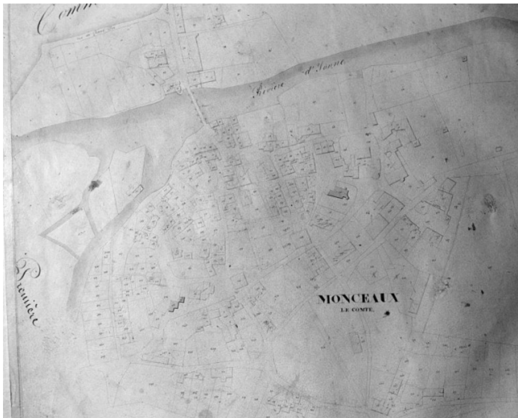
Plan de situation et plan masse, extrait du plan cadastral au 1/1250e, feuille unique, 1835. 58, Monceaux-le-Comte

Plan de situation et plan masse, extrait du plan cadastral au 1/1250e, feuille unique, 1835..