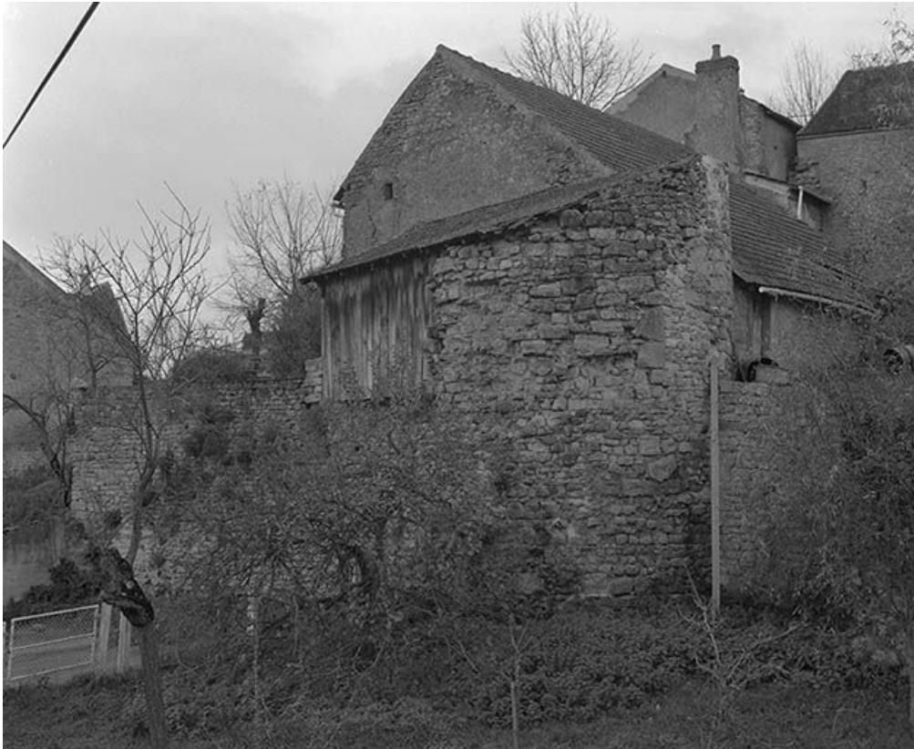
Vestiges de l'enceinte du village : tour de flanquement.