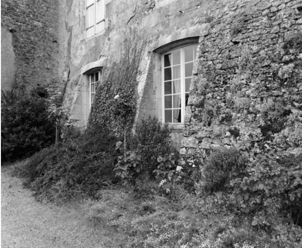
Bâtiment sud-ouest. Elévation antérieure, détail.