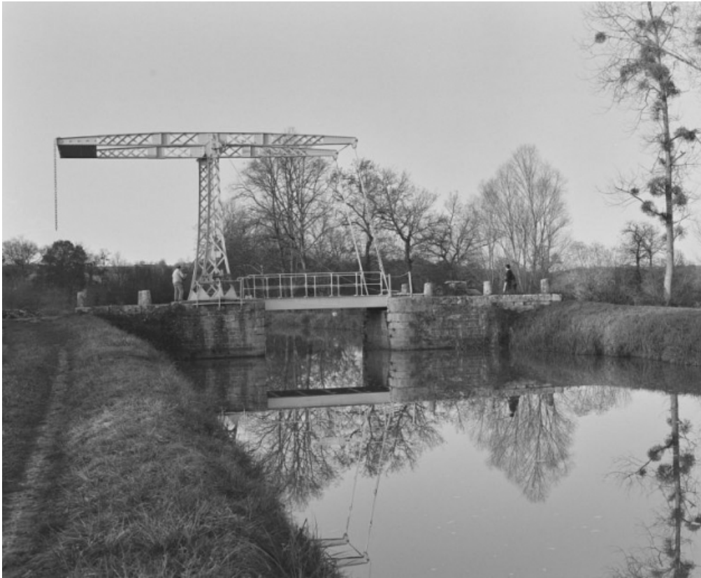
Vue d'ensemble prise du sud.