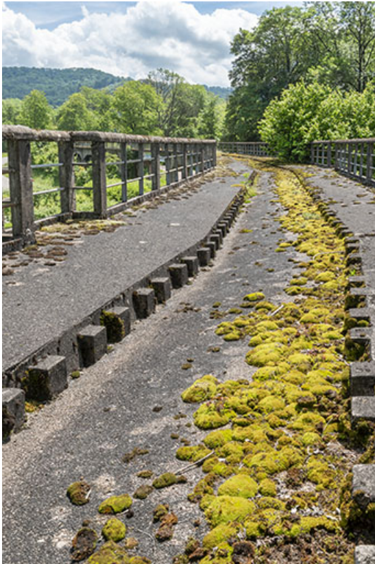
Détail de la chaussée.