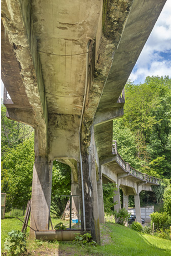
Vue prise sous le pont, depuis la route de Chaux-Champagny. 39, Salins-les-Bains