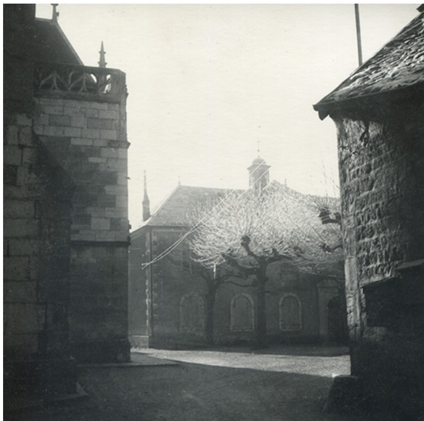
Place Saint-Anatoile et école Saint-Charles, depuis le nord, s.d. [vers 1950].

39, Salins-les-Bains Place Saint-Anatoile