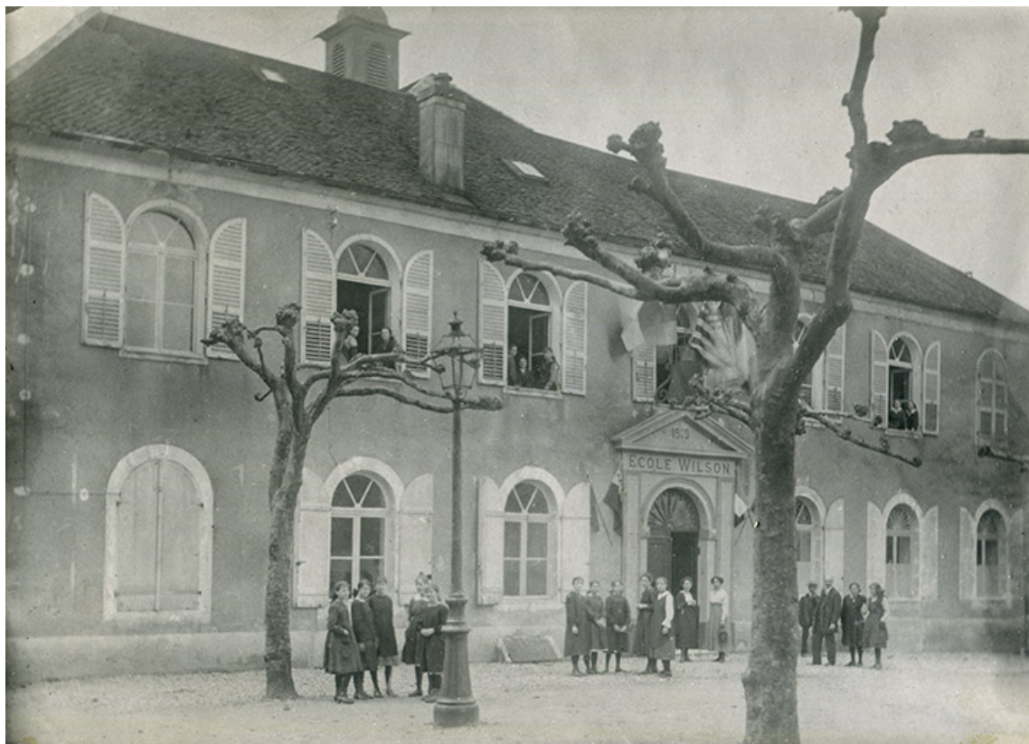
Ecole Wilson, s.d. [vers 1920].

39, Salins-les-Bains Place Saint-Anatoile