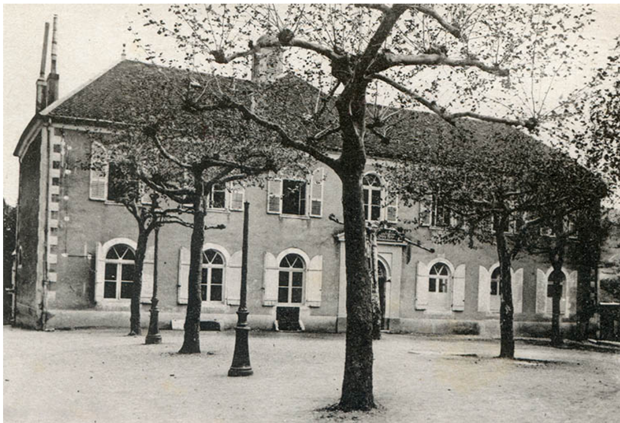
Salins-les-Bains – Ecole supérieure Wilson, s.d. [vers 1920].

39, Salins-les-Bains Place Saint-Anatoile