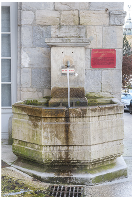
La fontaine vue de face.