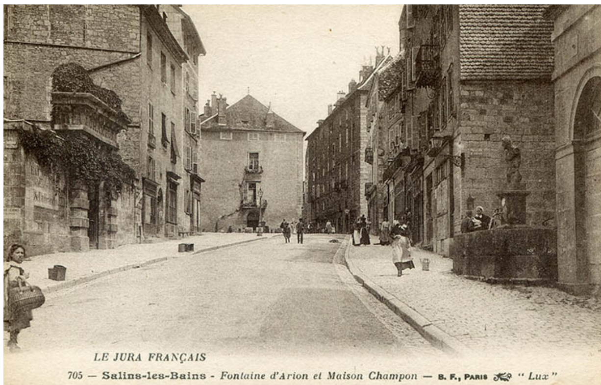
Salins-les-Bains - Fontaine d'Arion et Maison Champon, s.d. [fin 19e ou début 20e siècle].