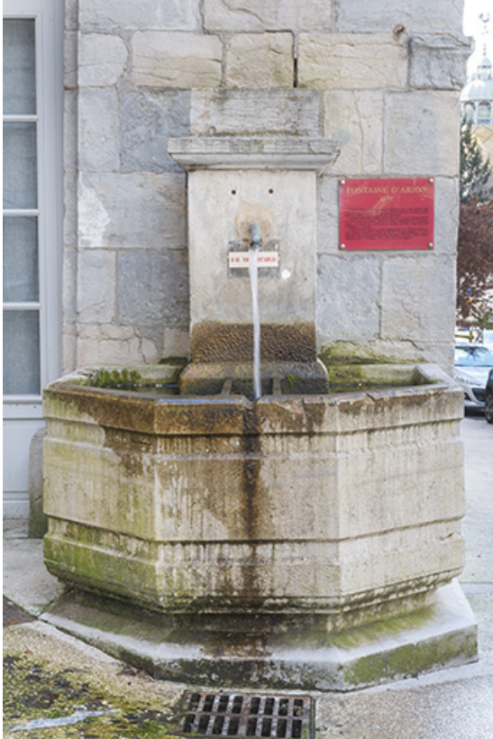
La fontaine vue de face.