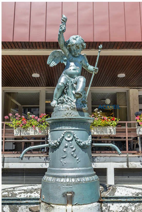
Partie supérieure en fonte.