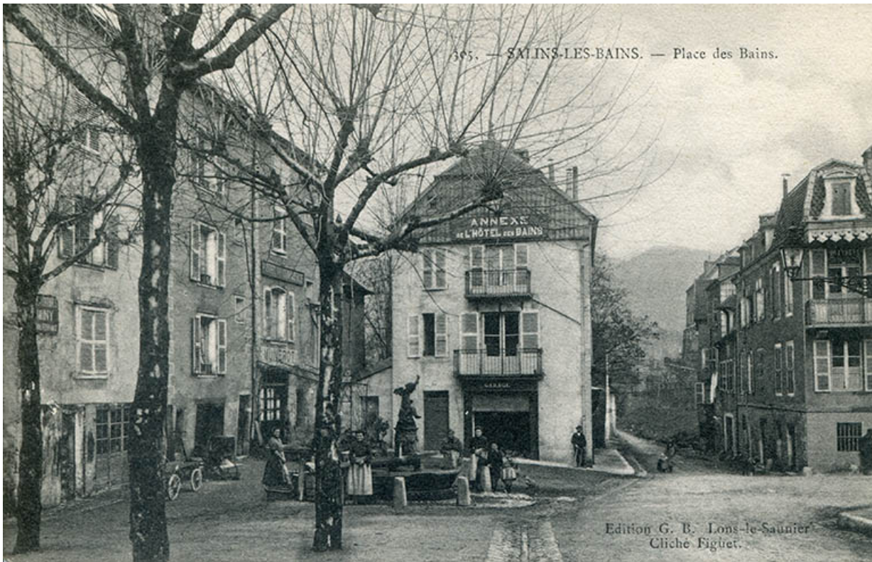
Salins-les-Bains - Place des Bains, s.d. [fin 19e ou début 20e siècle]. 39, Salins-les-Bains Place des Bains