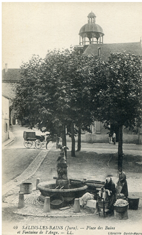
Salins-les-Bains (Jura) - Place des Bains et fontaine de l'Ange, s.d. [fin 19e ou début 20e siècle]. 39, Salins-les-Bains Place des Bains