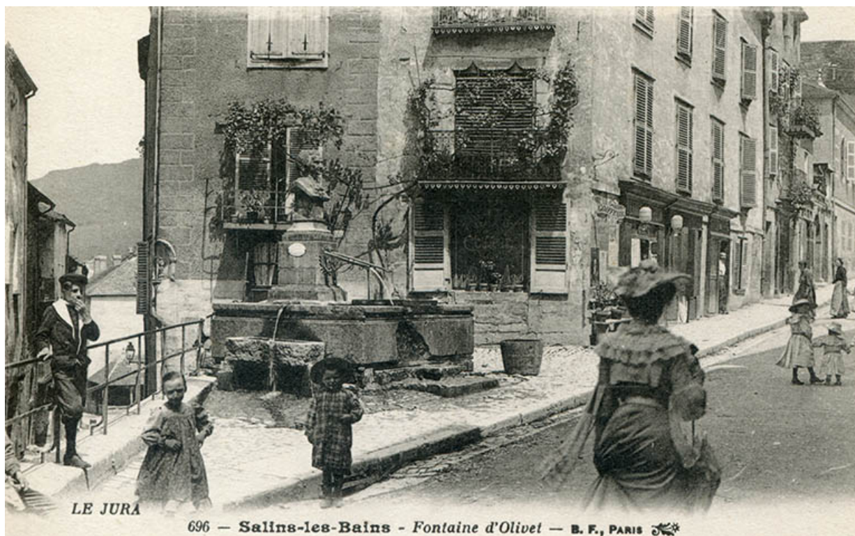
Salins-les-Bains - Fontaine d'Olivet, s.d. [fin 19e ou début 20e siècle].