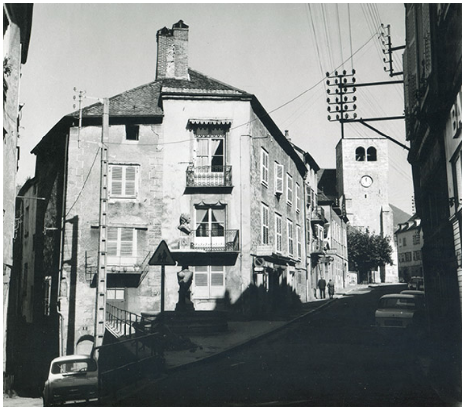
Vue du quartier vers 1960.