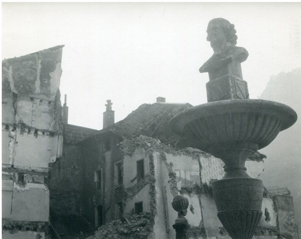
La fontaine au moment de la démolition du quartier d'Olivet, s.d. [vers 1975].