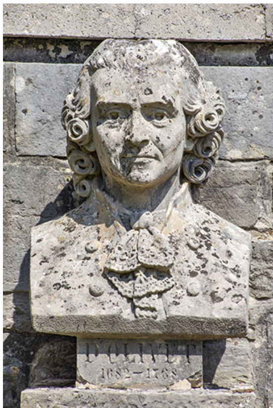
Buste de l'abbé d'Olivet. Vue de face.