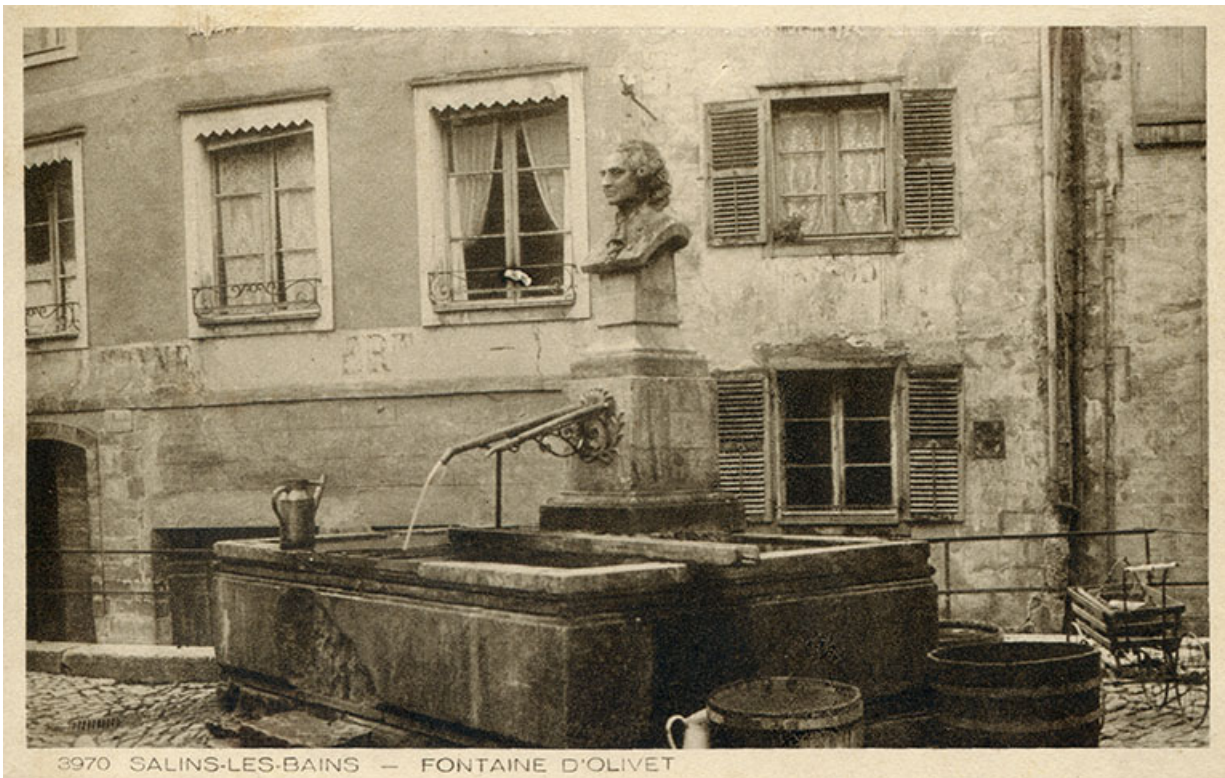
Salins-les-Bains - Fontaine d'Olivet, s.d. [début 20e siècle].