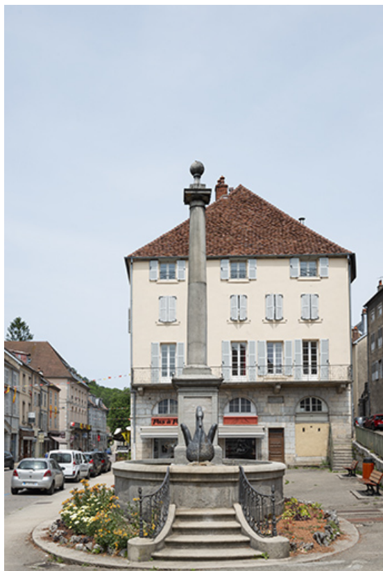
Vue axiale, depuis le sud.