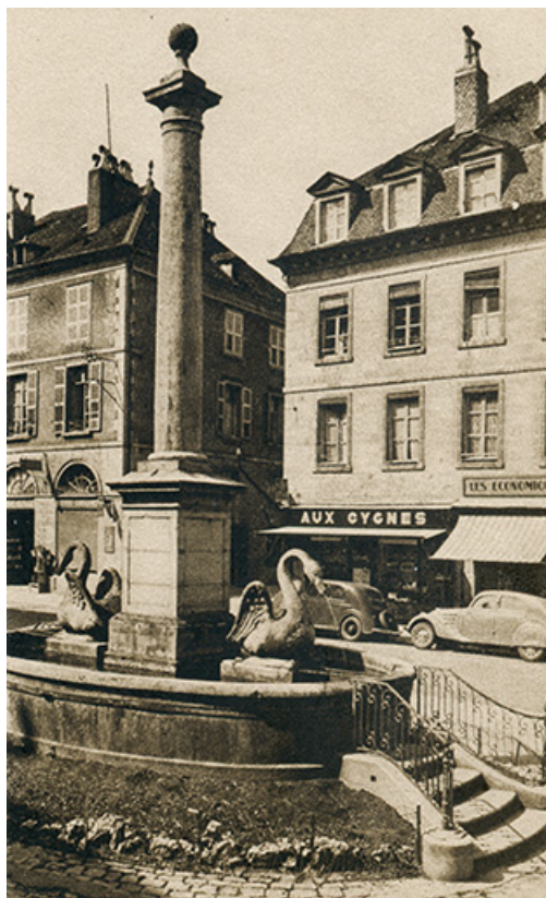
Salins-les-Bains - Fontaine des Cygnes, s.d. [vers 1930]. 39, Salins-les-Bains place Max Buchon