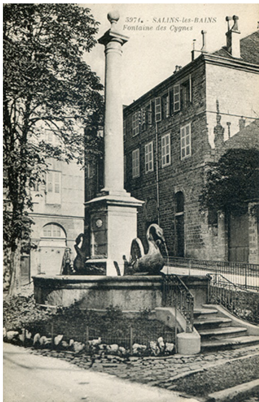
Salins-les-Bains - Fontaine des Cygnes, s.d. [fin 19e ou début 20e siècle]. 39, Salins-les-Bains place Max Buchon