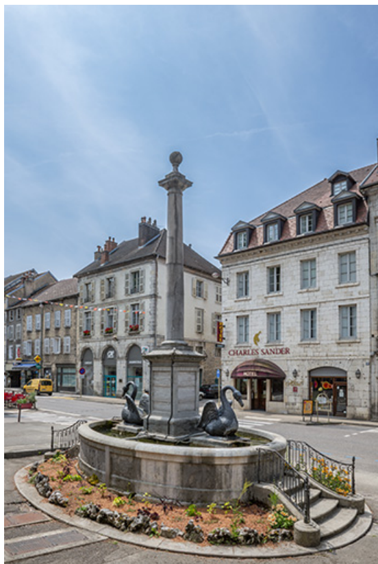
Vue d'ensemble depuis la rue d'Orgemont.