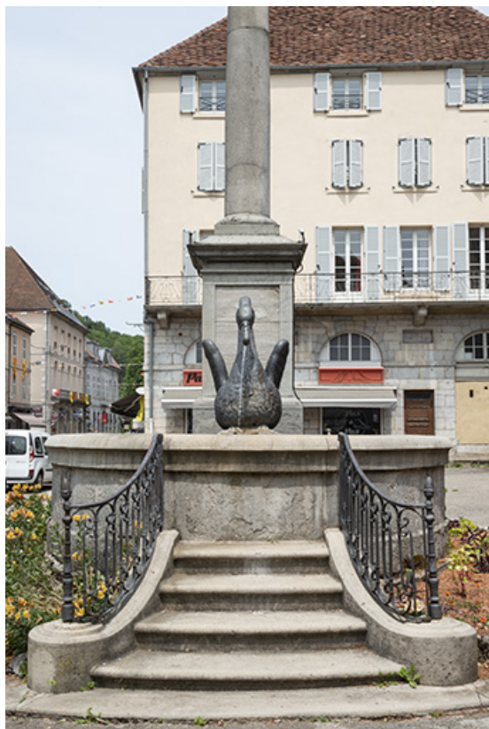
Vue rapprochée depuis le sud.