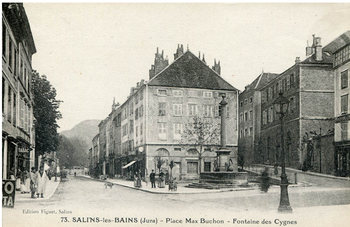
Salins-les-Bains (Jura) - Place Max Buchon - Fontaine des Cygnes, s.d. [fin 19e ou début 20e siècle]. 39, Salins-les-Bains place Max Buchon