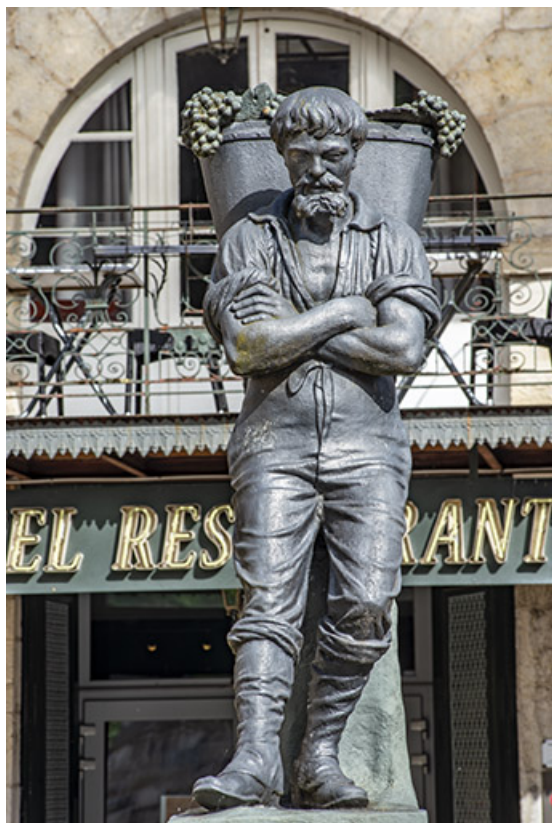
Statue, vue de face.