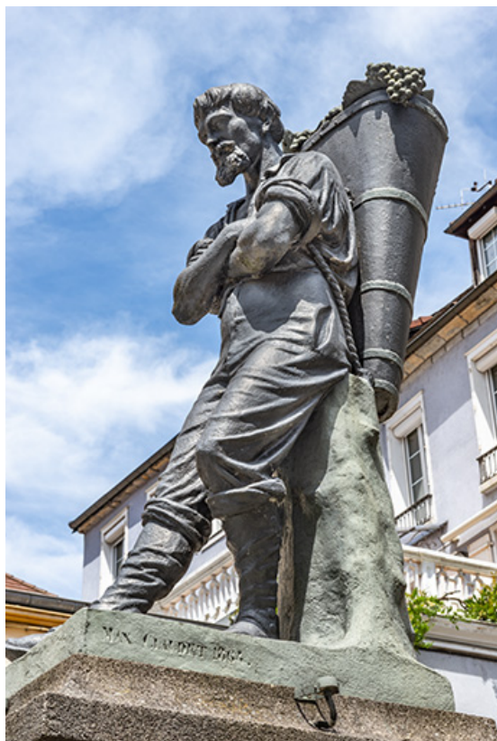
Statue, vue de trois quarts.