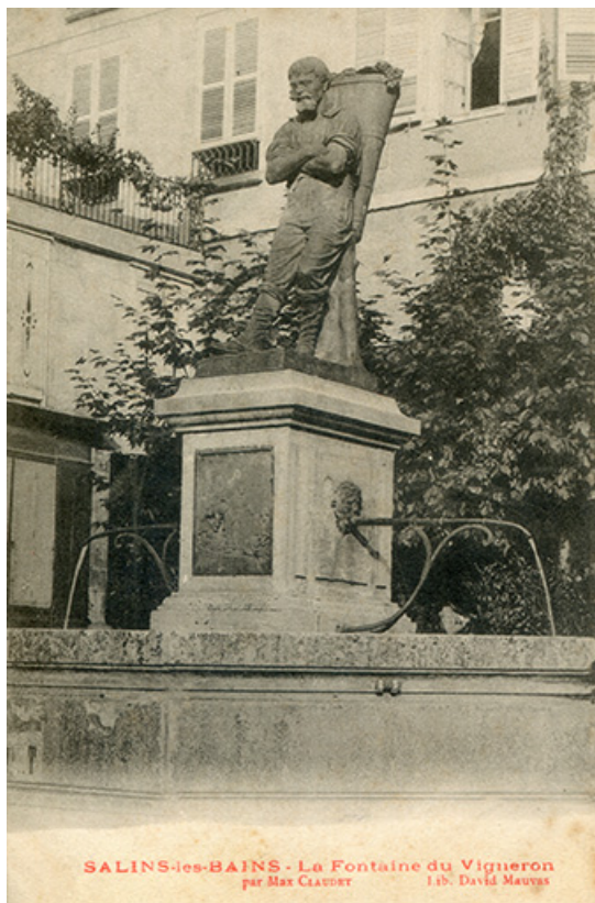
Salins-les-Bains - La fontaine du Vigneron, par Max Claudet, s.d. [fin 19e ou début 20e siècle]. 39, Salins-les-Bains place du Vigneron