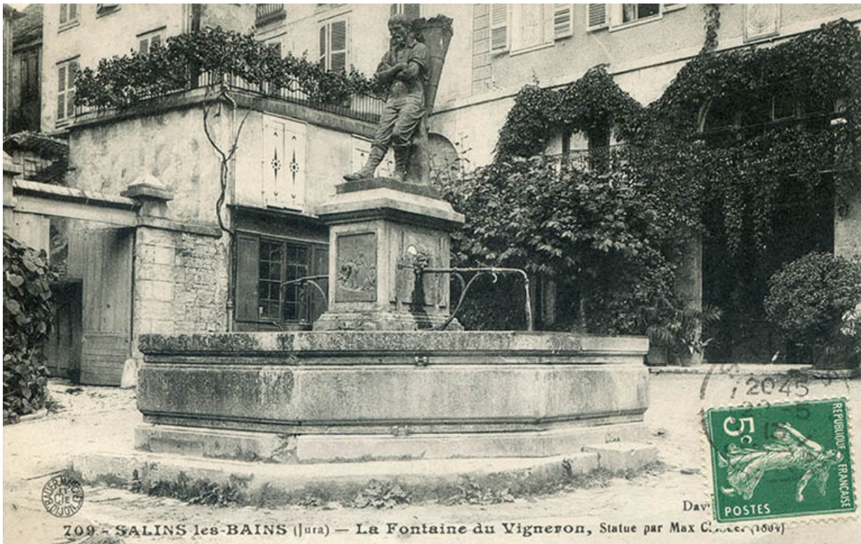
Salins-les-Bains (Jura) - La fontaine du Vigneron, par Max Claudet, s.d. [fin 19e ou début 20e siècle]. 39, Salins-les-Bains place du Vigneron