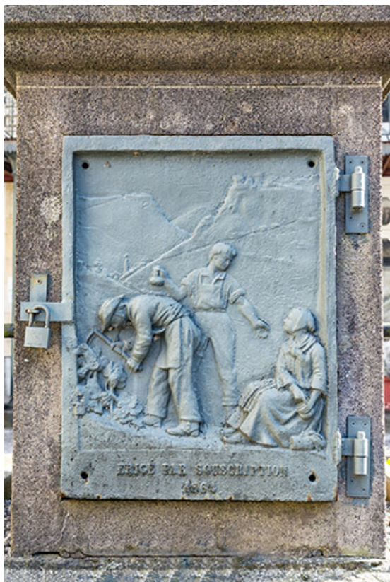
Plaque de fonte, avec décor en bas-relief, côté sud. 39, Salins-les-Bains place du Vigneron