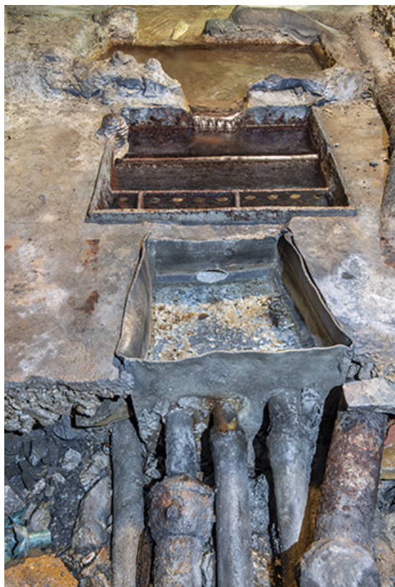
Bassins de division en maçonnerie, fer et plomb.

39, Salins-les-Bains rue Victor Considerant