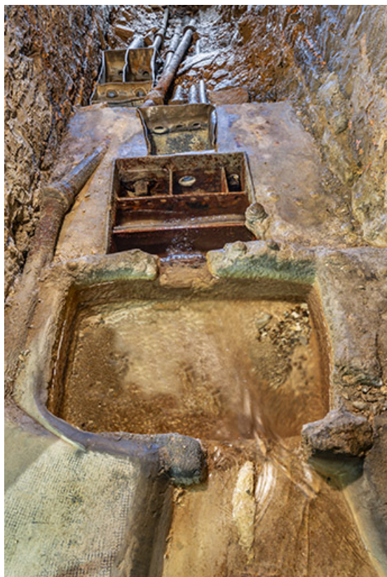
Bassins de division. Vue depuis l'amont.

39, Salins-les-Bains rue Victor Considerant