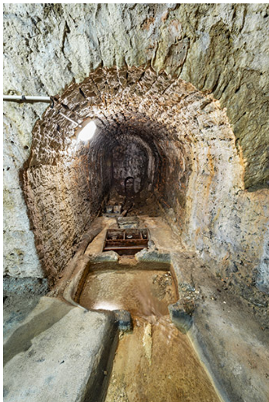
Galerie maçonnée renfermant les bassins de division. Vue depuis l'amont.

39, Salins-les-Bains rue Victor Considerant