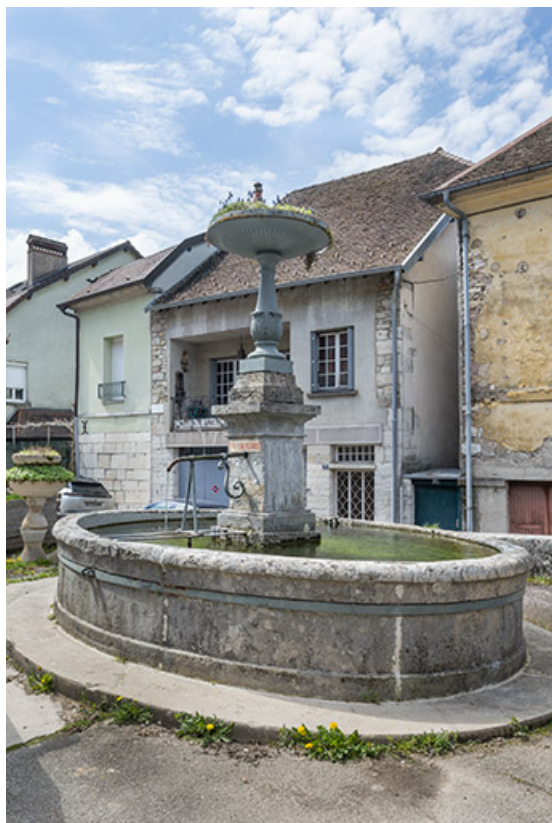
Vue de trois quarts, depuis la rue d'Orgemont.

39, Salins-les-Bains rue Victor Considerant