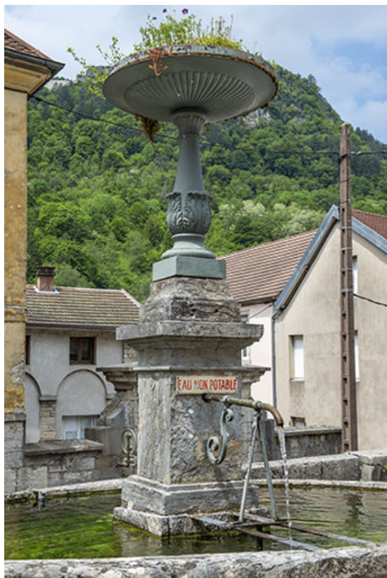
Vue rapprochée. Détail du massif central.

39, Salins-les-Bains rue Victor Considerant