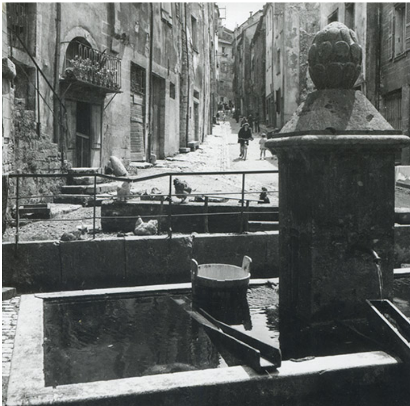
La rue d'Olivet et la fontaine au premier plan, s.d. [années 1960 ?]. 39, Salins-les-Bains rue d' Olivet