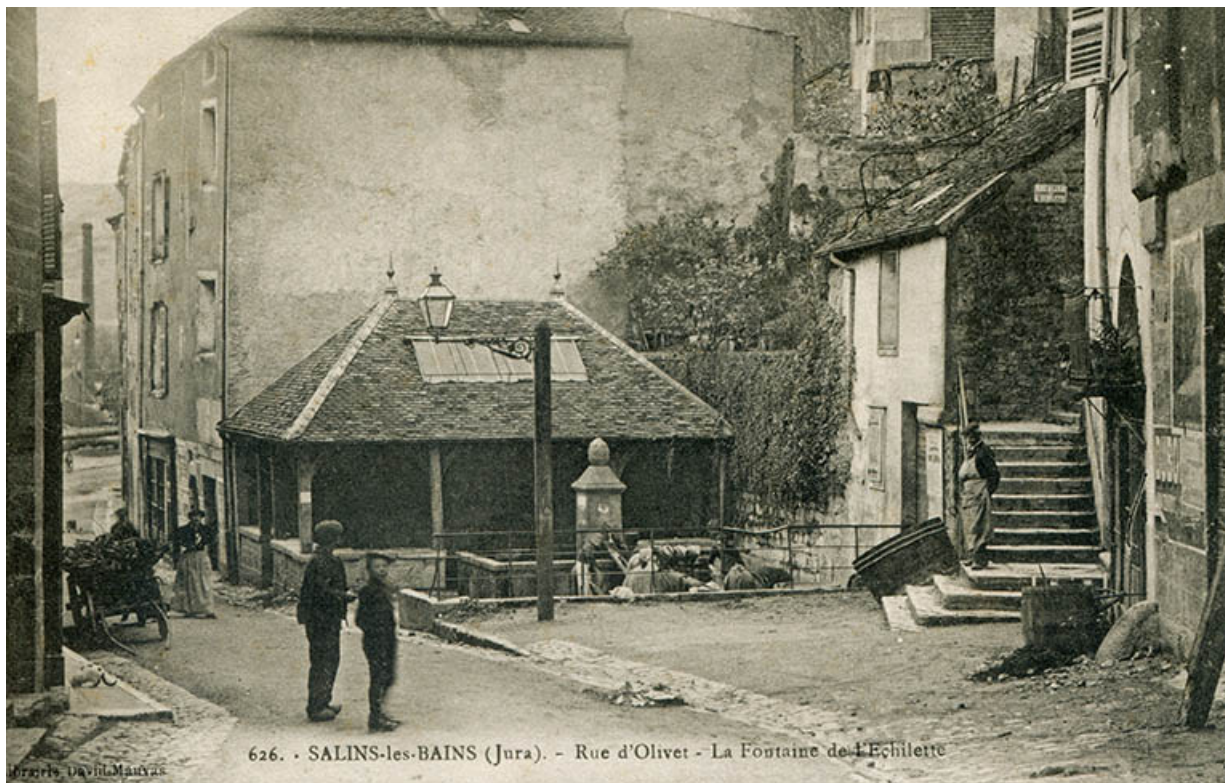
Salins-les-Bains (Jura) - Rue d'Olivet - La fontaine de l'Echilette, s.d. [fin 19e ou début 20e siècle].