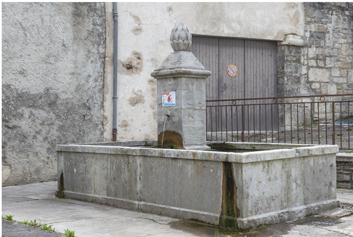
Vue depuis le nord-ouest.