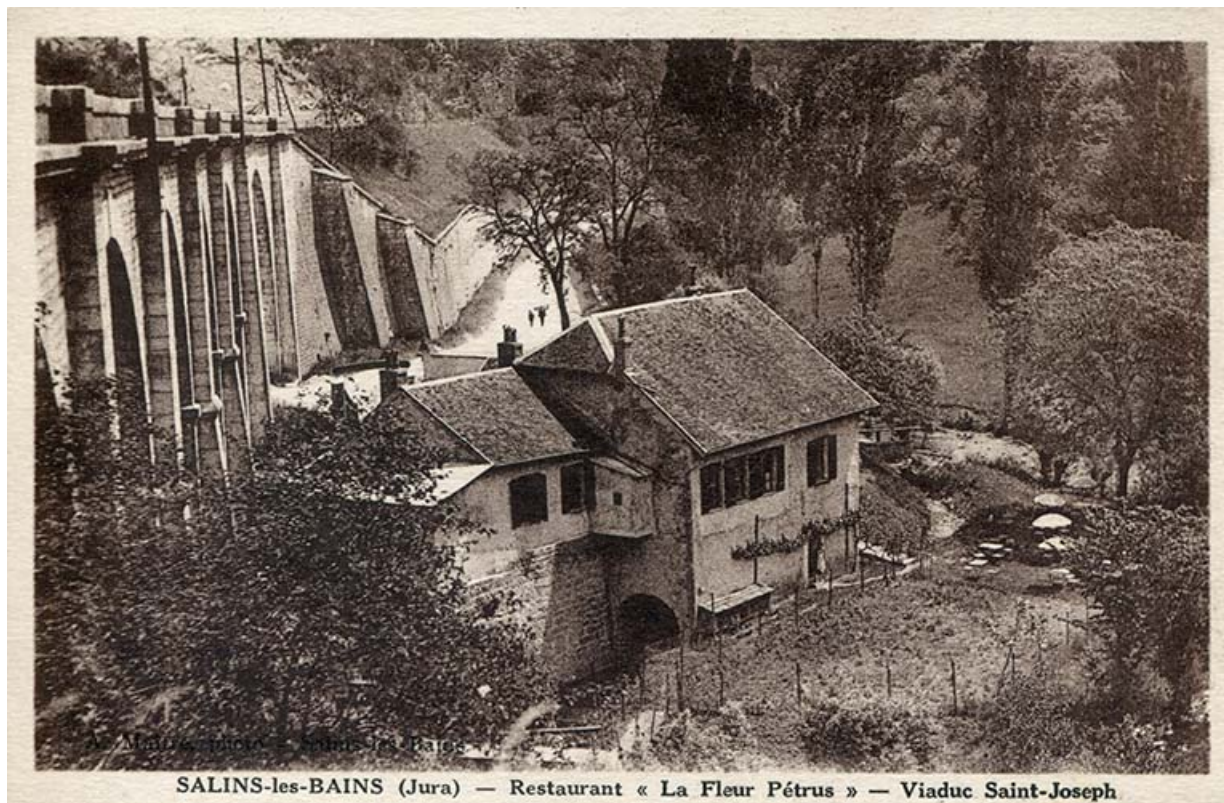
SALINS-les-BAINS (Jura) — Restaurant « La Fleur Pétrus » — Viaduc Saint-Joseph

Salins-les-Bains - Viaduc de Saint-Joseph, s.d. [début 20e siècle].