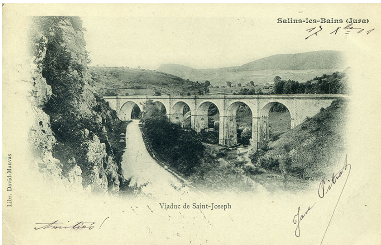
Salins-les-Bains (Jura) - Viaduc de Saint-Joseph, s.d. [fin 19e siècle].

39, Salins-les-Bains, lieudit : Saint-Joseph