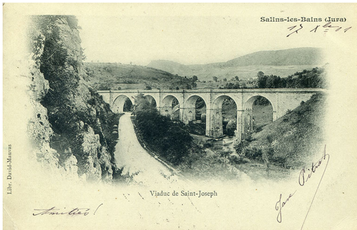
Salins-les-Bains (Jura) - Viaduc de Saint-Joseph, s.d. [fin 19e siècle].

39, Salins-les-Bains, lieudit : Saint-Joseph