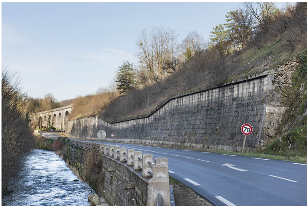
Viaduc et mur de soutènement, depuis l'est.

39, Salins-les-Bains, lieudit : Saint-Joseph