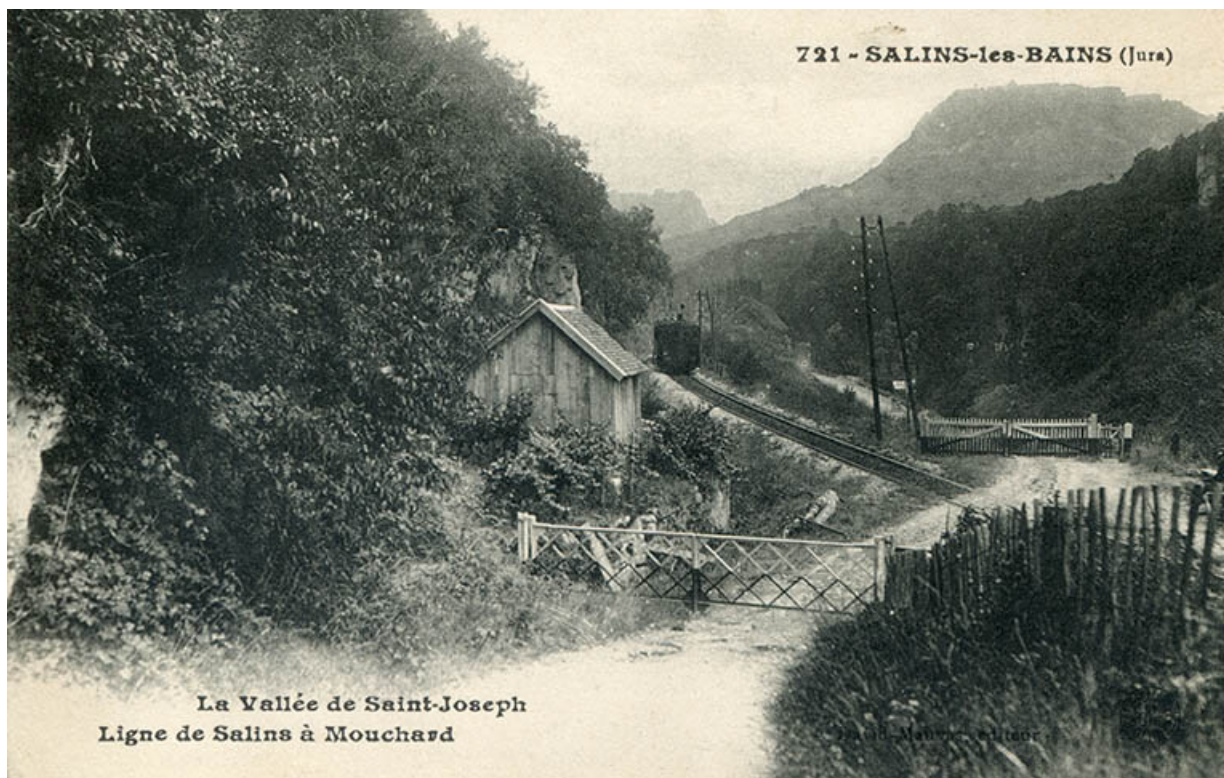
Salins-les-Bains (Jura) – La vallée de Saint-Joseph - Ligne de Salins à Mouchard, s.d. [fin 19e ou début 20e siècle]. 39, Salins-les-Bains