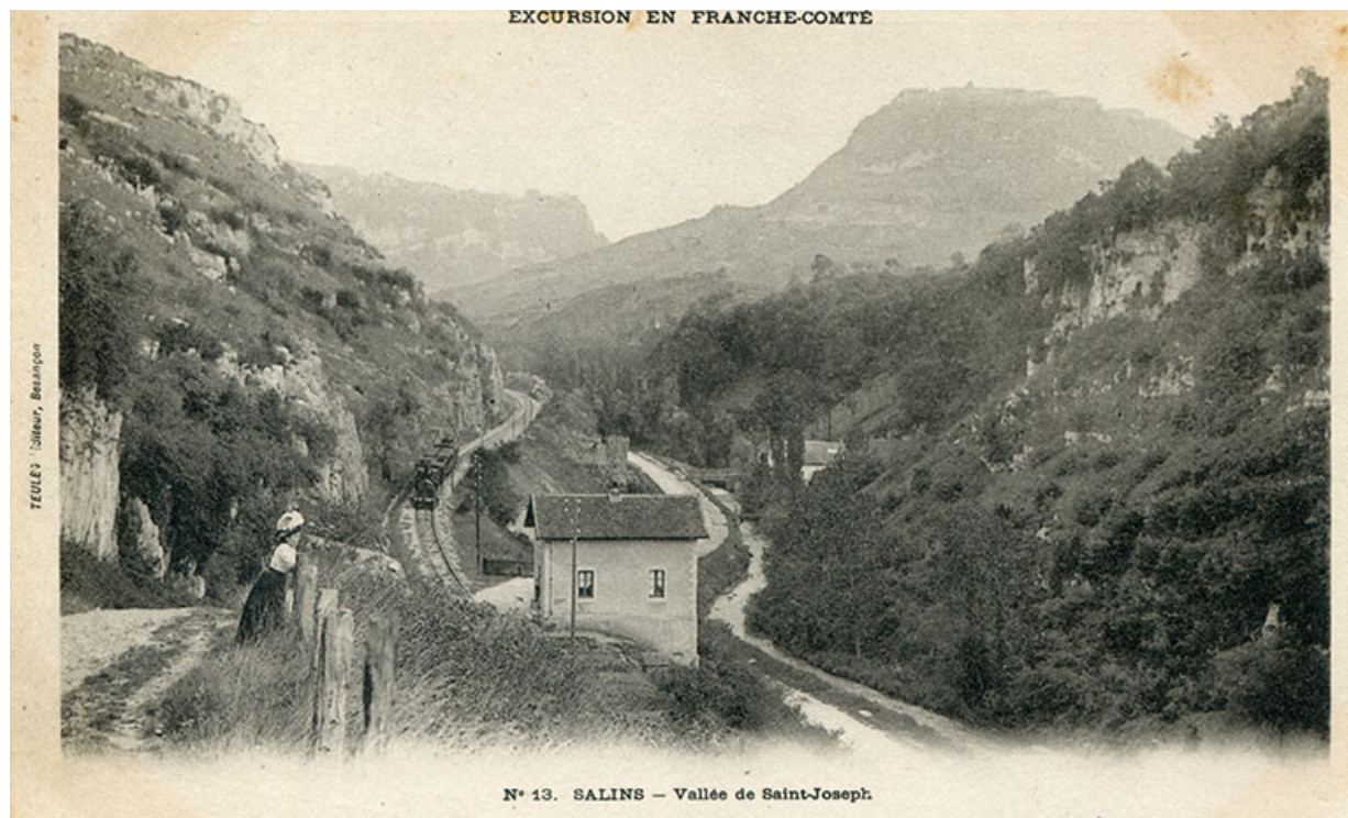
Salins – Vallée de Saint-Joseph, s.d. [fin 19e ou début 20e siècle].