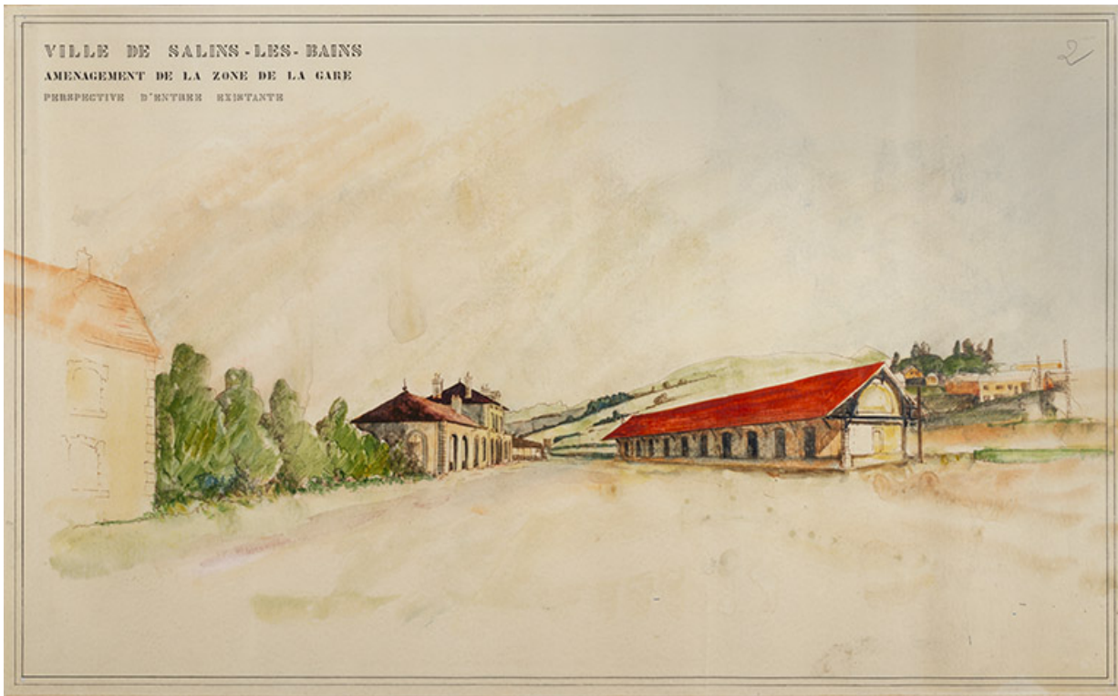
Aménagement de la zone de la gare. Perspective d'entrée existante, dessin, s.d. [vers 1970]. 39, Salins-les-Bains