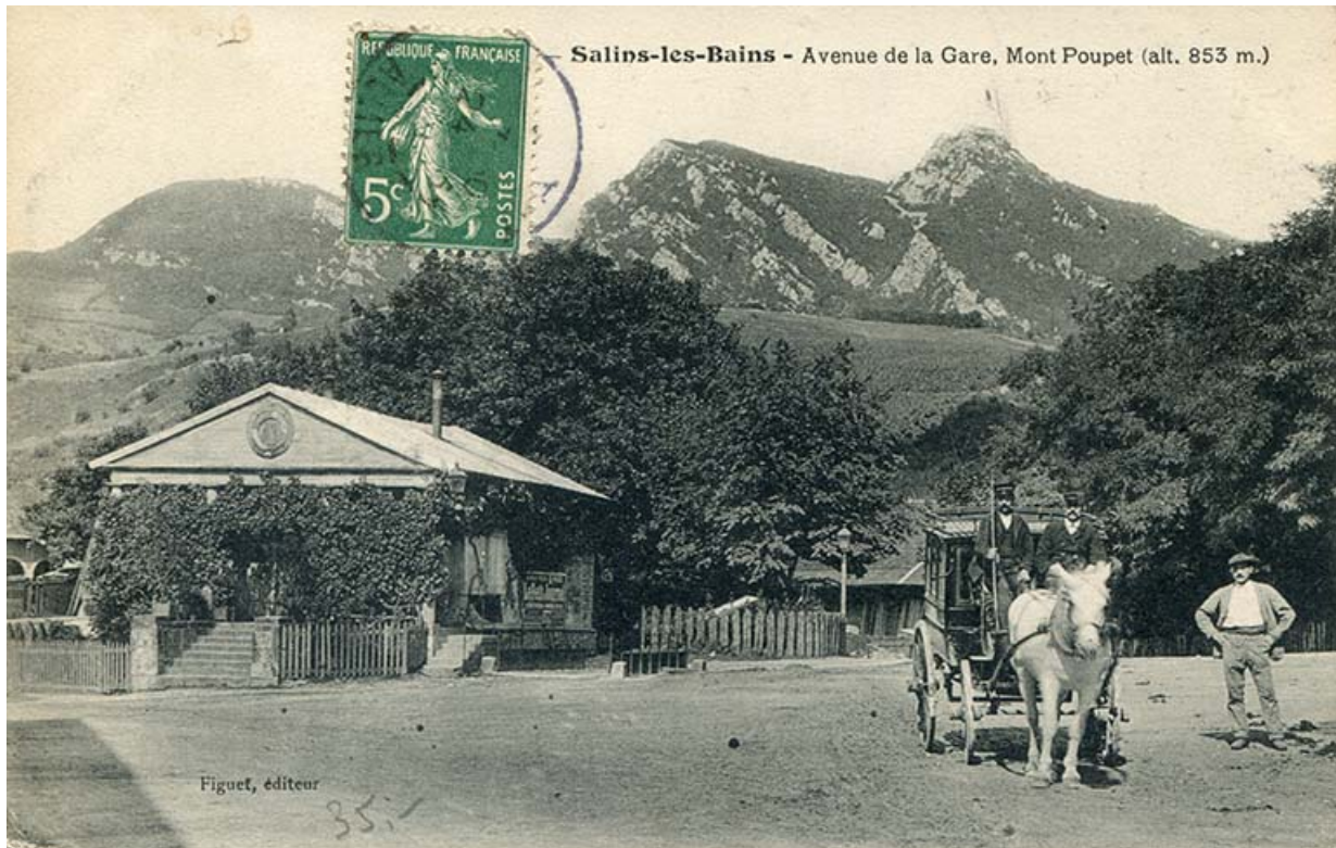
Salins-les-Bains - Avenue de la gare, Mont Poupet, s.d. [fin 19e ou début 20e siècle].

39, Salins-les-Bains place du Souvenir français