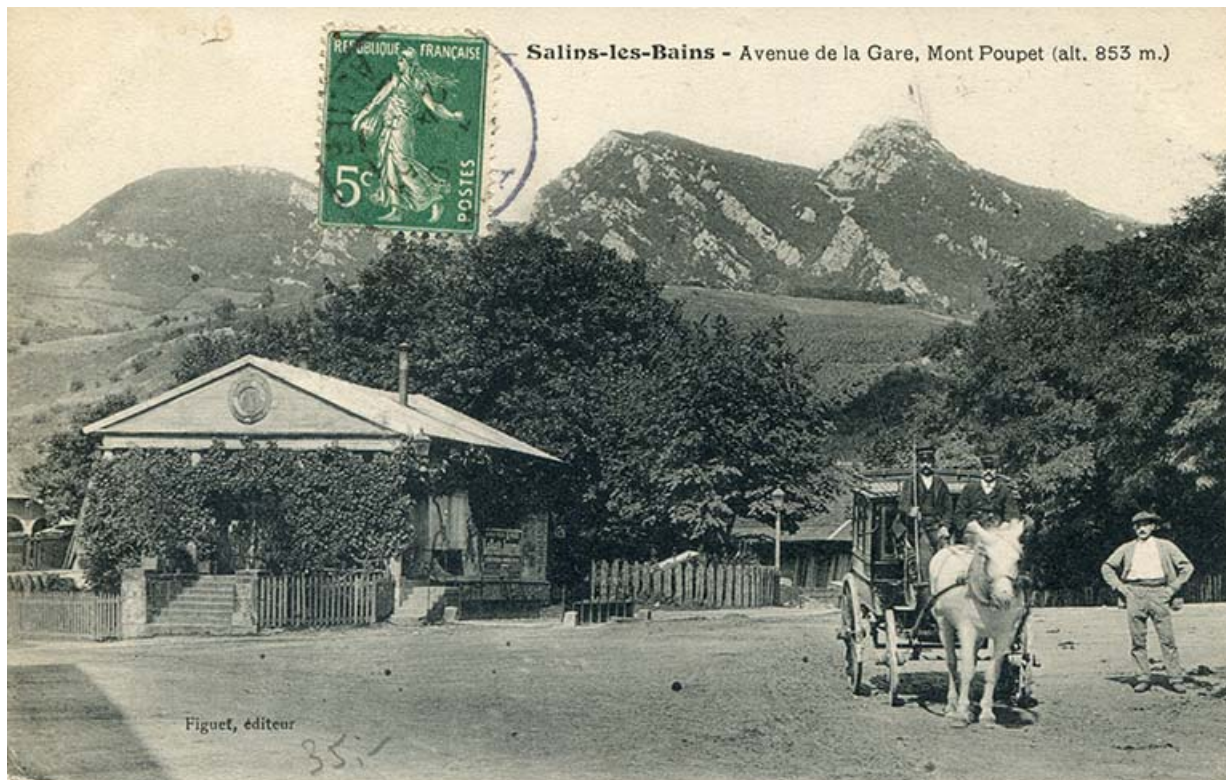
Salins-les-Bains - Avenue de la gare, Mont Poupet, s.d. [fin 19e ou début 20e siècle].

39, Salins-les-Bains place du Souvenir français