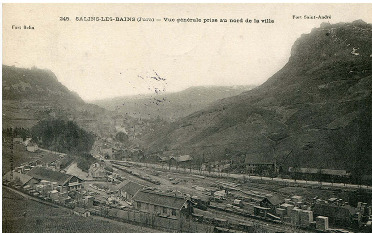
Salins-les-Bains (Jura) – Vue générale prise au nord de la ville, s.d. [fin 19e ou début 20e siècle]. 39, Salins-les-Bains