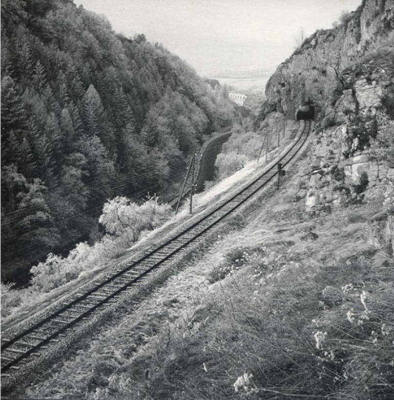
Vue perspective sur la voie ferrée, s.d. [3e quart 20e siècle].

39, Salins-les-Bains, lieudit : Saint-Joseph