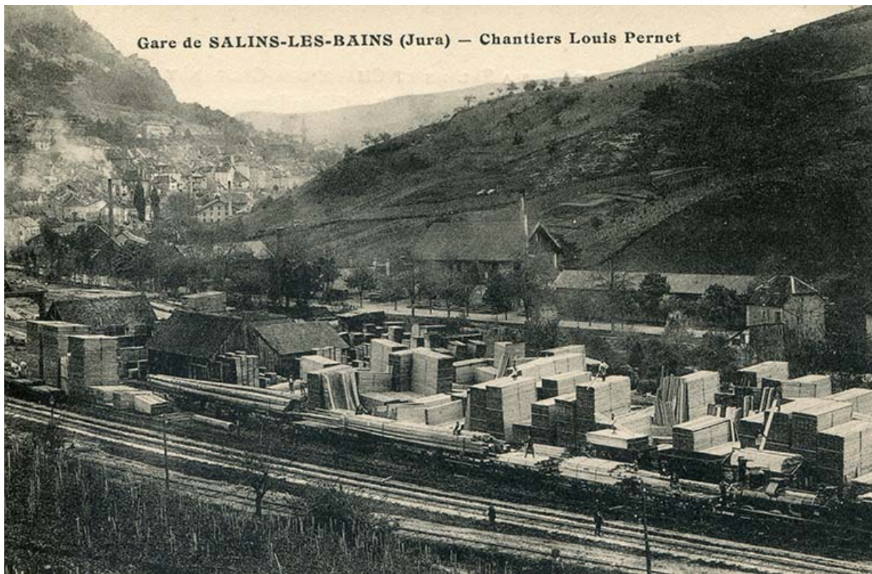
Gare de Salins-les-Bains - Chantiers Louis Pernet, s.d. [fin 19e ou début 20e siècle]. 39, Salins-les-Bains