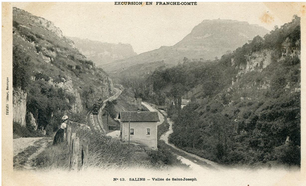
Salins – Vallée de Saint-Joseph, s.d. [fin 19e ou début 20e siècle]. 39, Salins-les-Bains