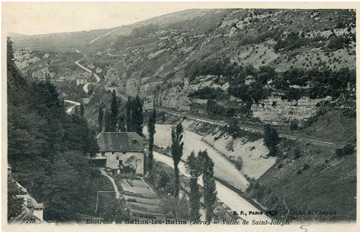
Environs de Salins-les-Bains (Jura) – Vallée de Saint-Joseph, s.d. [fin 19e ou début 20e siècle]. 39, Salins-les-Bains