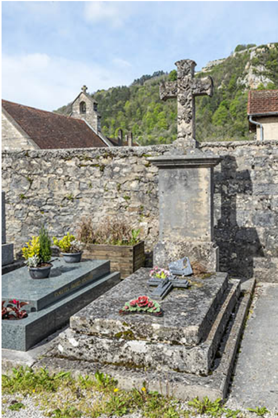
Tombe de Charles Rouget.

39, Salins-les-Bains, chemin des Côteaux