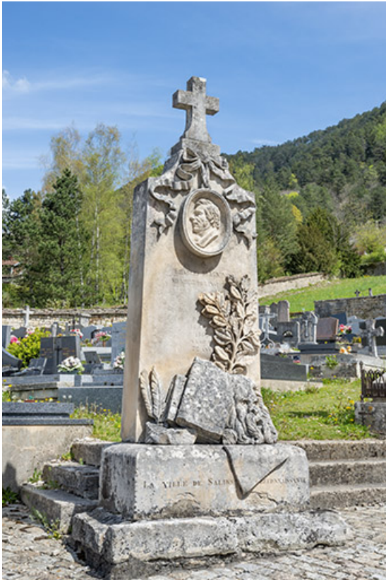
Tombe de Charles Magnin.

39, Salins-les-Bains, chemin des Côteaux