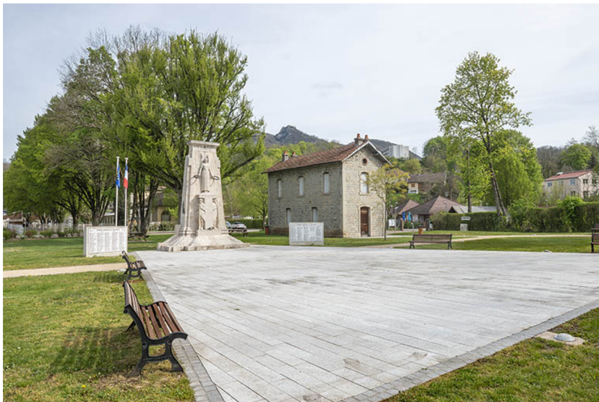
Vue de situation, depuis le sud de la place du Souvenir français.

39, Salins-les-Bains, place du Souvenir français