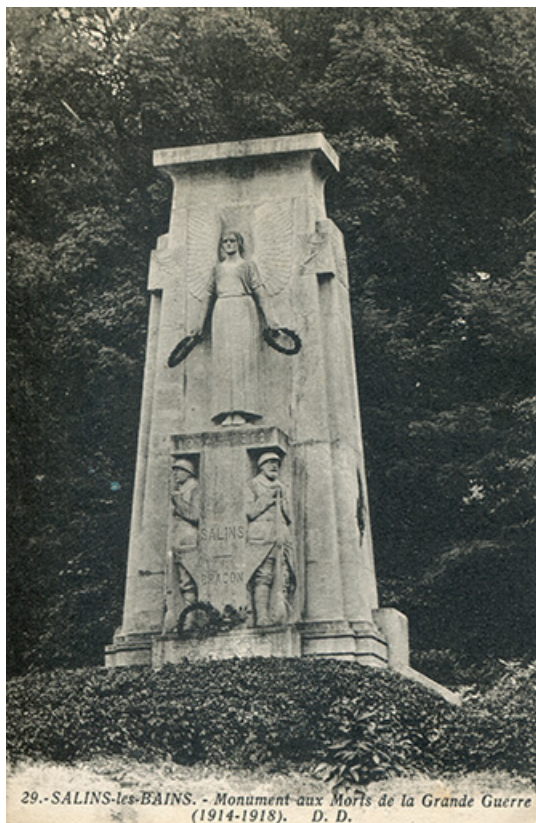
Salins-les-Bains (Jura) - Monument aux Morts de la Grande Guerre (1914-1918), s.d. [vers 1925].

39, Salins-les-Bains, place du Souvenir français