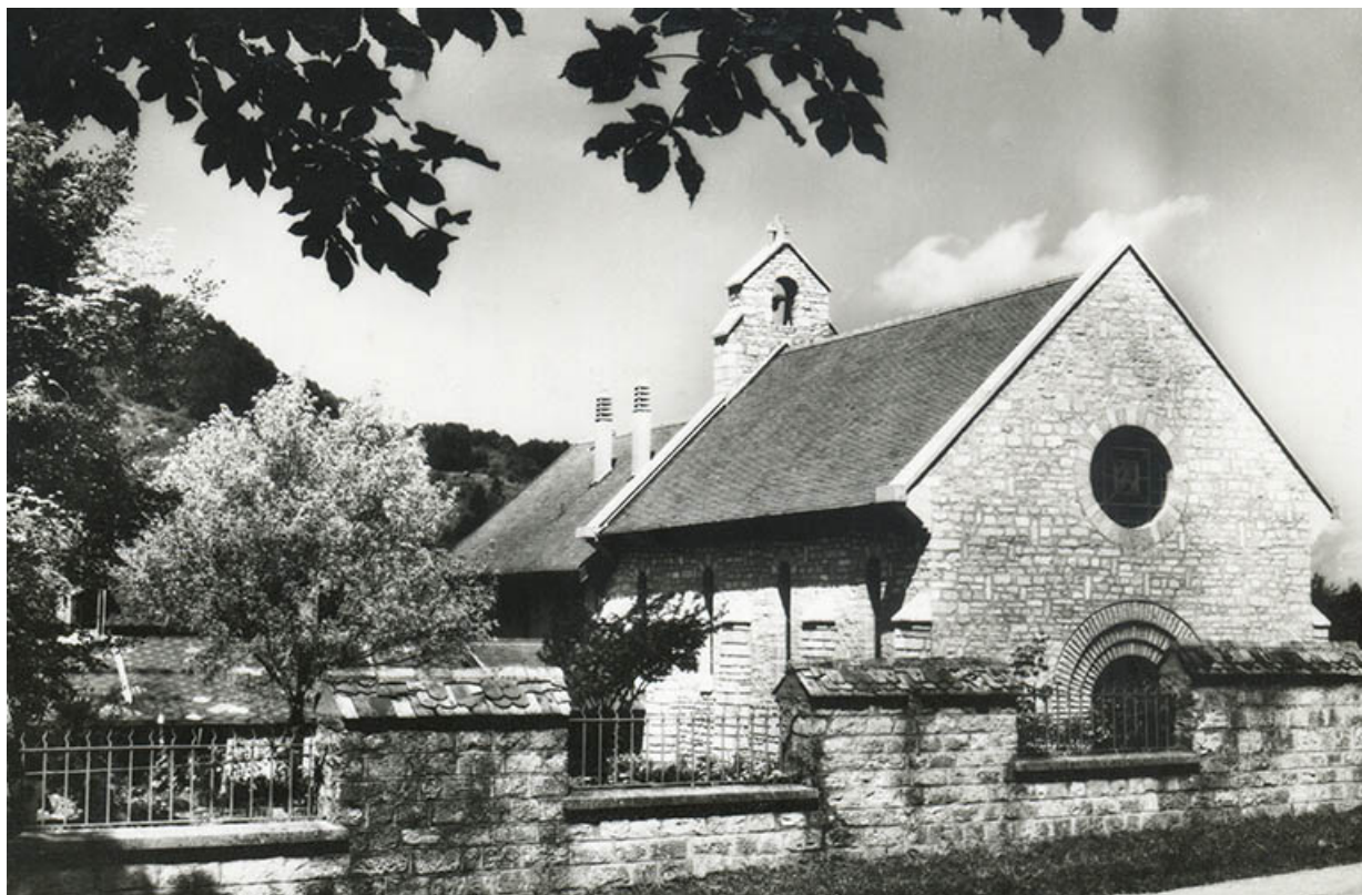
Salins-les-Bains (Jura) - Le Rayon de Soleil, s.d. [vers 1960].