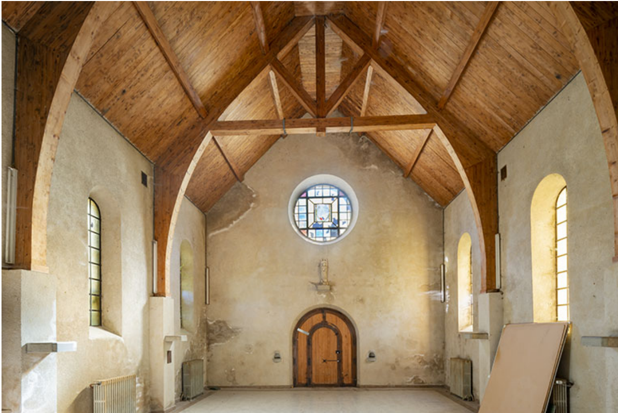
Vue intérieure, depuis l'ouest.