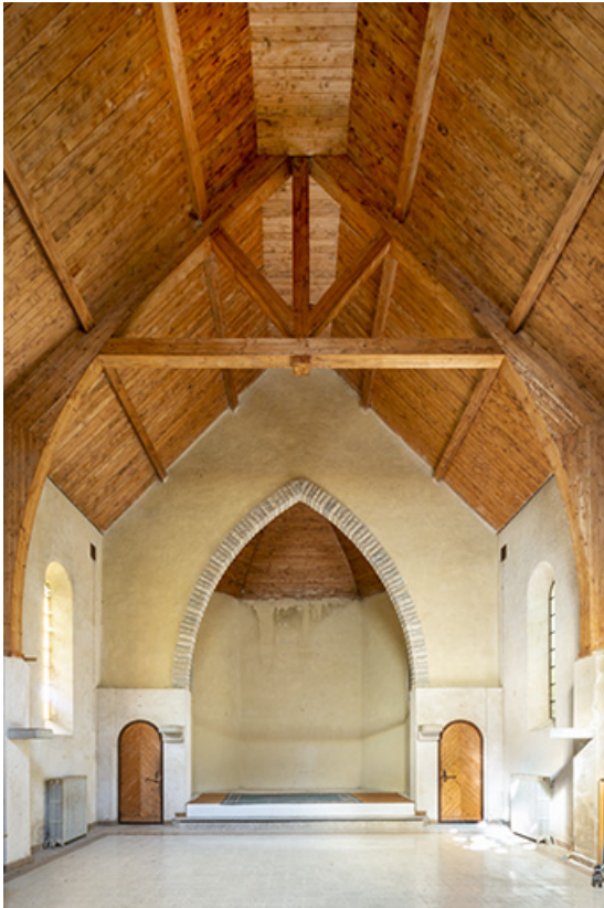
Vue intérieure, depuis l'est.