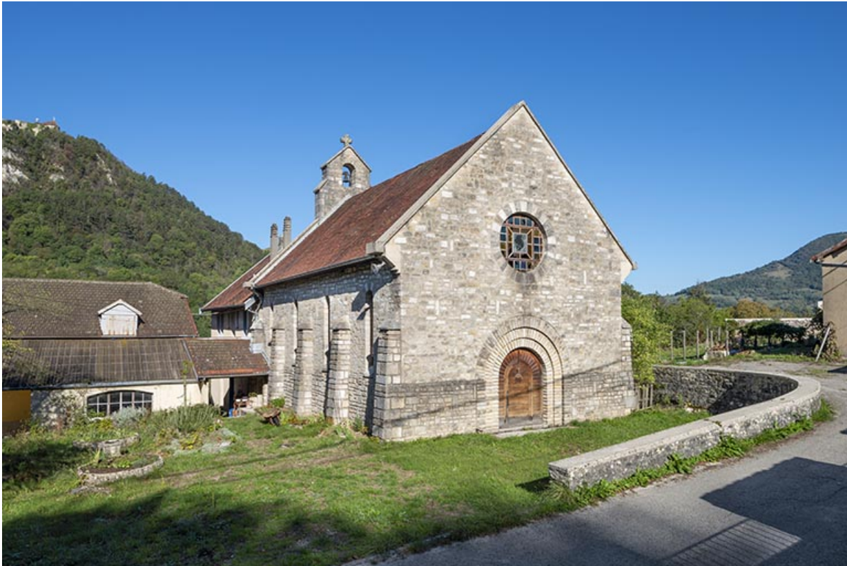
Vue de trois quarts gauche.