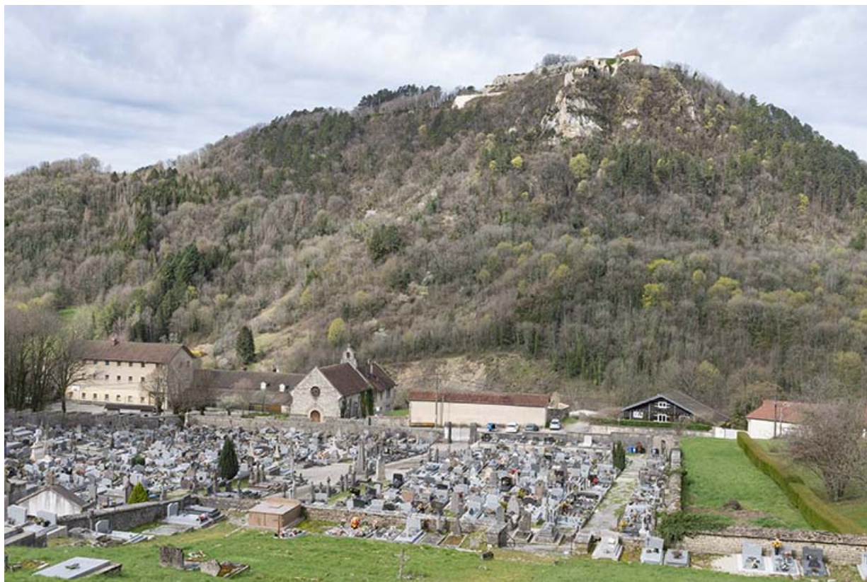
Vue d'ensemble plongeante depuis l'est.