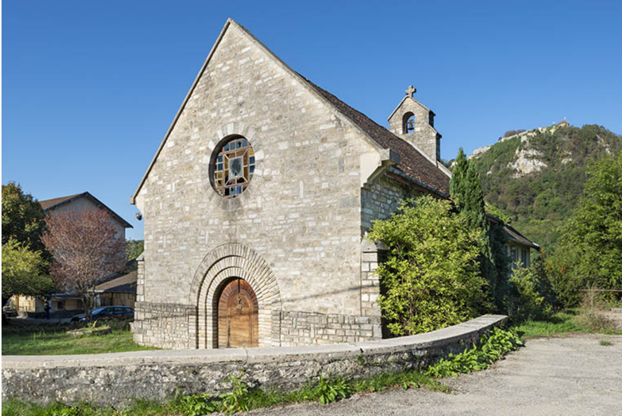
Vue d'ensemble, depuis le nord-est.