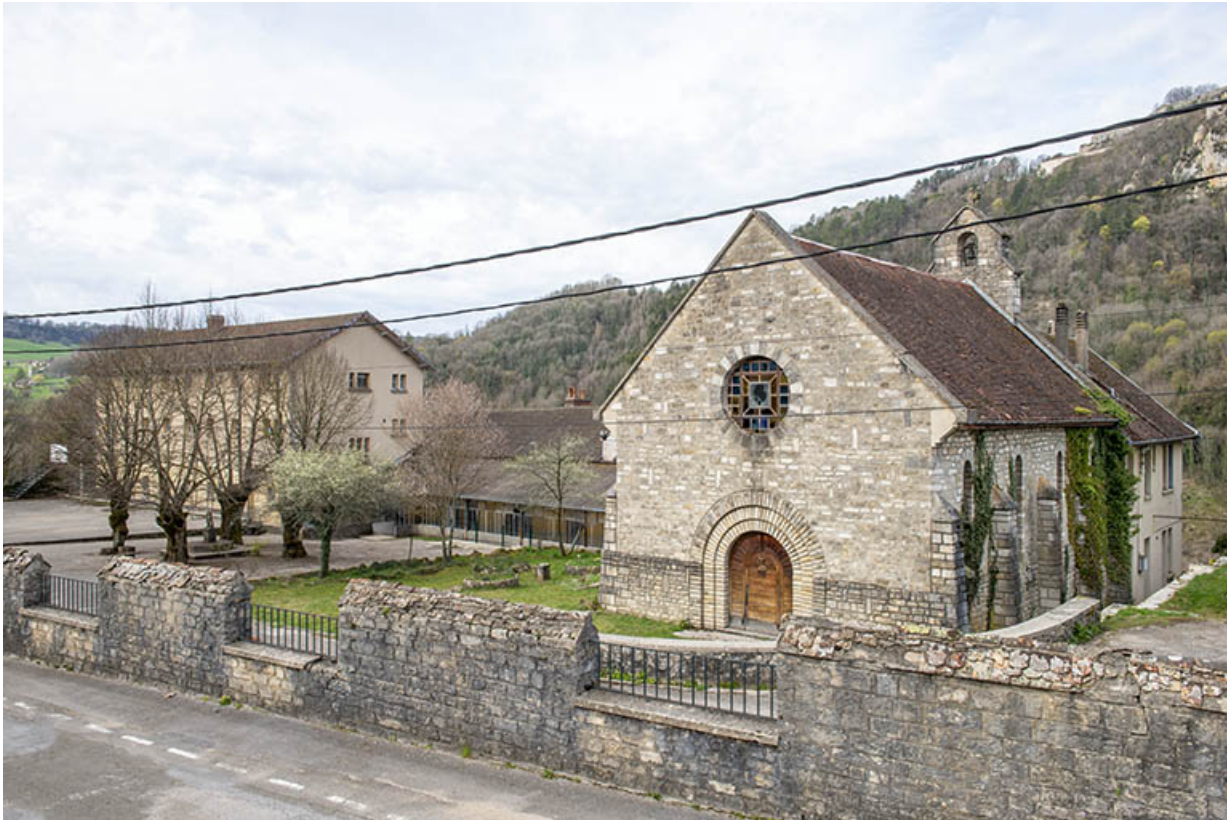
Vue de trois quarts depuis le nord-est.