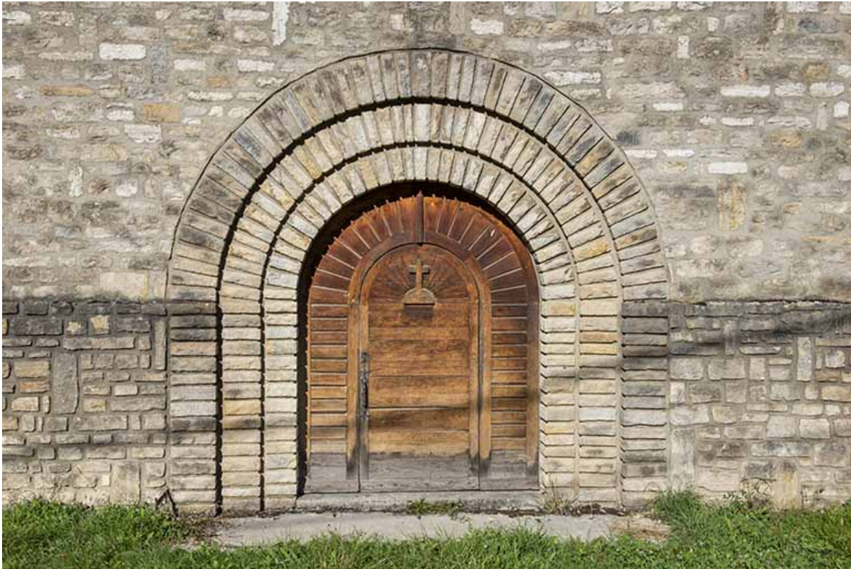
Porte du mur-pignon est.