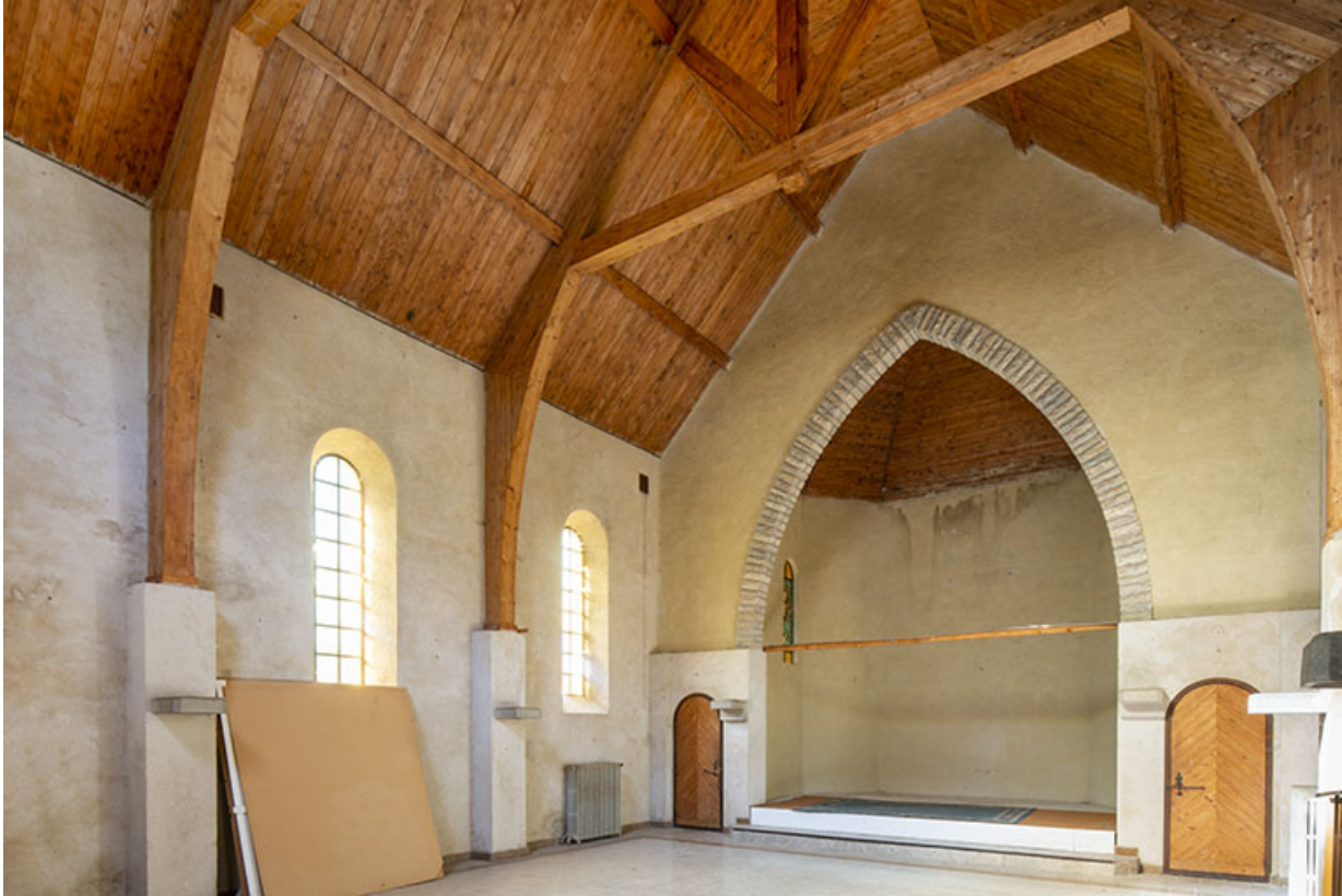
Vue intérieure de trois quarts.