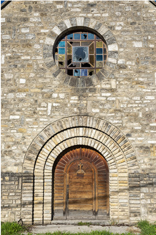
Baies du mur-pignon est.