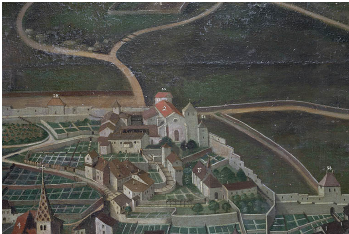
Tableau de Nicolas Richard (1628). Rempart est : tour Terrestre (54) et Dorée (53). 39, Salins-les-Bains chemin des Coteaux