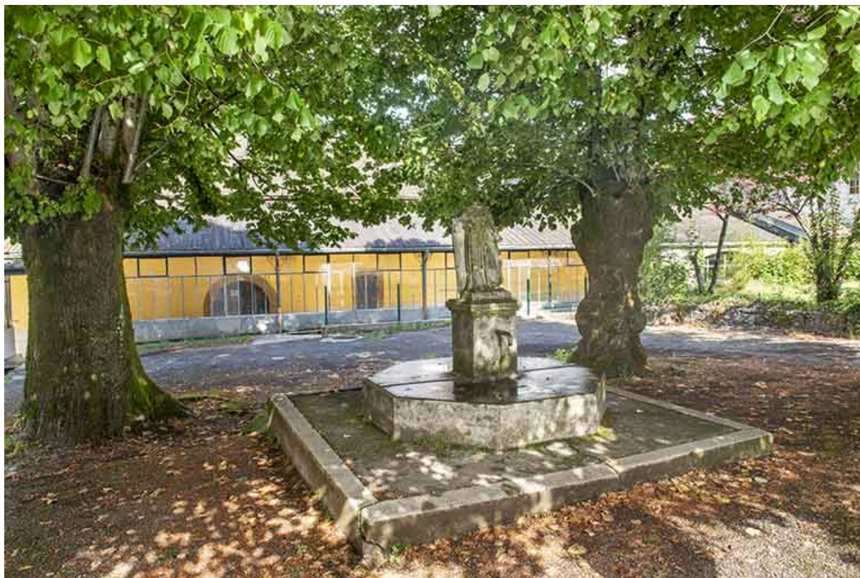
Statue placée à l'aplomb du puits, situé au centre de l'ancien cloître.