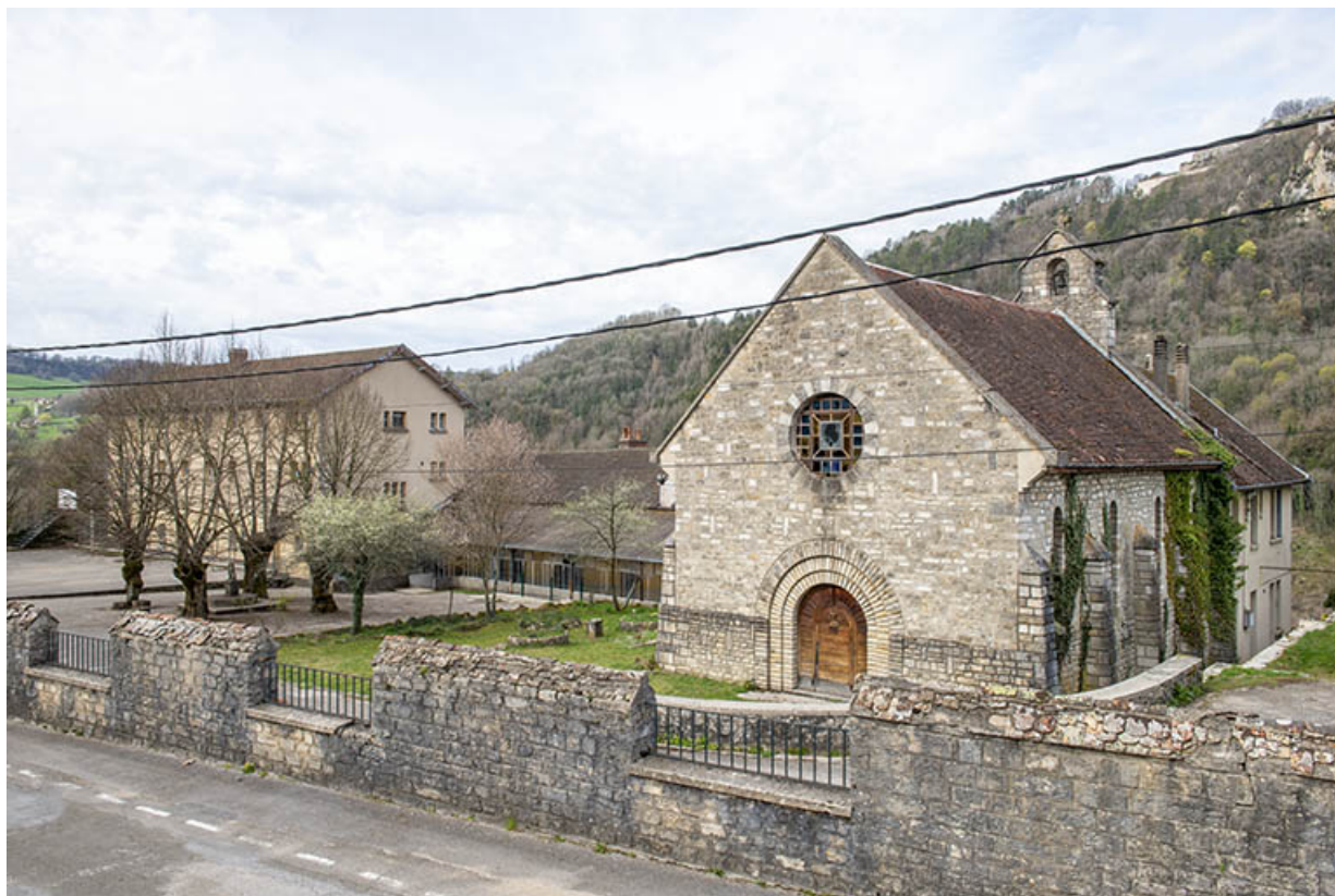
Vue de trois quarts depuis le nord-est.