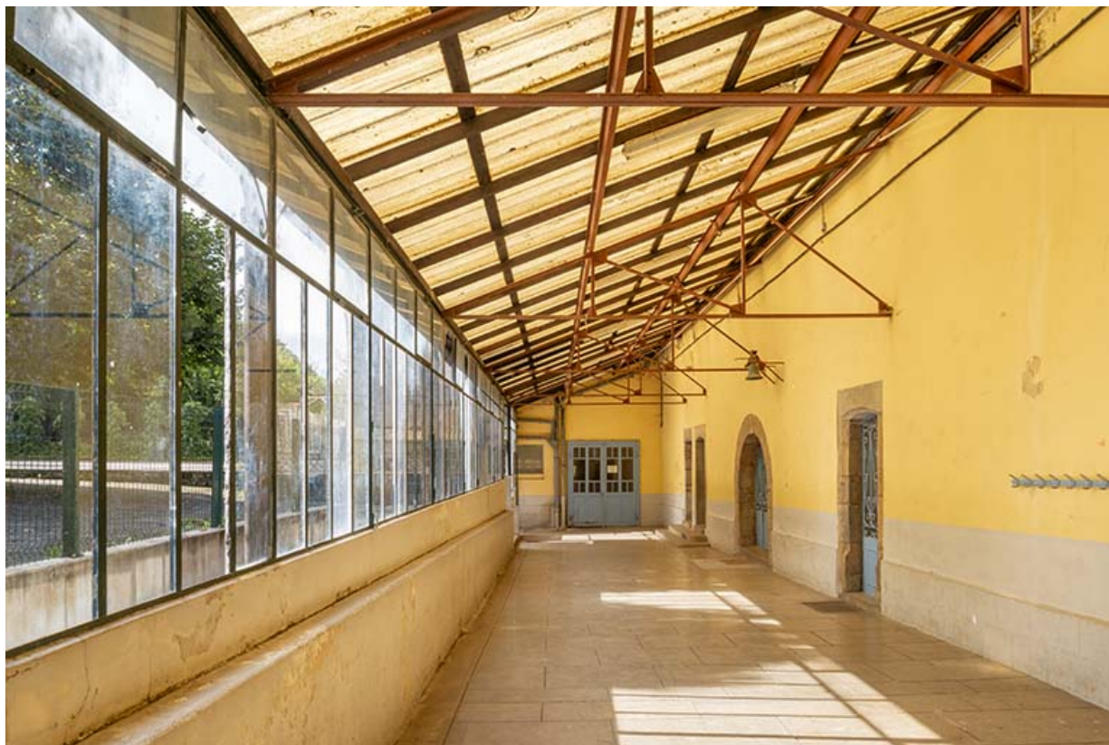
Galerie couverte, adossée contre la façade est du bâtiment conventuel.