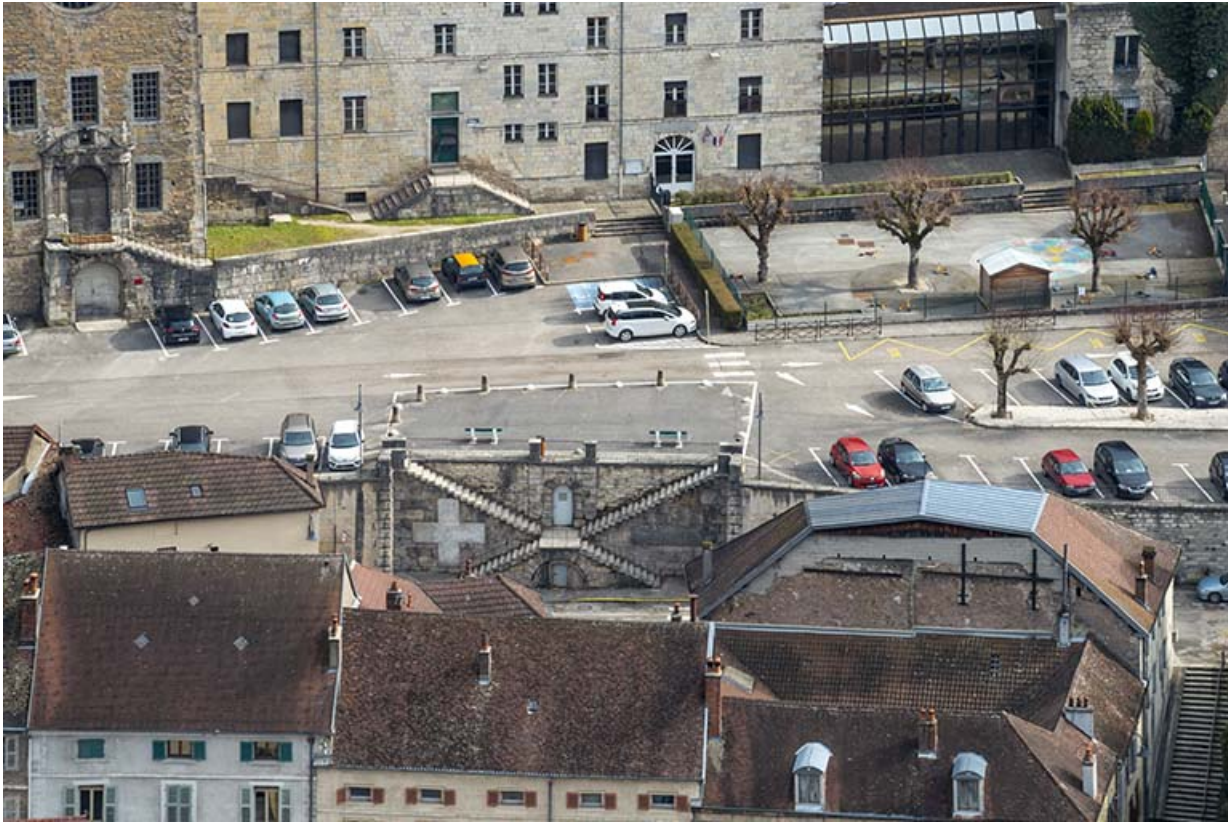
Vue depuis le fort Saint-André.