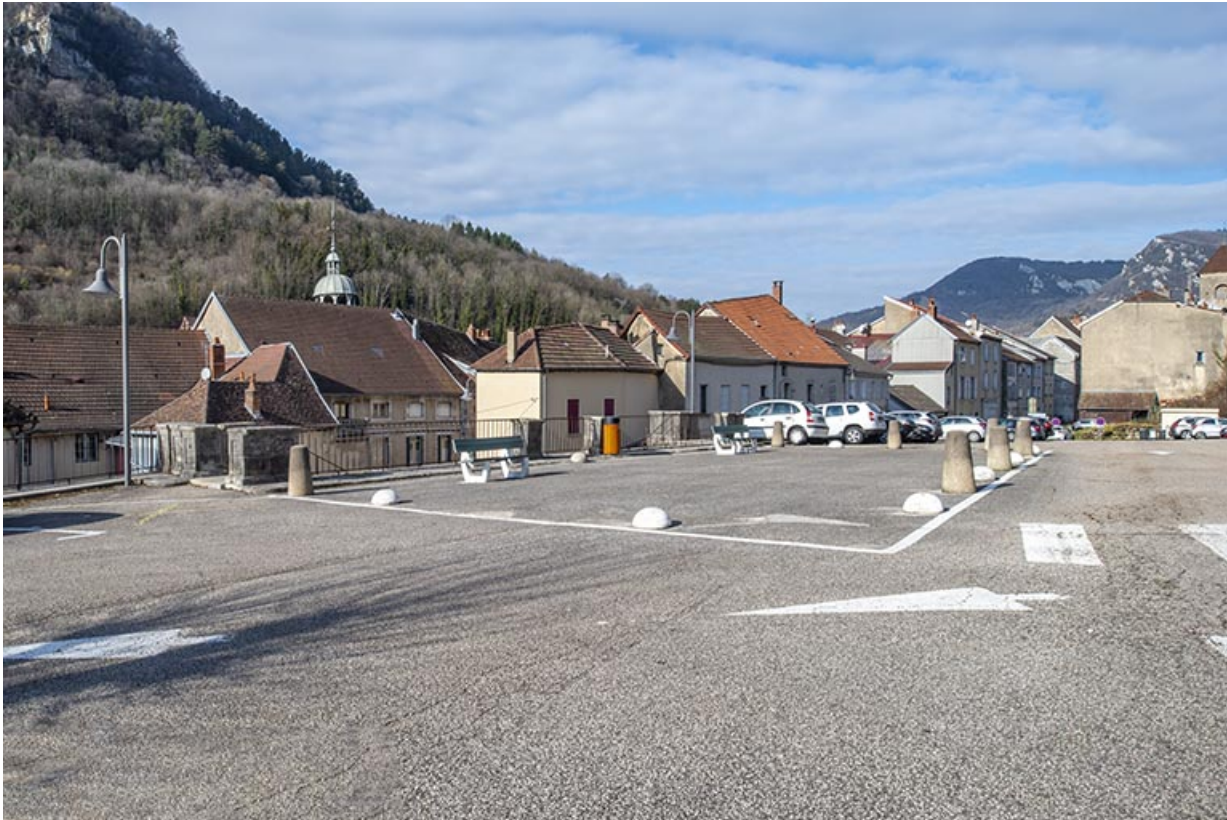
Couverture du réservoir, vue de la place Saint-Jean.