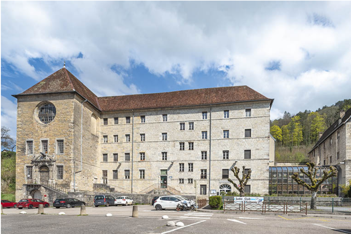
Vue depuis l'ouest.