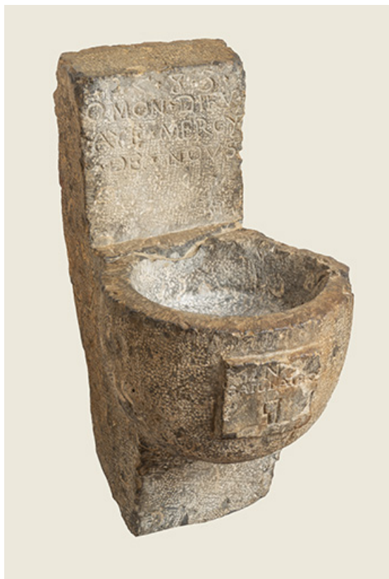
Bénitier exhumé lors du sondage archéologique de 1982 (conservé dans les collections du musée). 39, Salins-les-Bains place Émile Zola