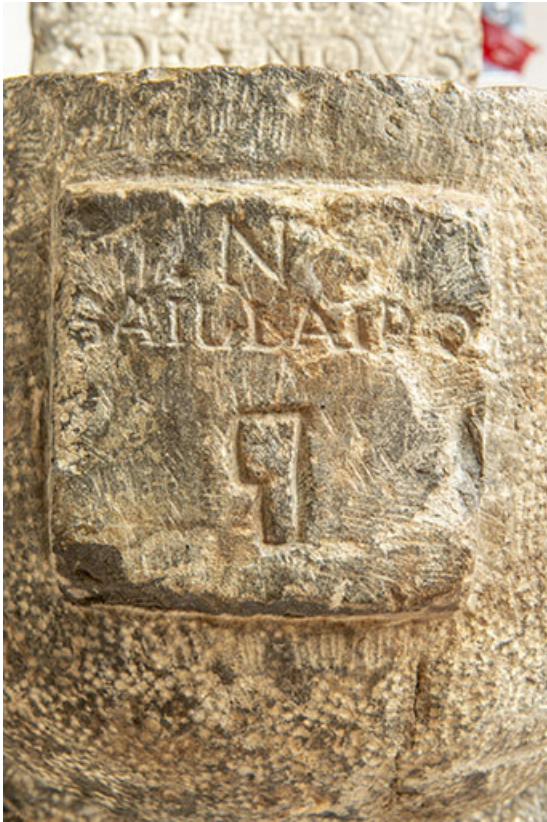
Bénitier. Détail de l'inscription : N SAILLARD.