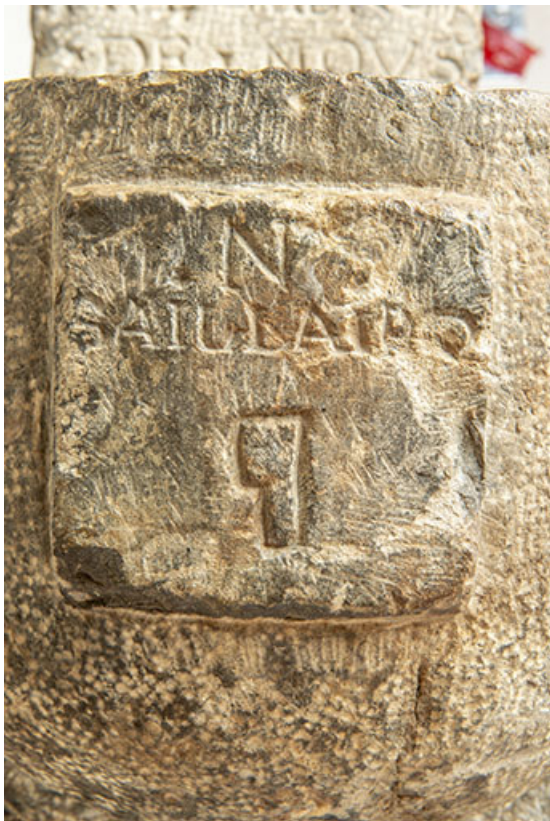
Bénitier. Détail de l'inscription : N SAILLARD.