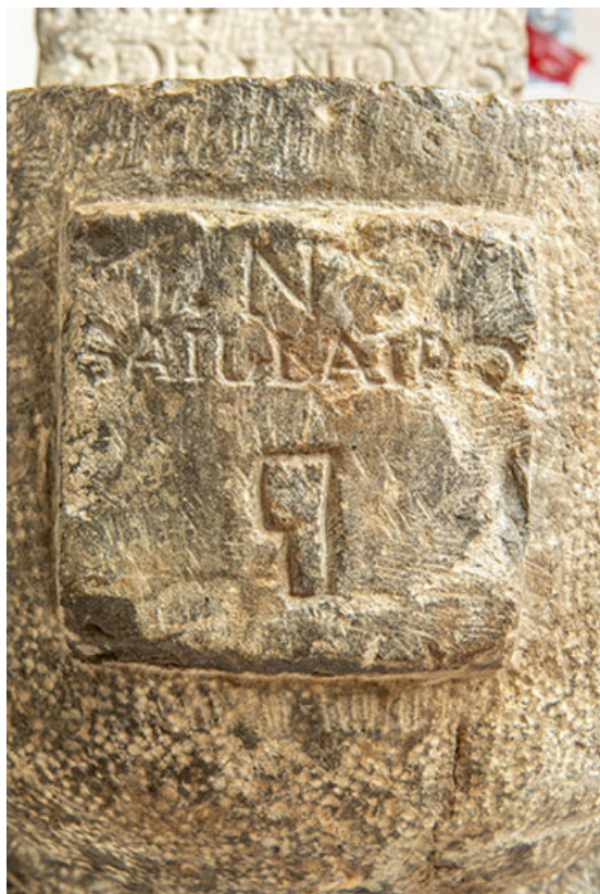
Bénitier. Détail de l'inscription : N SAILLARD.