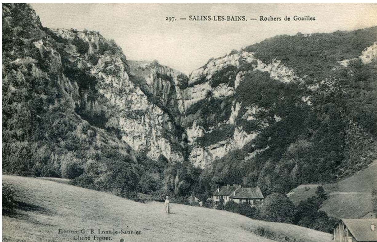
Salins-les-Bains - Rochers de Goailles, s.d. [fin 19e ou début 20e siècle].

39, Salins-les-Bains, lieudit : Goailles