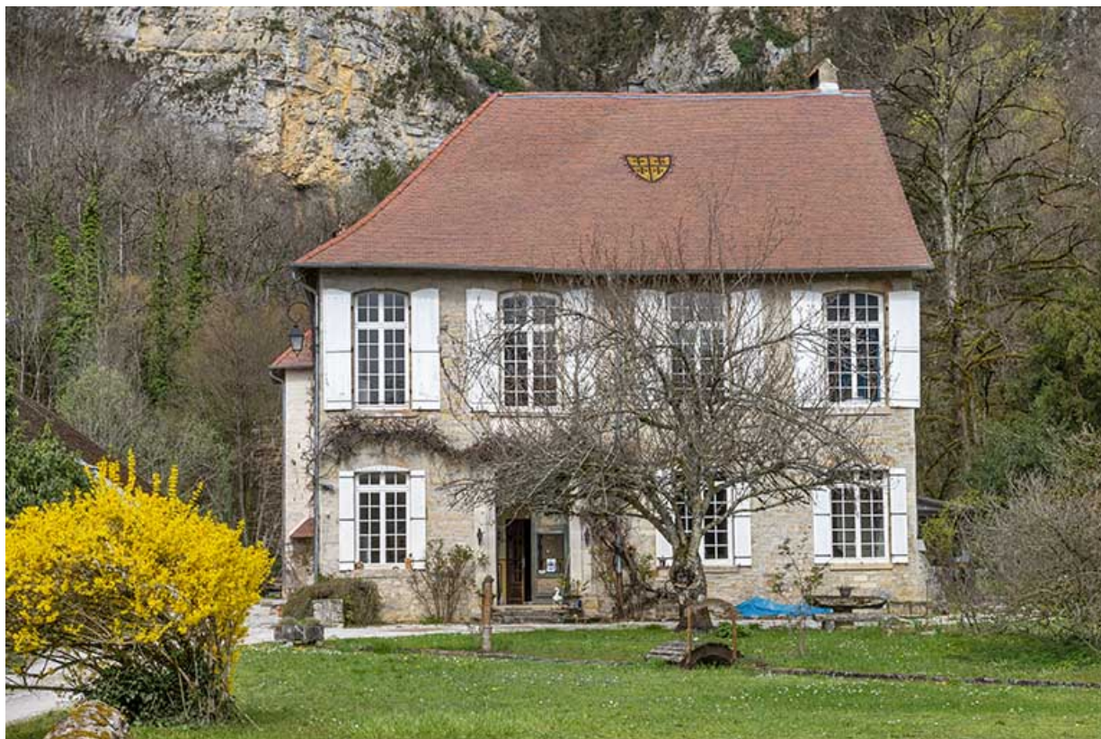
Façade sud du logis abbatial (cadrage horizontal).

39, Salins-les-Bains, lieudit : Goailles