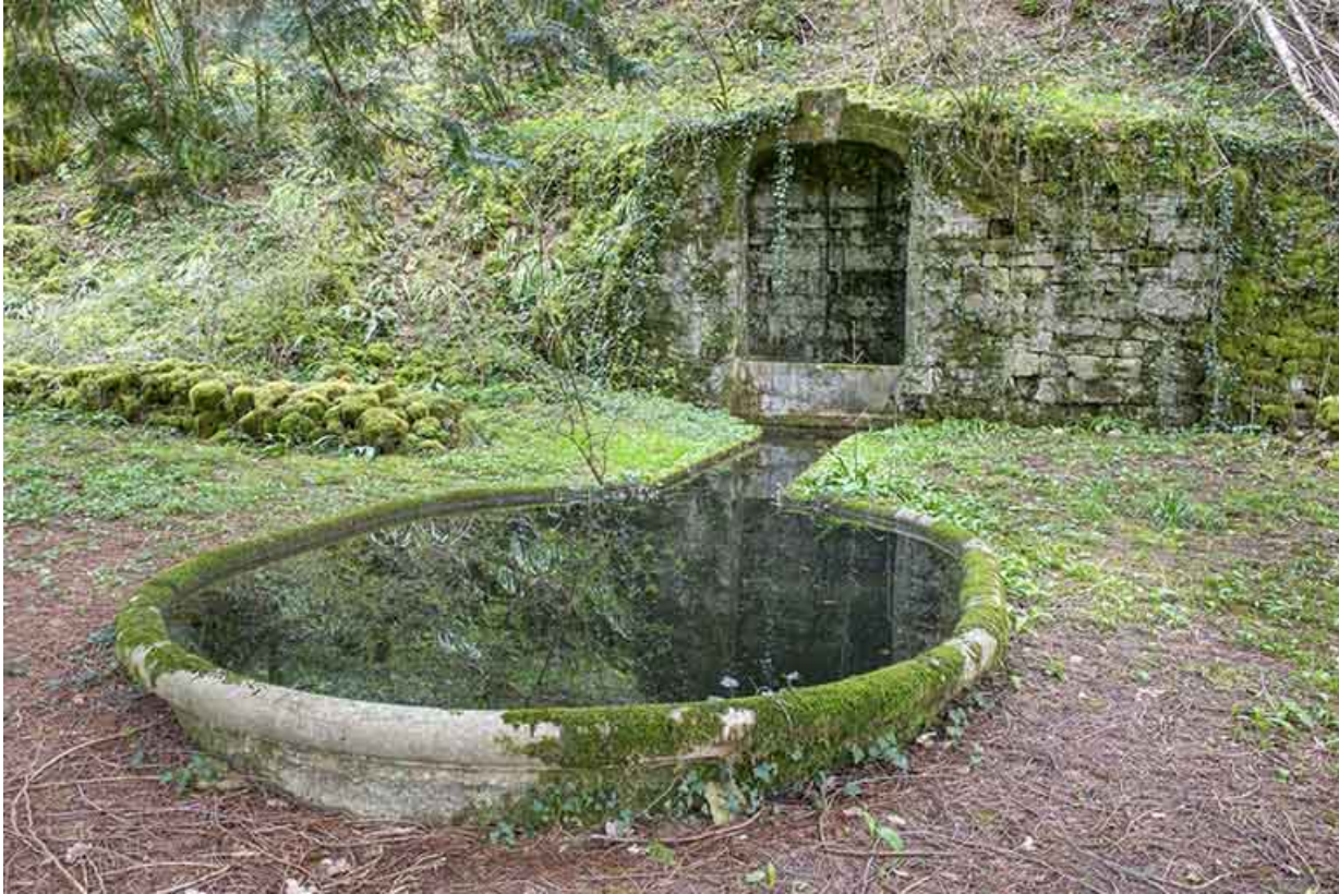
Partie est du parc : fontaine et bassin.

39, Salins-les-Bains, lieudit : Goailles