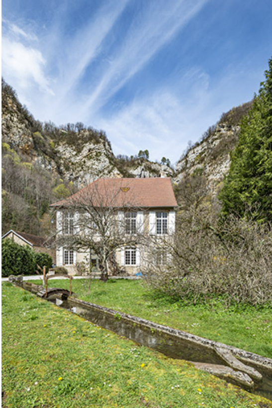
Vue depuis le jardin. Au premier plan, canal d'aménée.

39, Salins-les-Bains, lieudit : Goailles