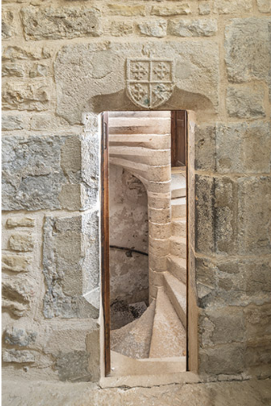
Logis abbatial. Porte (ouverte) dans le mur médiéval.

39, Salins-les-Bains, lieudit : Goailles