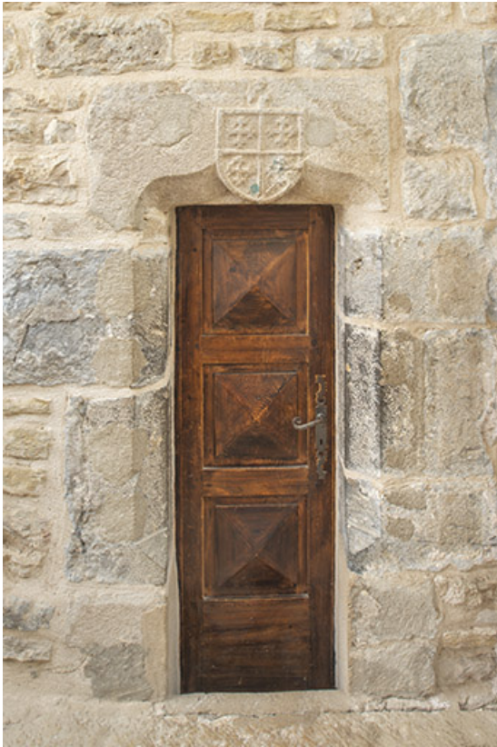
Logis abbatial. Porte dans le mur médiéval.

39, Salins-les-Bains, lieudit : Goailles