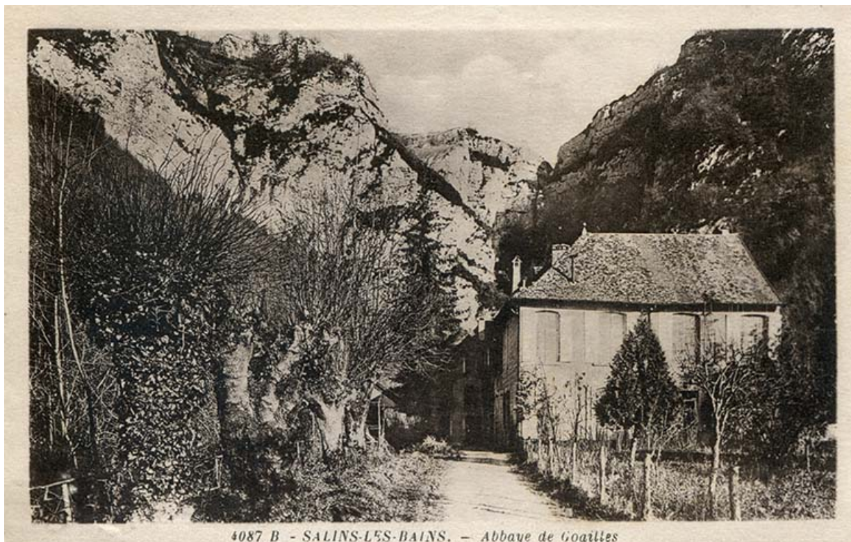
4087 B - SALINS-LES-BAINS. — Abbaye de Goailles

Salins-les-Bains - Abbaye de Goailles, s.d. [début 20e siècle].