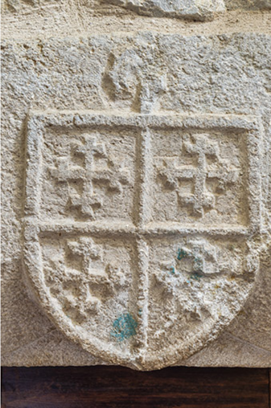
Détail du blason gravé au dessus de la porte.

39, Salins-les-Bains, lieudit : Goailles