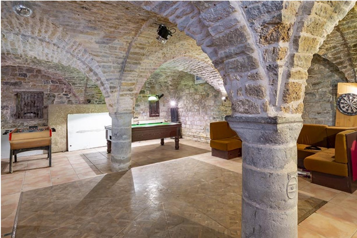
Cave voûtée d'arêtes, vue depuis le nord-est.

39, Salins-les-Bains, lieudit : Goailles