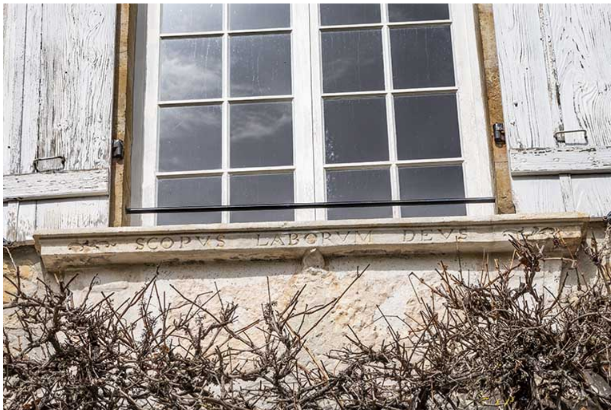
Façade du logis. Inscription gravée sous la fenêtre du premier étage.

39, Salins-les-Bains, lieudit : Goailles