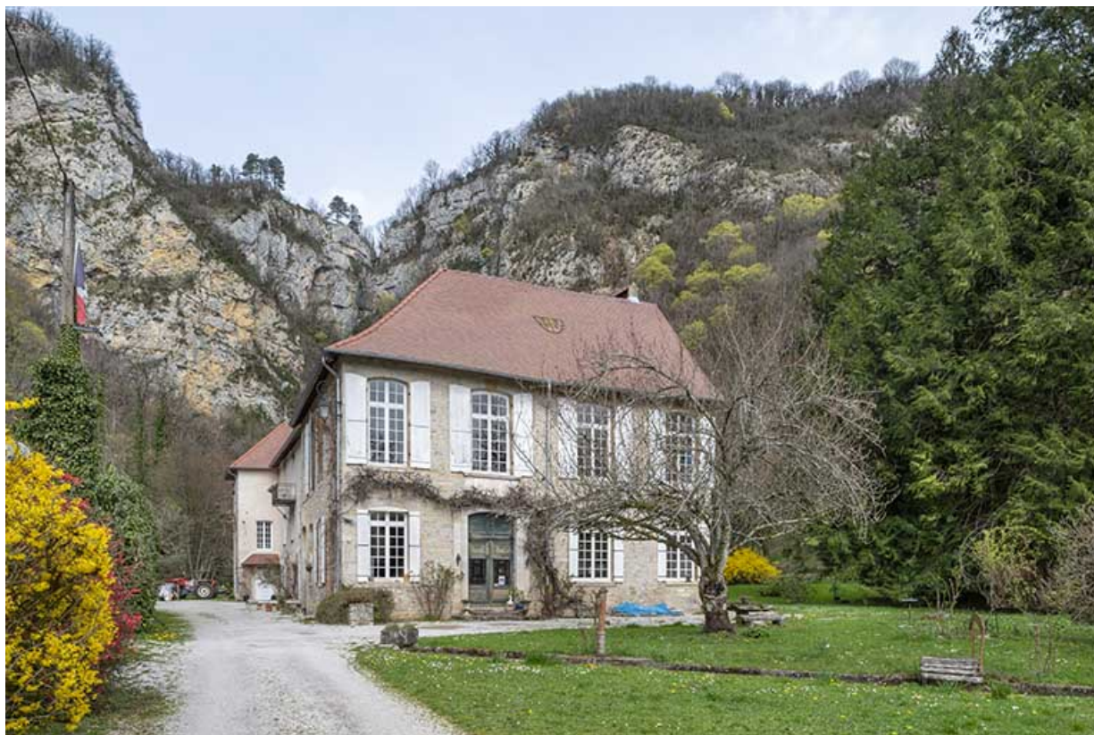
Vue rapprochée, de trois quarts.

39, Salins-les-Bains, lieudit : Goailles