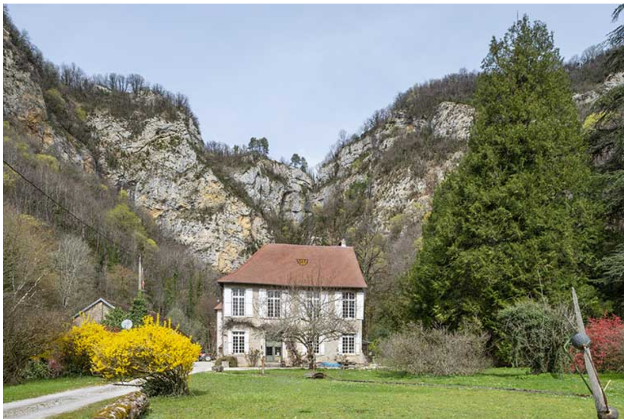
Vue rapprochée depuis le sud.

39, Salins-les-Bains, lieudit : Goailles