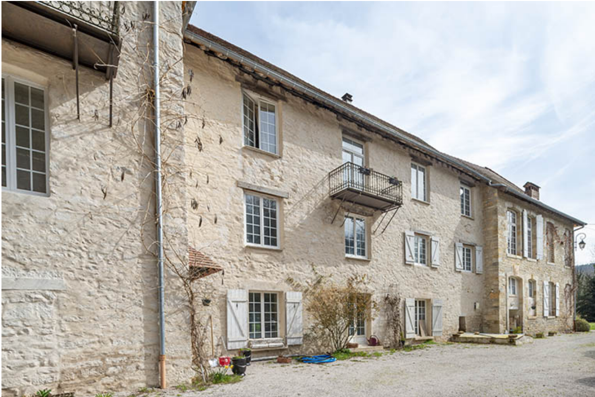
Façades ouest du logis.

39, Salins-les-Bains, lieudit : Goailles