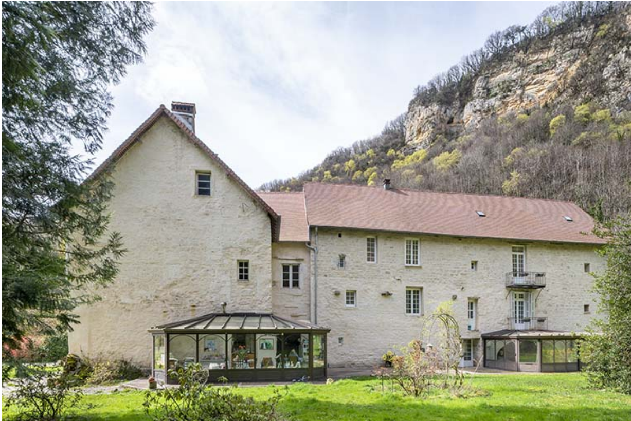
Façade nord des bâtiments.

39, Salins-les-Bains, lieudit : Goailles