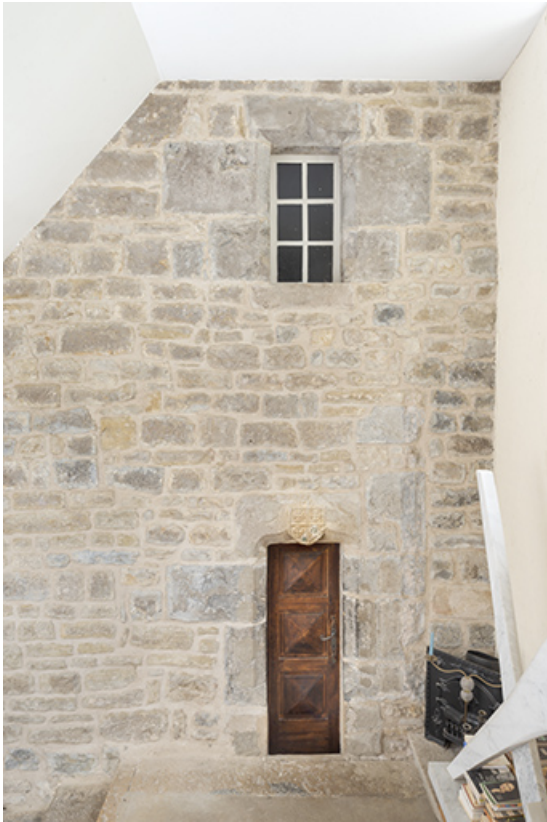
Intérieur du logis. Partie de mur médiéval.

39, Salins-les-Bains, lieudit : Goailles