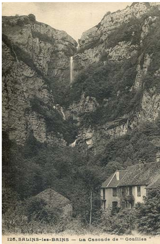
Salins-les-Bains - La cascade de " Goailles ", s.d. [fin 19e ou début 20e siècle]. 39, Salins-les-Bains, lieudit : Goailles