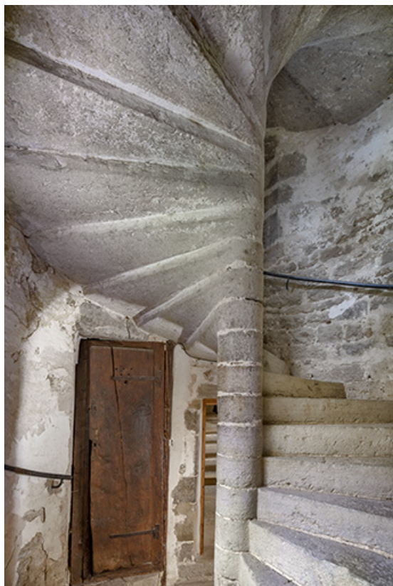
Escalier en vis (porte donnant accès au logis du 18e siècle).

39, Salins-les-Bains, lieudit : Goailles