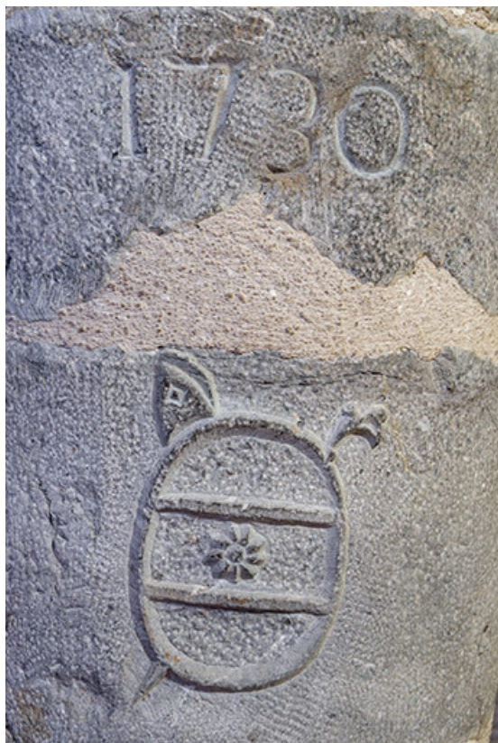
Cave voûtée. Colonne portant une date et un symbole gravé.

39, Salins-les-Bains, lieudit : Goailles