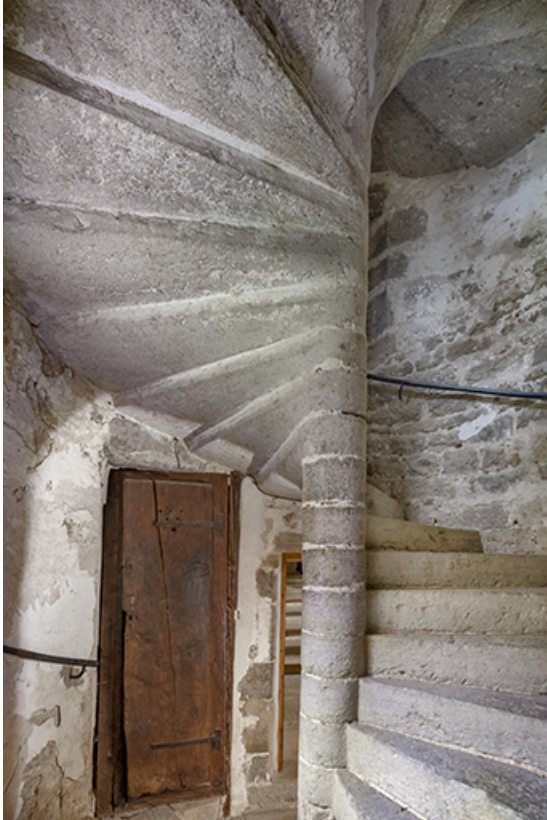
Escalier en vis (porte donnant accès au logis du 18e siècle).

39, Salins-les-Bains, lieudit : Goailles