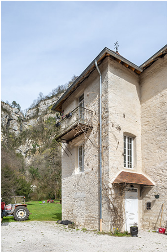
Elévation ouest de l'extrémité du logis.

39, Salins-les-Bains, lieudit : Goailles