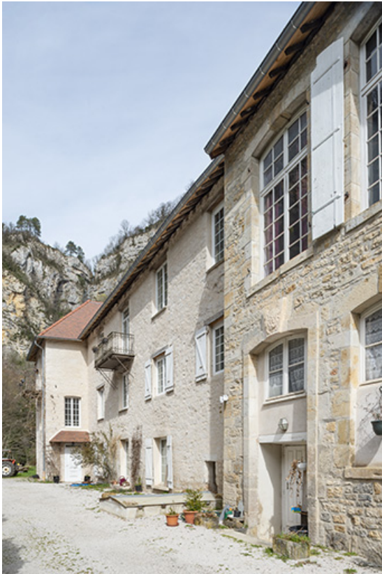
Elévation ouest du logis.

39, Salins-les-Bains, lieudit : Goailles