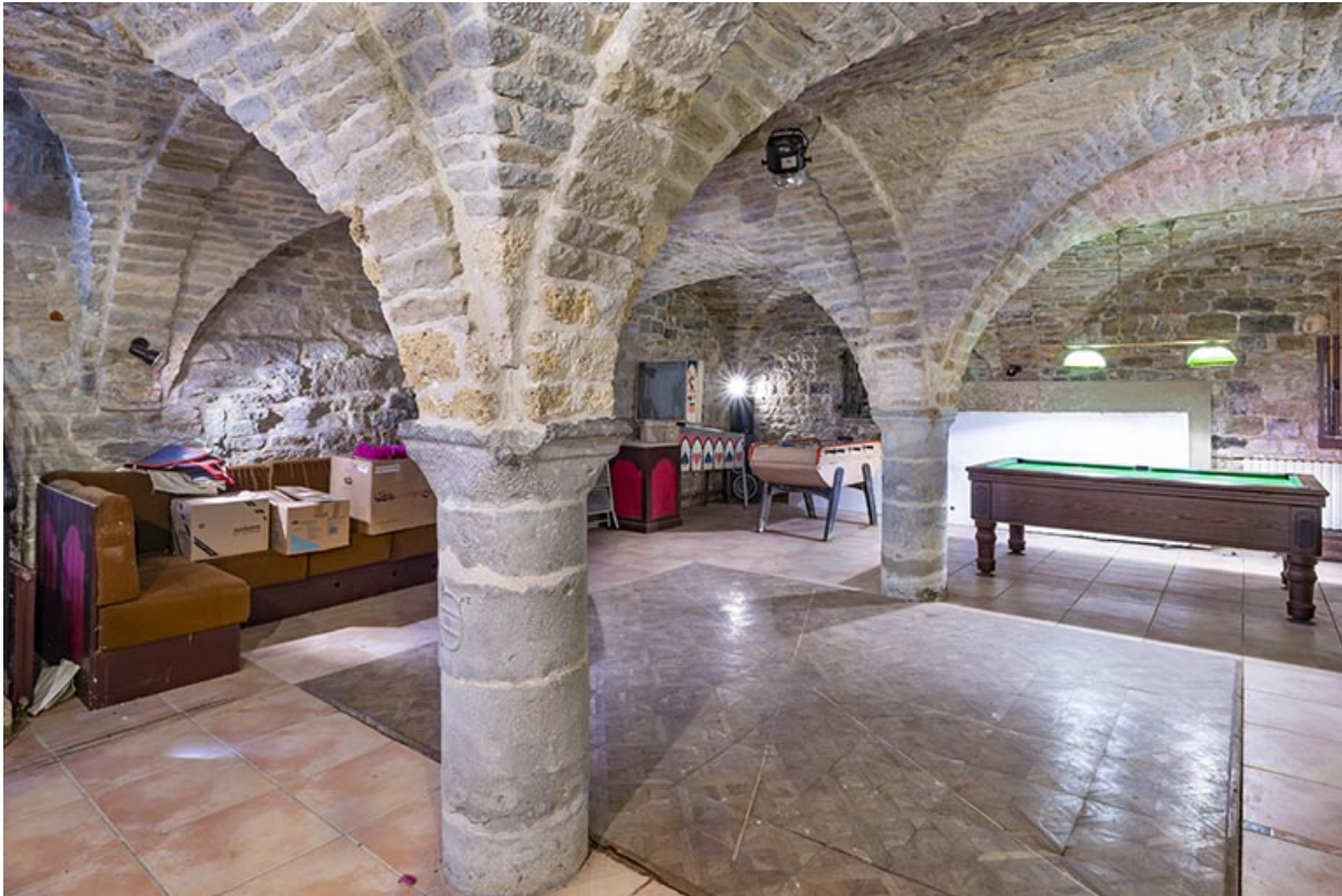
Cave voûtée d'arêtes sous le logis abbatial. Vue depuis le nord.

39, Salins-les-Bains, lieudit : Goailles