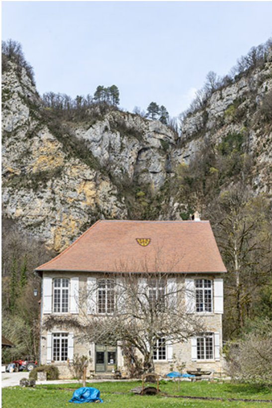
Façade sud du logis abbatial (cadrage vertical).

39, Salins-les-Bains, lieudit : Goailles