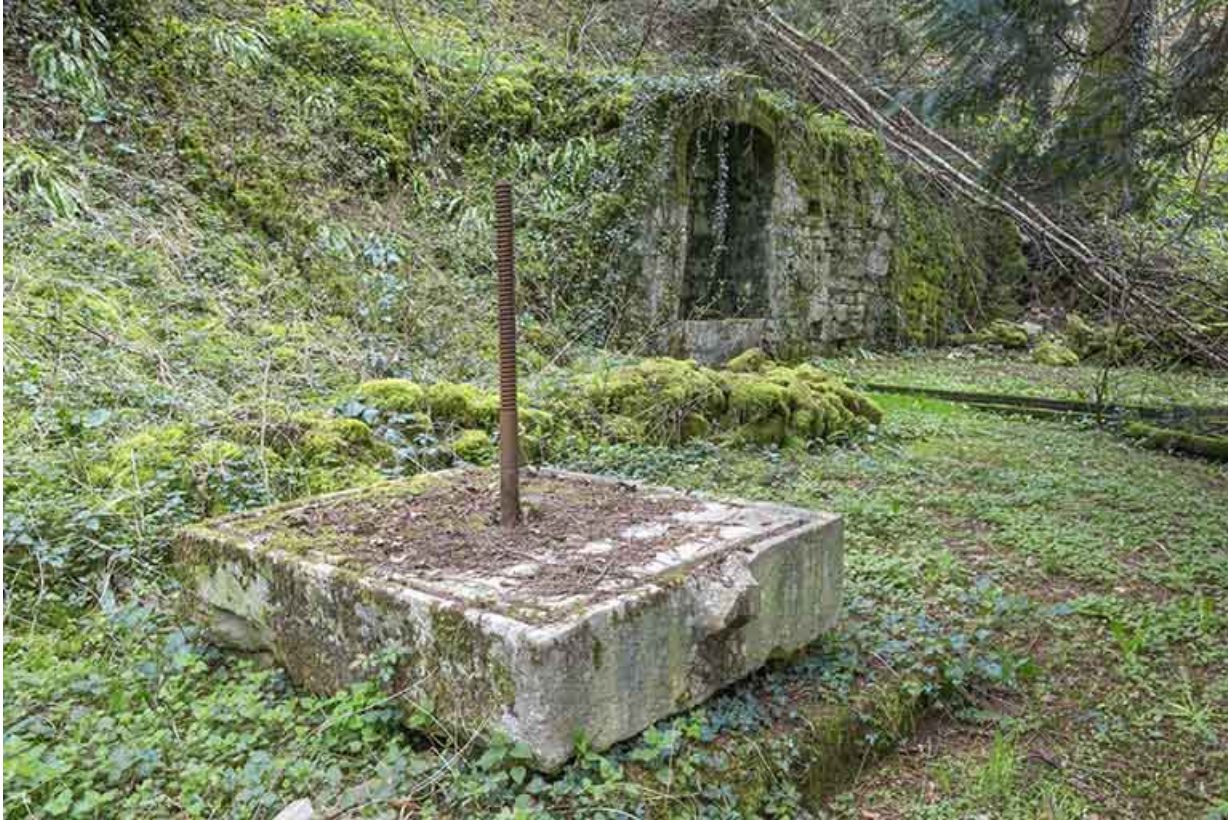
Partie est du parc. Pierre et vis d'un pressoir.

39, Salins-les-Bains, lieudit : Goailles