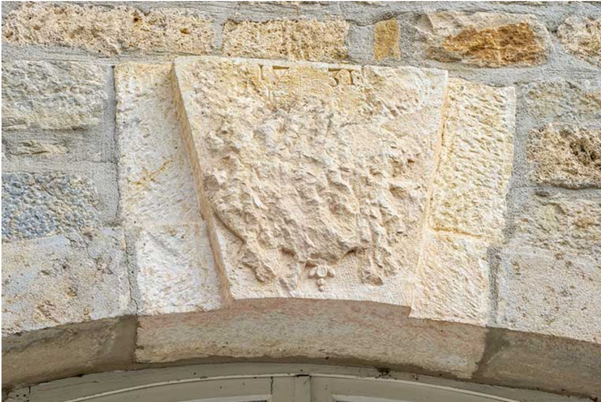
Clef d'arcade bûchée. Façade ouest du logis.

39, Salins-les-Bains, lieudit : Goailles