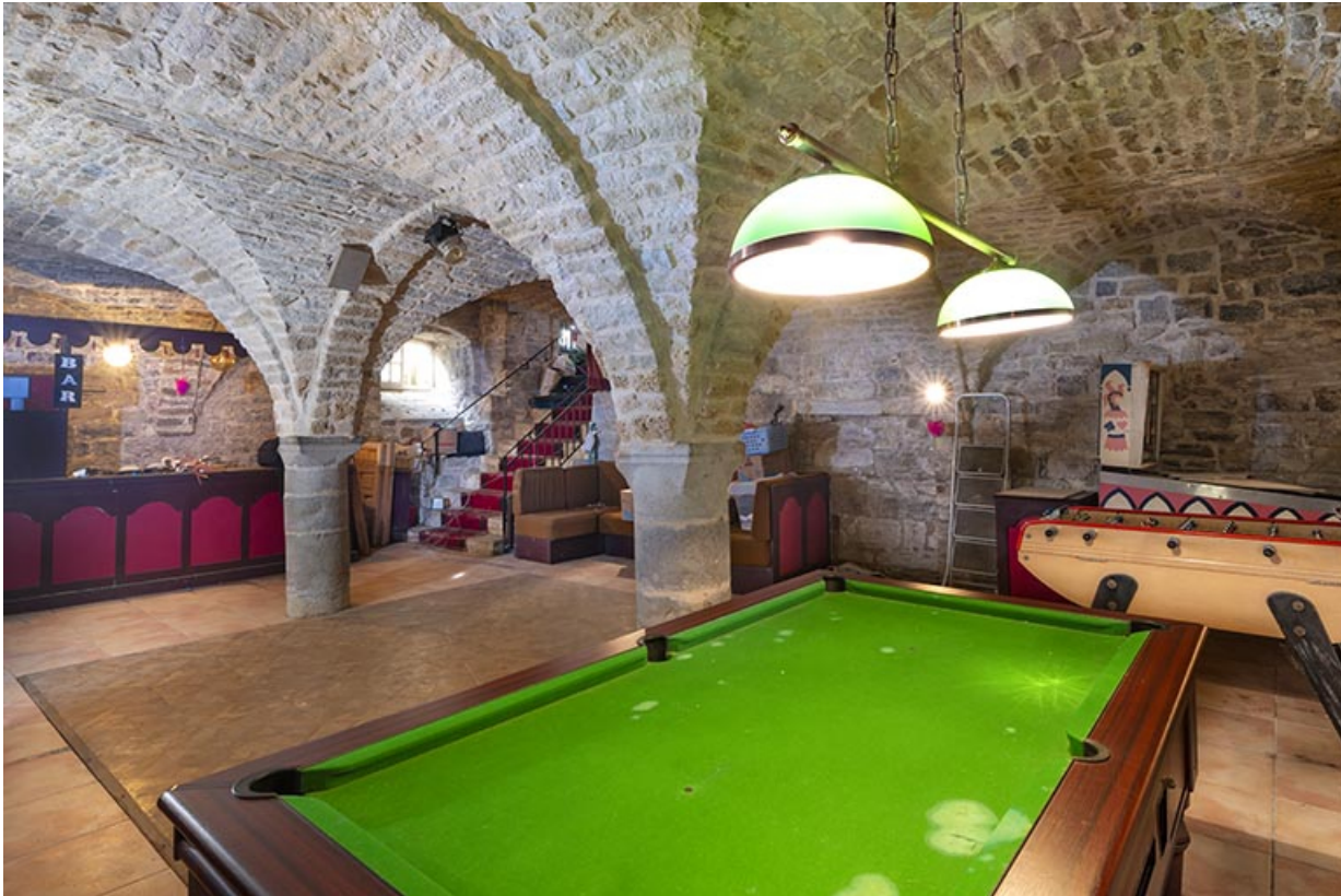
Cave voûtée d'arêtes, vue depuis le sud-ouest.

39, Salins-les-Bains, lieudit : Goailles