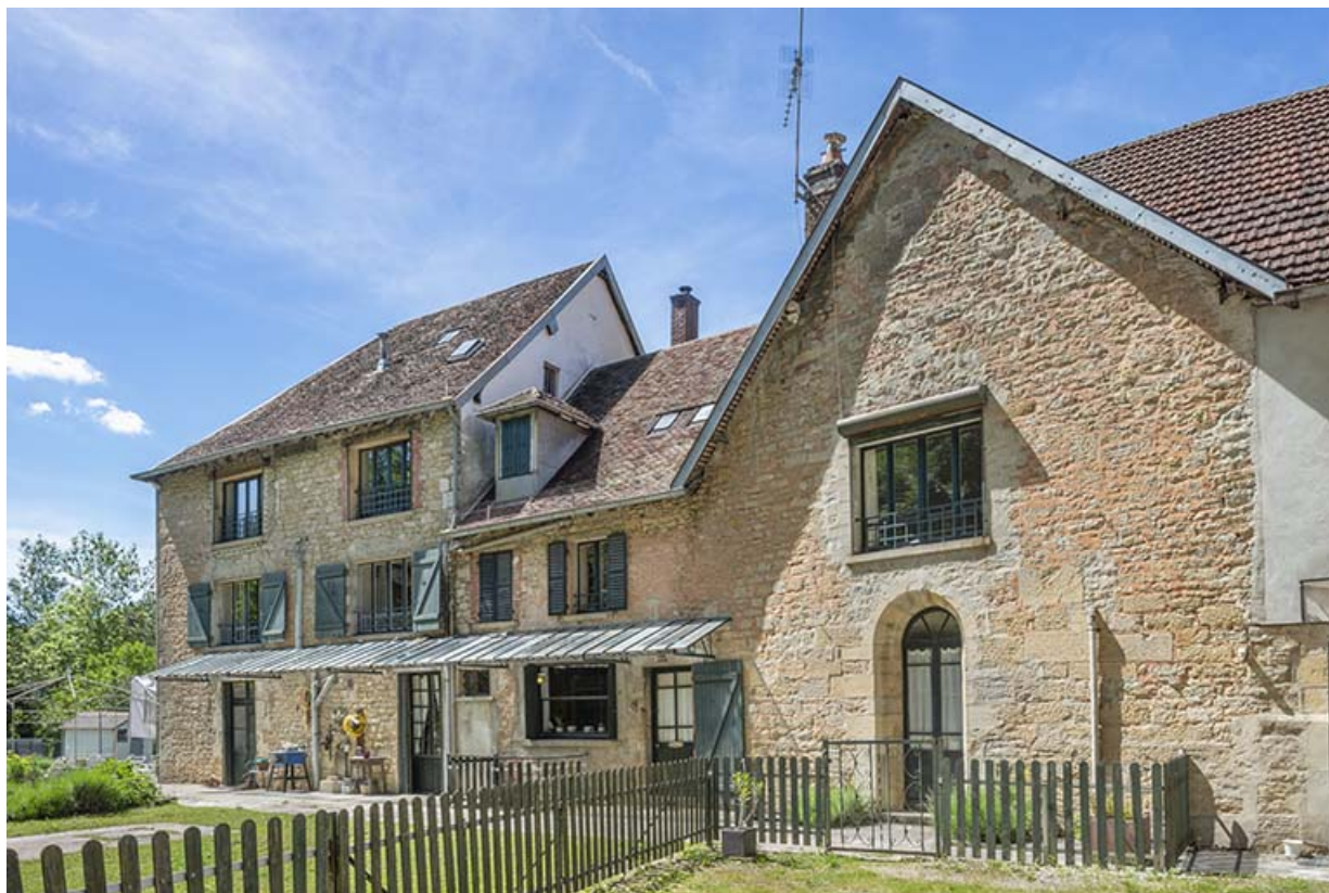
Façades orientales depuis l'est.

39, Salins-les-Bains chemin de l' Ermitage