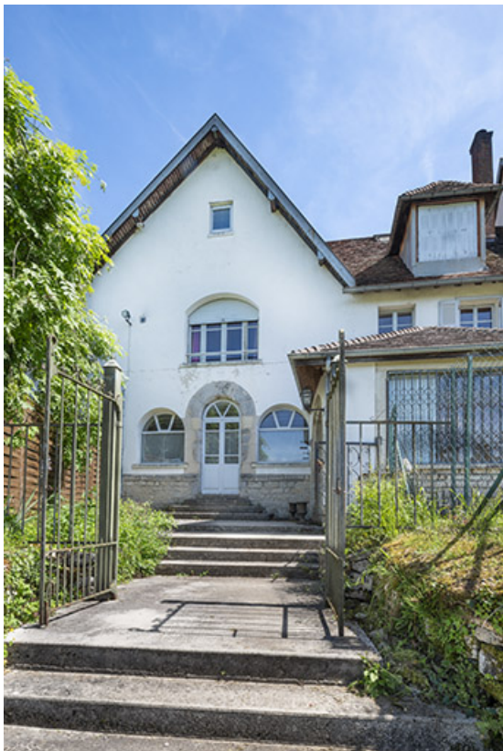
Mur pignon de la chapelle.

39, Salins-les-Bains chemin de l' Ermitage