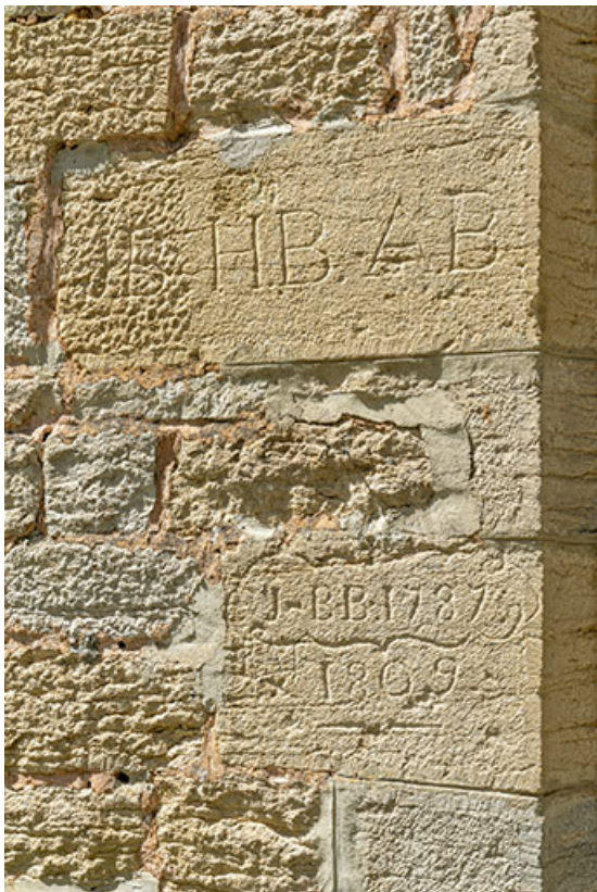
Graffitis sur le mur est de la chapelle.

39, Salins-les-Bains chemin de l' Ermitage