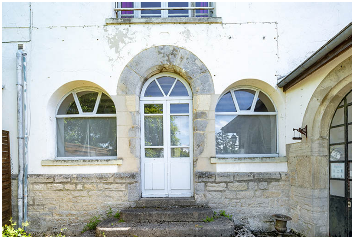
Façade de la chapelle : baies ouest.

39, Salins-les-Bains chemin de l' Ermitage