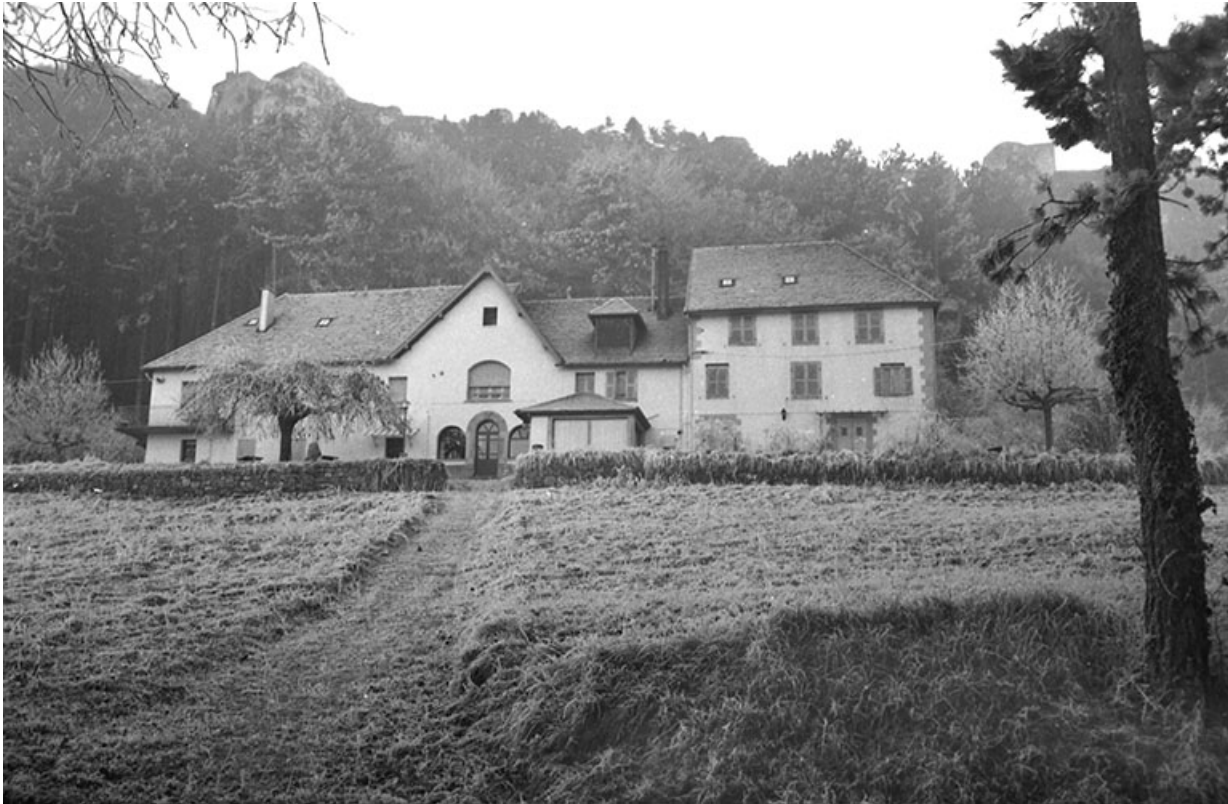
Vue d'ensemble depuis le nord-ouest, s.d. [3e quart 20e siècle].

39, Salins-les-Bains chemin de l' Ermitage