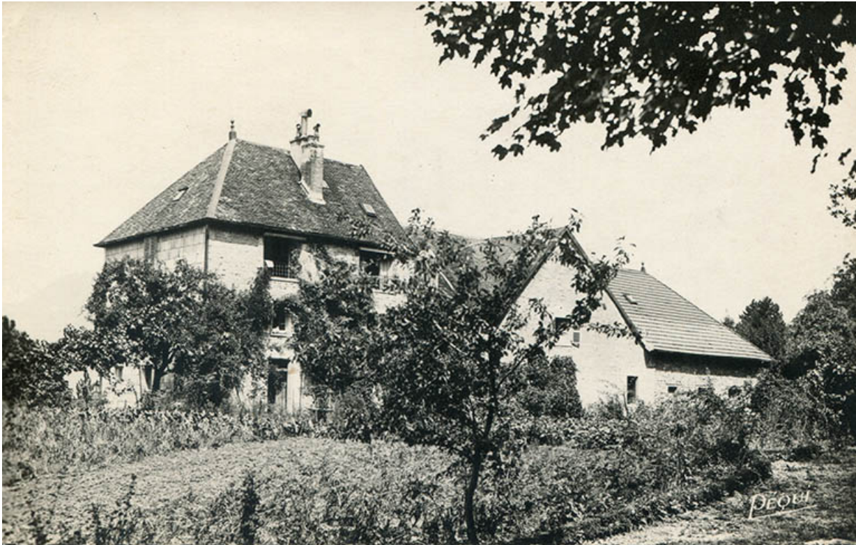
L'ermitage, s.d. [milieu 20e siècle].

39, Salins-les-Bains chemin de l' Ermitage