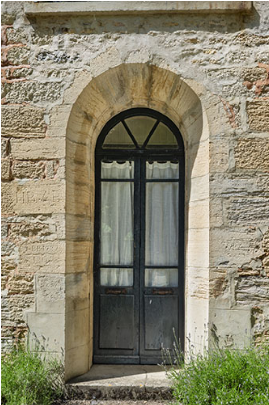
Porte orientale de la chapelle.

39, Salins-les-Bains chemin de l' Ermitage