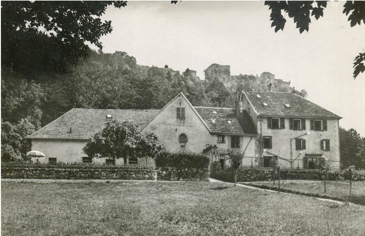
Salins-les-Bains (Jura) - L'Hermitage, s.d. [vers 1960].

39, Salins-les-Bains chemin de l' Ermitage