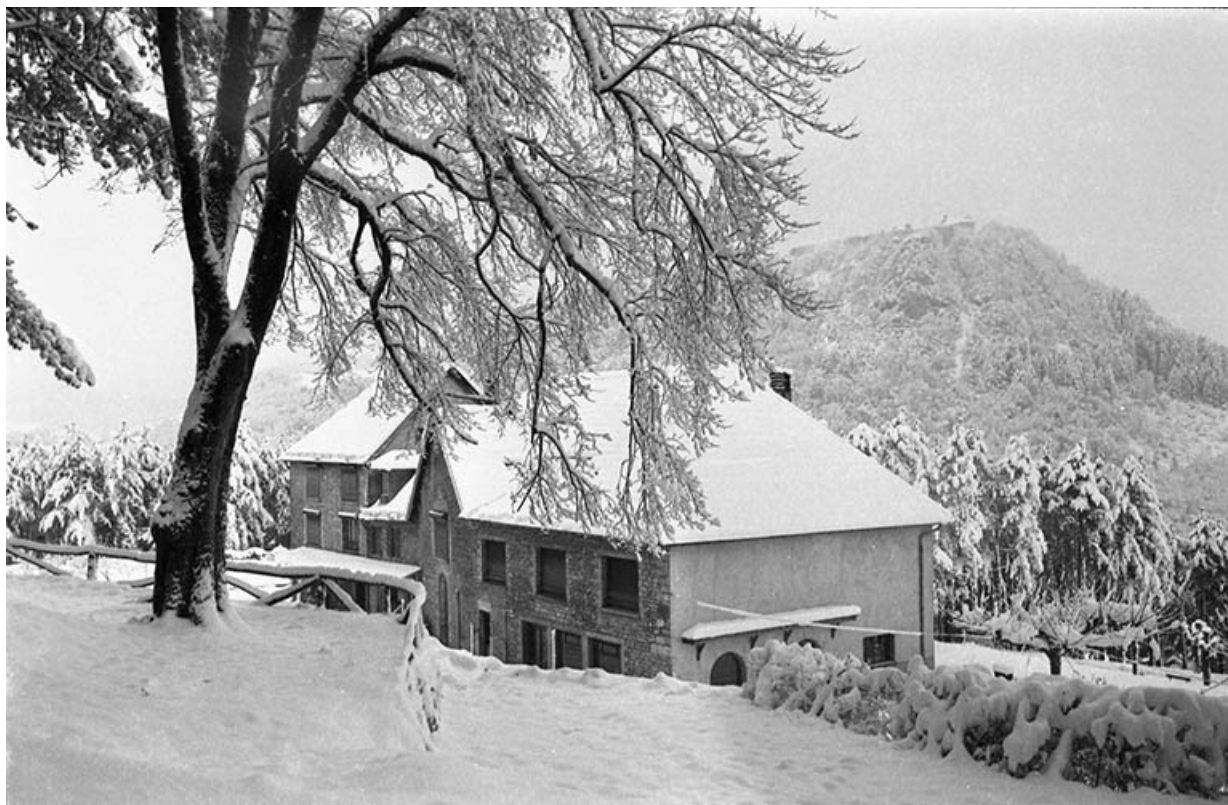
Vue de trois quarts arrière, s.d. [3e quart 20e siècle].

39, Salins-les-Bains chemin de l' Ermitage