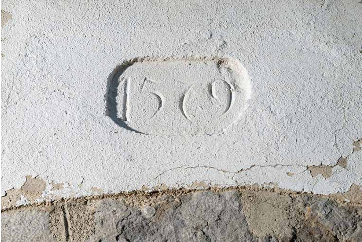
Date gravée sur le linteau de la chapelle (porte ouest).

39, Salins-les-Bains chemin de l' Ermitage