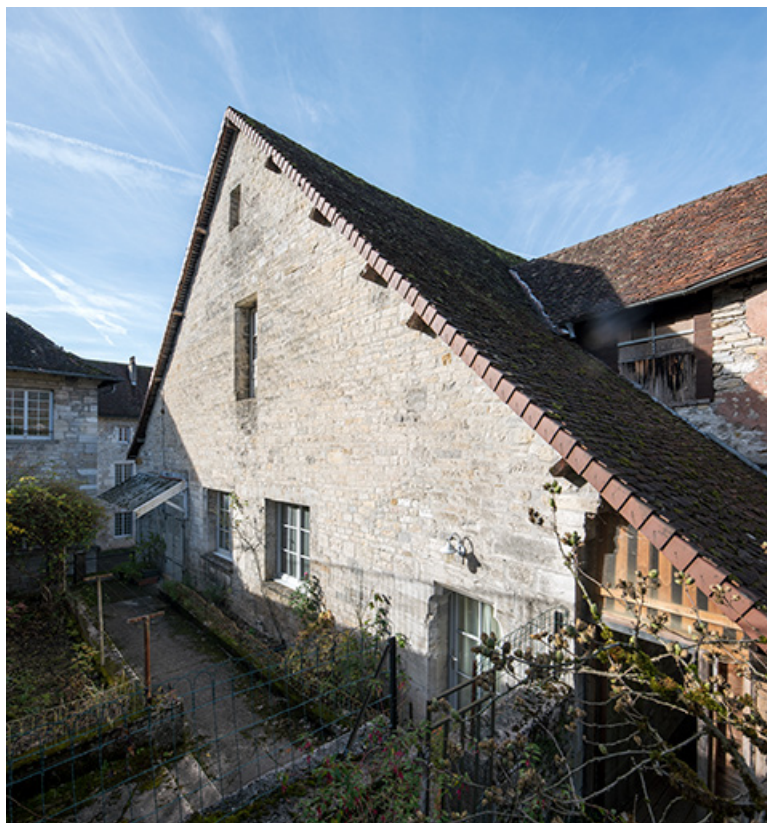
Mur-pignon est de la maison du Temple.

39, Salins-les-Bains, 5, 7 rue du Temple