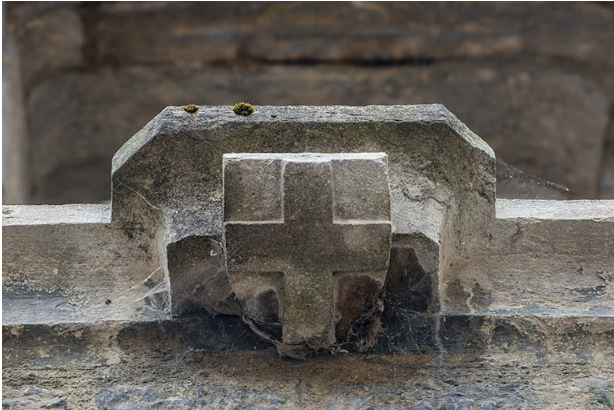
Niche du mur pignon. Détail de l'écusson gravé.

39, Salins-les-Bains, 5, 7 rue du Temple