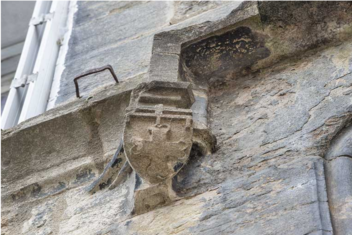
Bandeau surmontant la niche. Détail du culot gauche.

39, Salins-les-Bains, 5, 7 rue du Temple