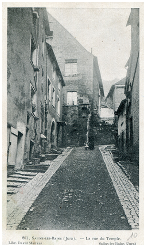
Salins-les-Bains (Jura) - La rue du Temple, s.d. [début 20e siècle].

39, Salins-les-Bains, 5, 7 rue du Temple