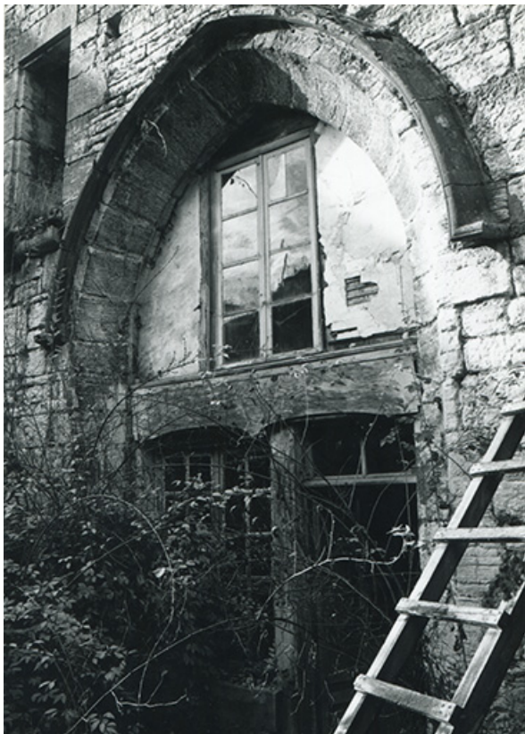
Chapelle. Baie couverte d'un arc en cintre brisé, 1990.

39, Salins-les-Bains, 5, 7 rue du Temple