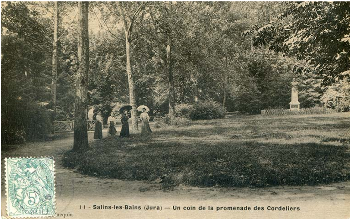
Salins-les-Bains (Jura). Un coin de la promenade des Cordeliers, s.d. [fin 19e ou début 20e siècle].