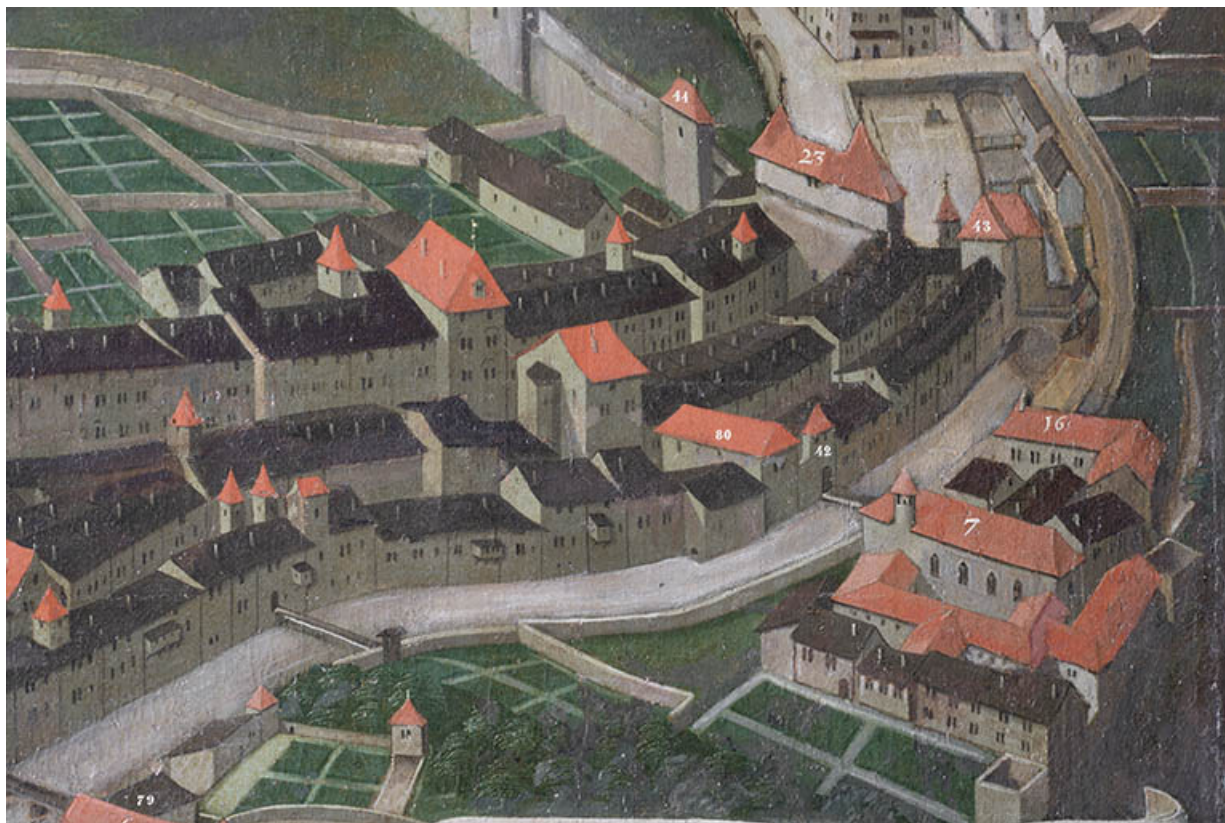
Tableau de Nicolas Richard (1628). Porte Haute (n°23). 39, Salins-les-Bains rue Béchet