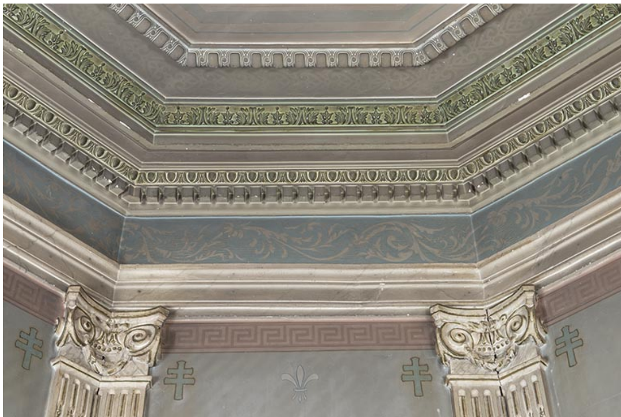
Partie supérieure du chevet de la chapelle.

39, Salins-les-Bains, 8 rue des Claristes