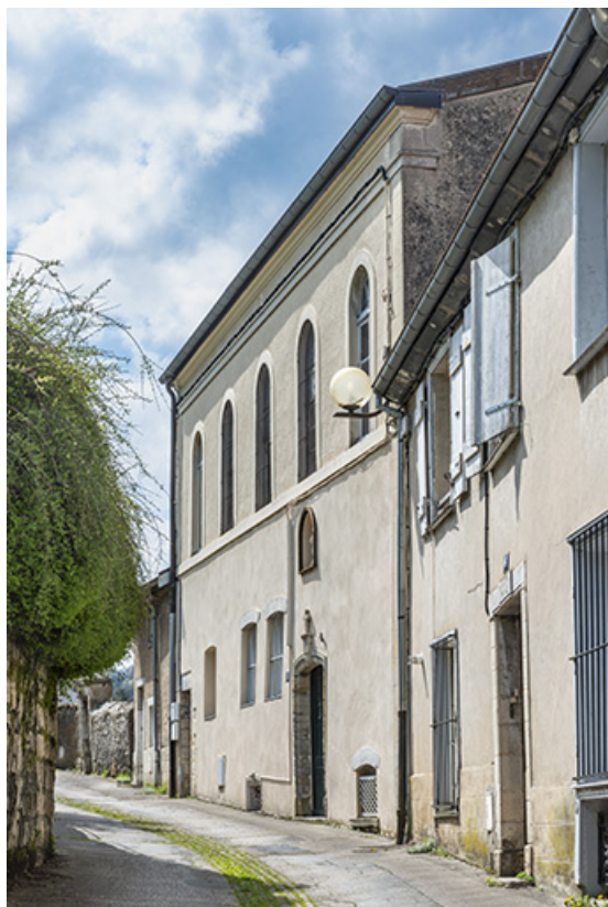
Façade antérieure vue de trois quarts droite.

39, Salins-les-Bains, 8 rue des Claristes