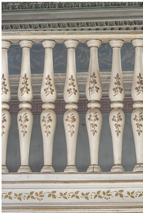
Chapelle. Détail des balustres de la tribune.

39, Salins-les-Bains, 8 rue des Claristes