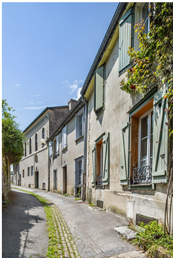
Vue en enfilade de la rue, depuis le nord.

39, Salins-les-Bains, 8 rue des Claristes