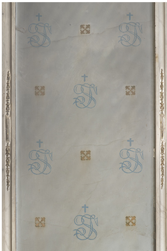
Décor de la chapelle. Peinture au pochoir (SF).

39, Salins-les-Bains, 8 rue des Claristes