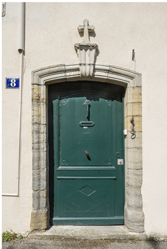
Façade antérieure. Détail de la porte.

39, Salins-les-Bains, 8 rue des Claristes