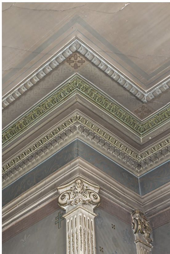
Détail des corniches du choeur.

39, Salins-les-Bains, 8 rue des Claristes