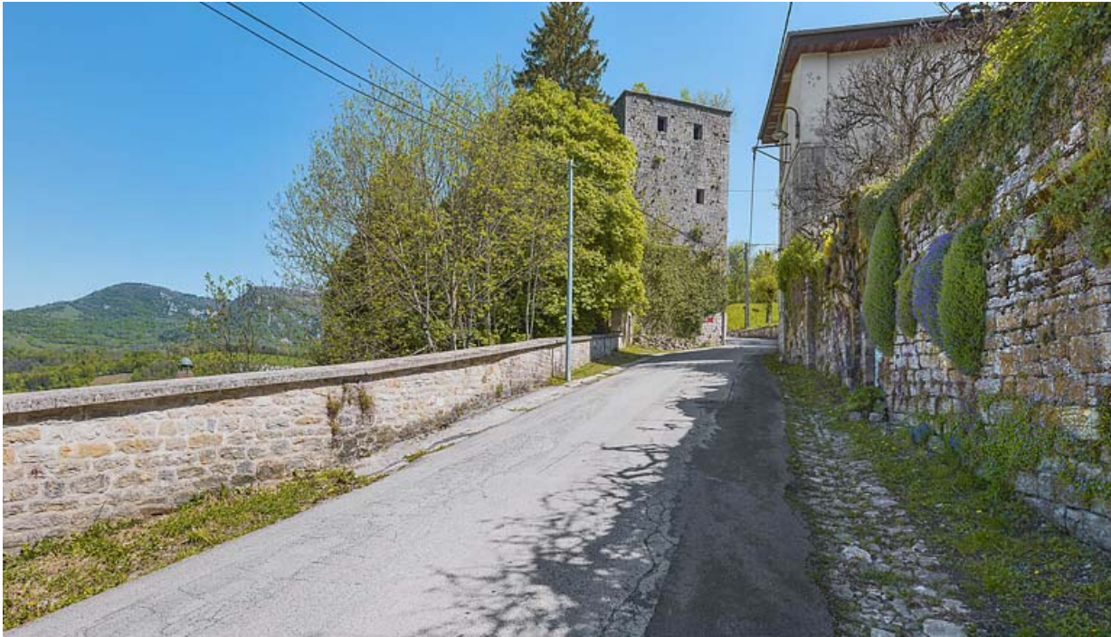
Vue depuis la rue de Chambenois.