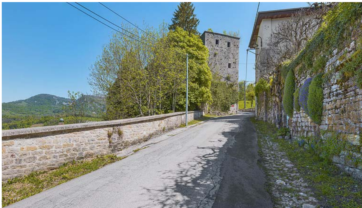
Vue depuis la rue de Chambenois.