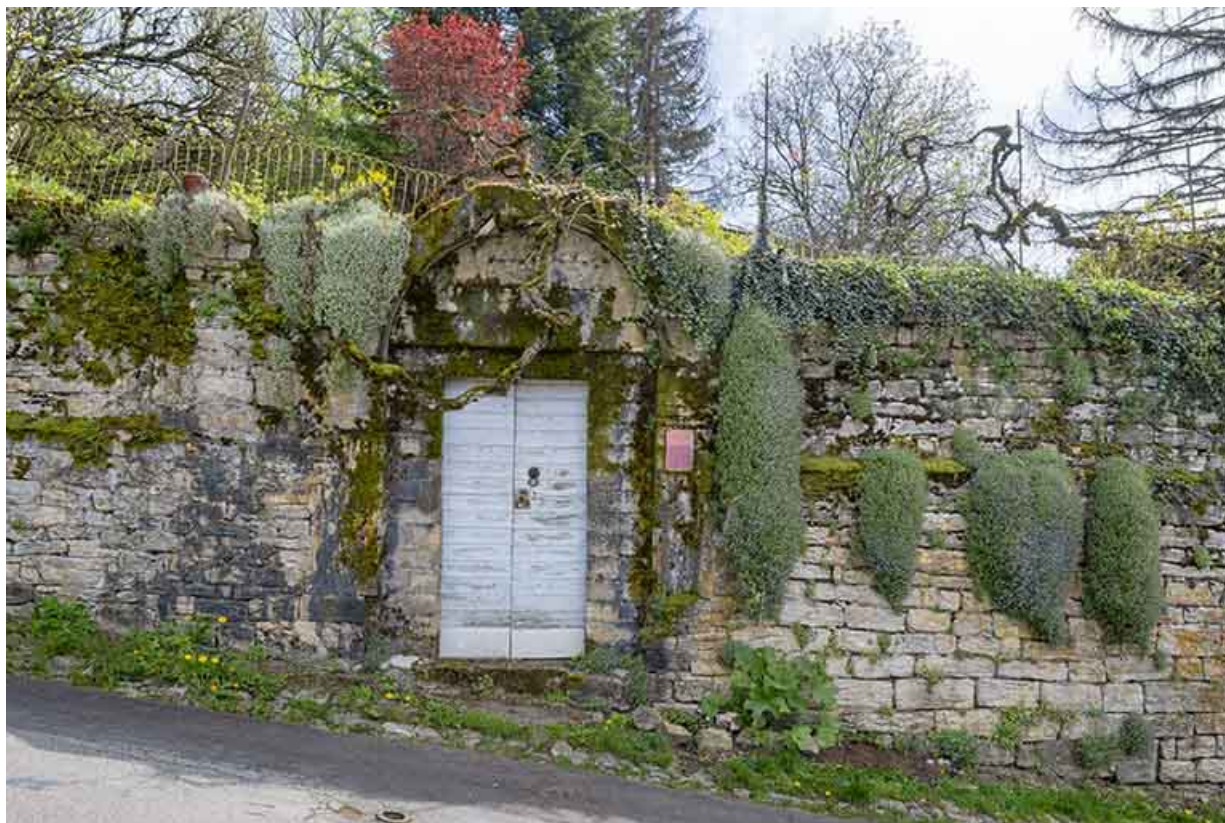
Porte d'entrée rue des Chambenois.