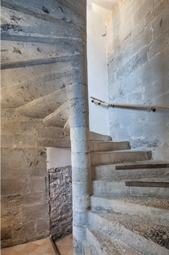
Escalier en vis (bâtiment sur rue).

39, Salins-les-Bains, 103 rue de la République