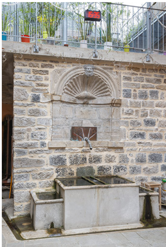
Fontaine adossée au mur de la cour.

39, Salins-les-Bains, 103 rue de la République