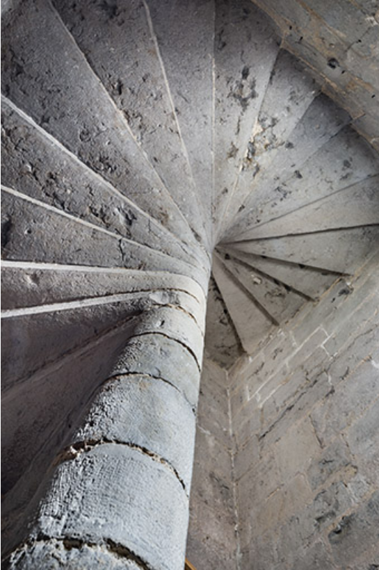
Escalier en vis. Vue en contre-plongée.

39, Salins-les-Bains, 103 rue de la République