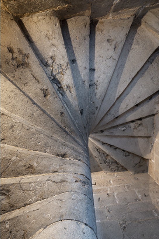
Escalier en vis. Vue en contre-plongée.

39, Salins-les-Bains, 103 rue de la République