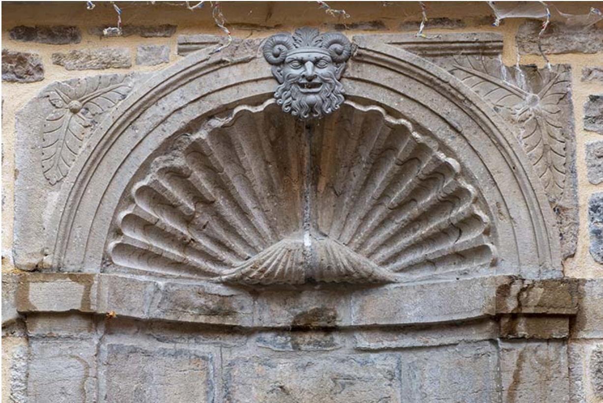
Décor de coquille Saint-Jacques de la fontaine.

39, Salins-les-Bains, 103 rue de la République