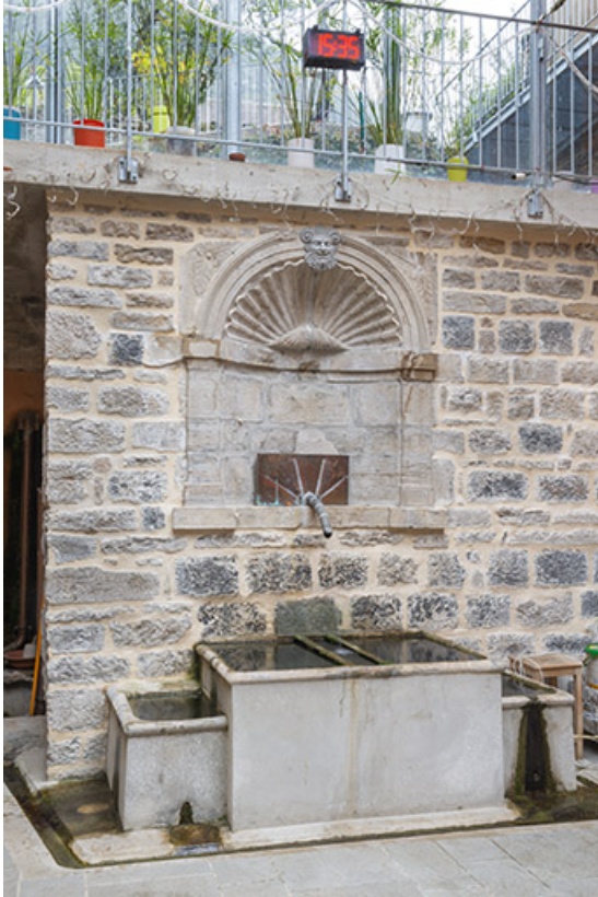
Fontaine adossée au mur de la cour.

39, Salins-les-Bains, 103 rue de la République