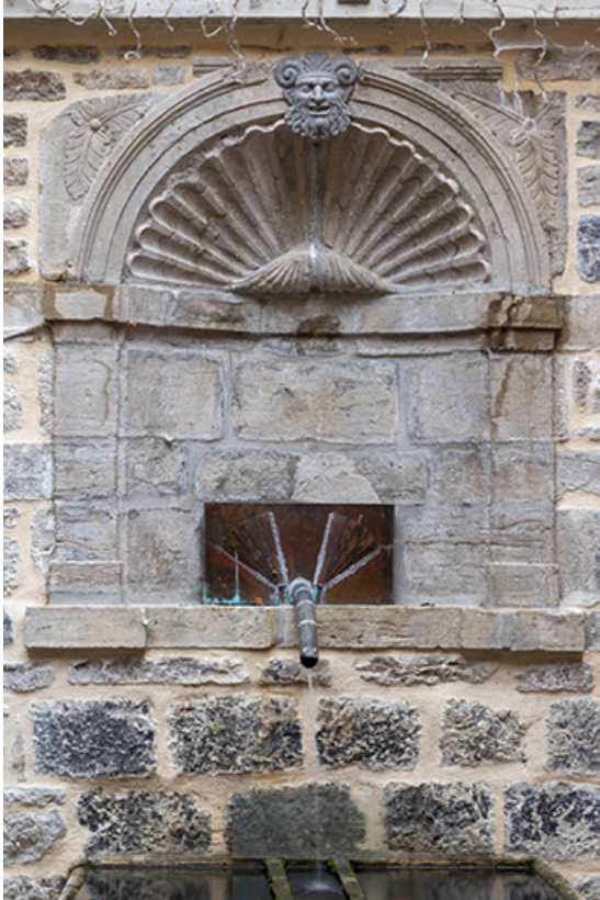
Fontaine. Vue de face.

39, Salins-les-Bains, 103 rue de la République