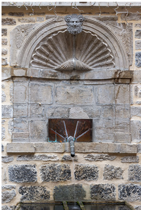
Fontaine. Vue de face.

39, Salins-les-Bains, 103 rue de la République