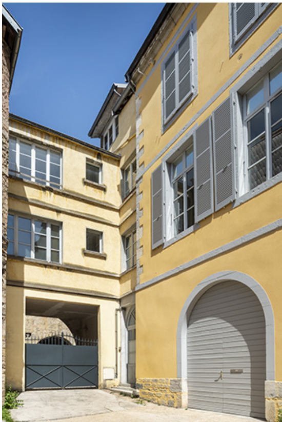
Vue de l'angle nord-est des bâtiments depuis la cour.

39, Salins-les-Bains, 85 rue de la République