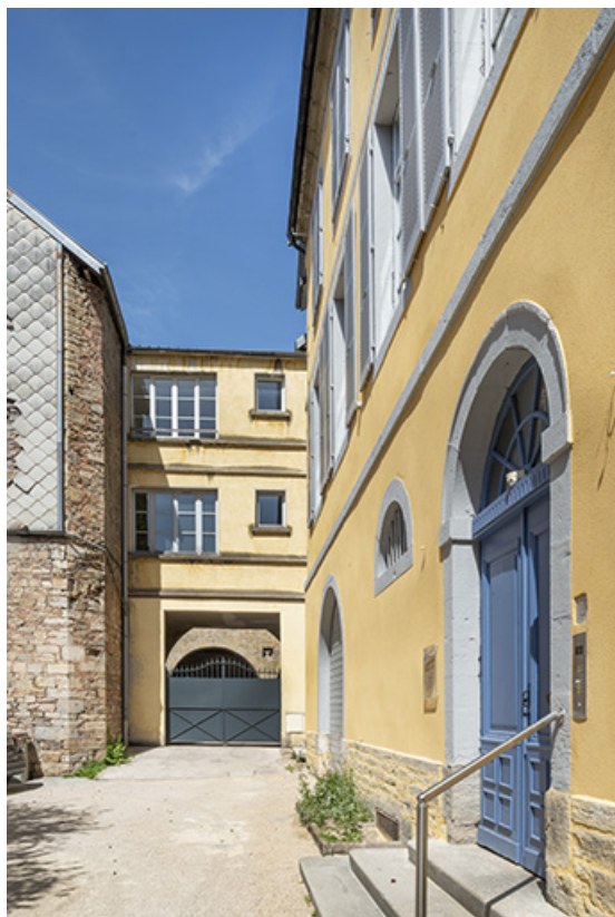
Façade antérieure vue de trois quarts et aile nord en retour.

39, Salins-les-Bains, 85 rue de la République