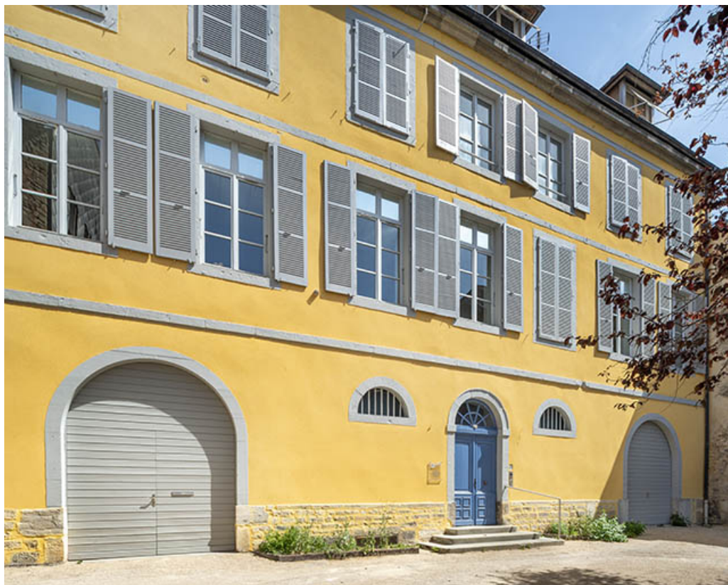
Façade antérieure, vue de trois quarts droite.

39, Salins-les-Bains, 85 rue de la République