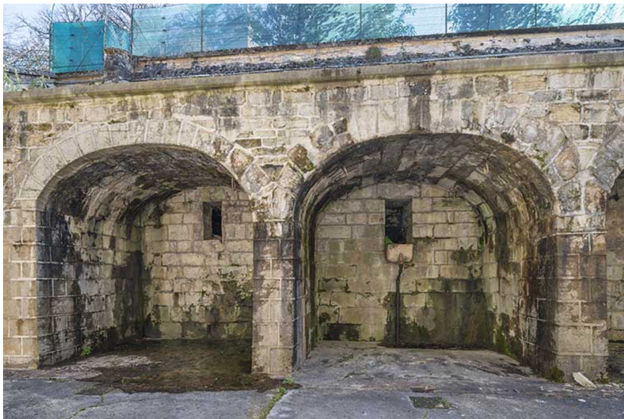
Cour ouest. Construction maçonnée voûtée en berceau en arc segmentaire, formant terrasse.

39, Salins-les-Bains, 85 rue de la République