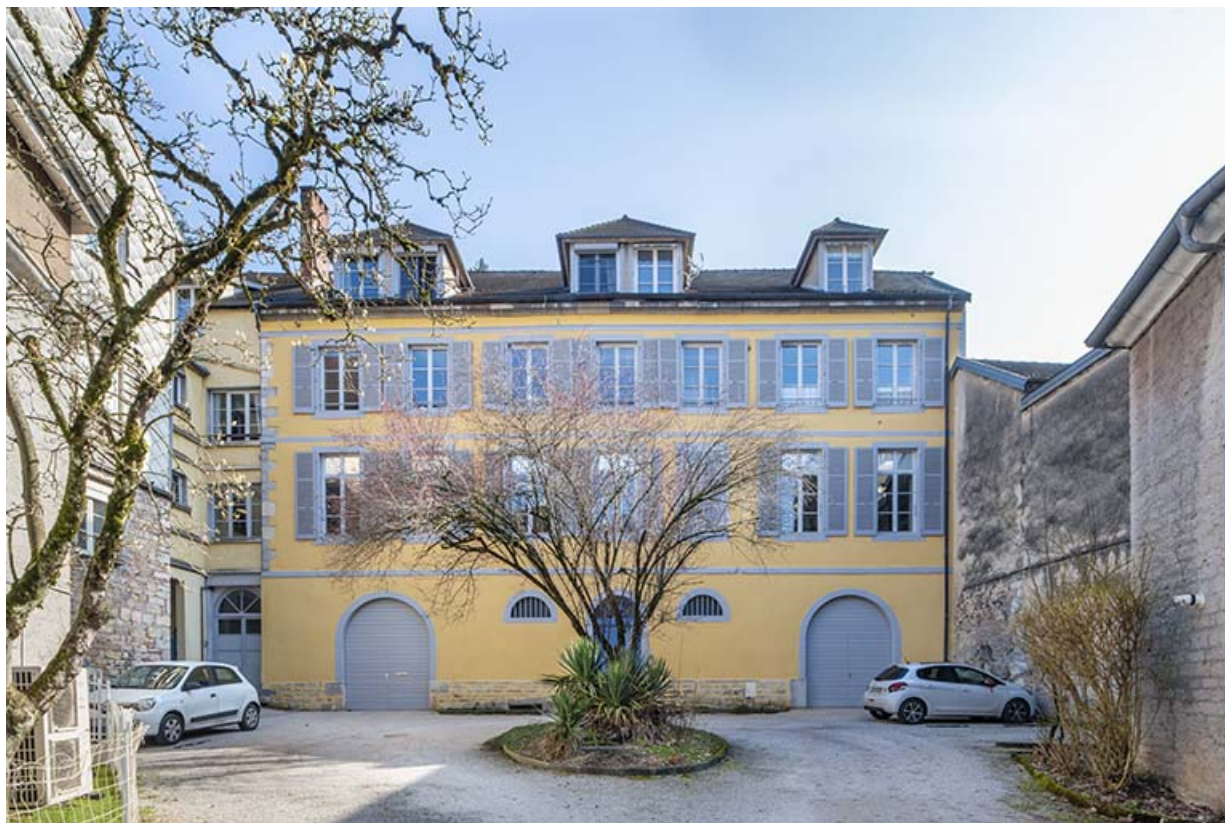
Vue d'ensemble depuis l'entrée de la cour.

39, Salins-les-Bains, 85 rue de la République