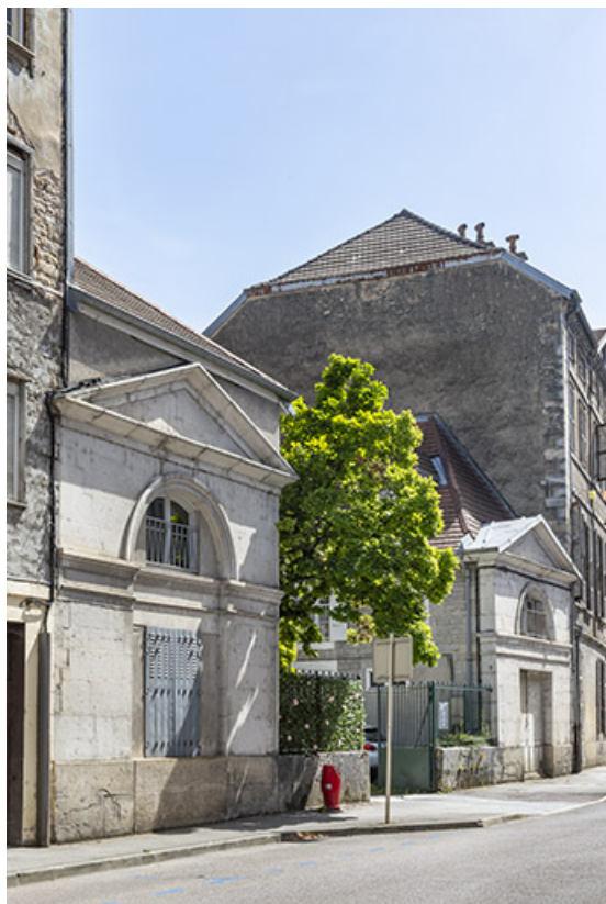
Vue de trois quarts des pavillons à l'entrée de la cour.

39, Salins-les-Bains, 85 rue de la République