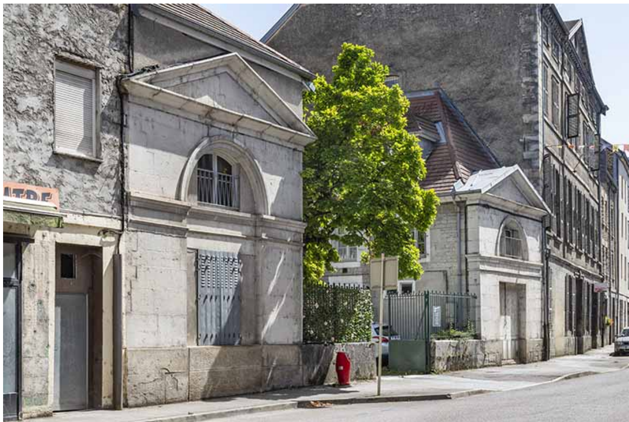
Vue de trois quarts des pavillons à l'entrée de la cour.

39, Salins-les-Bains, 85 rue de la République