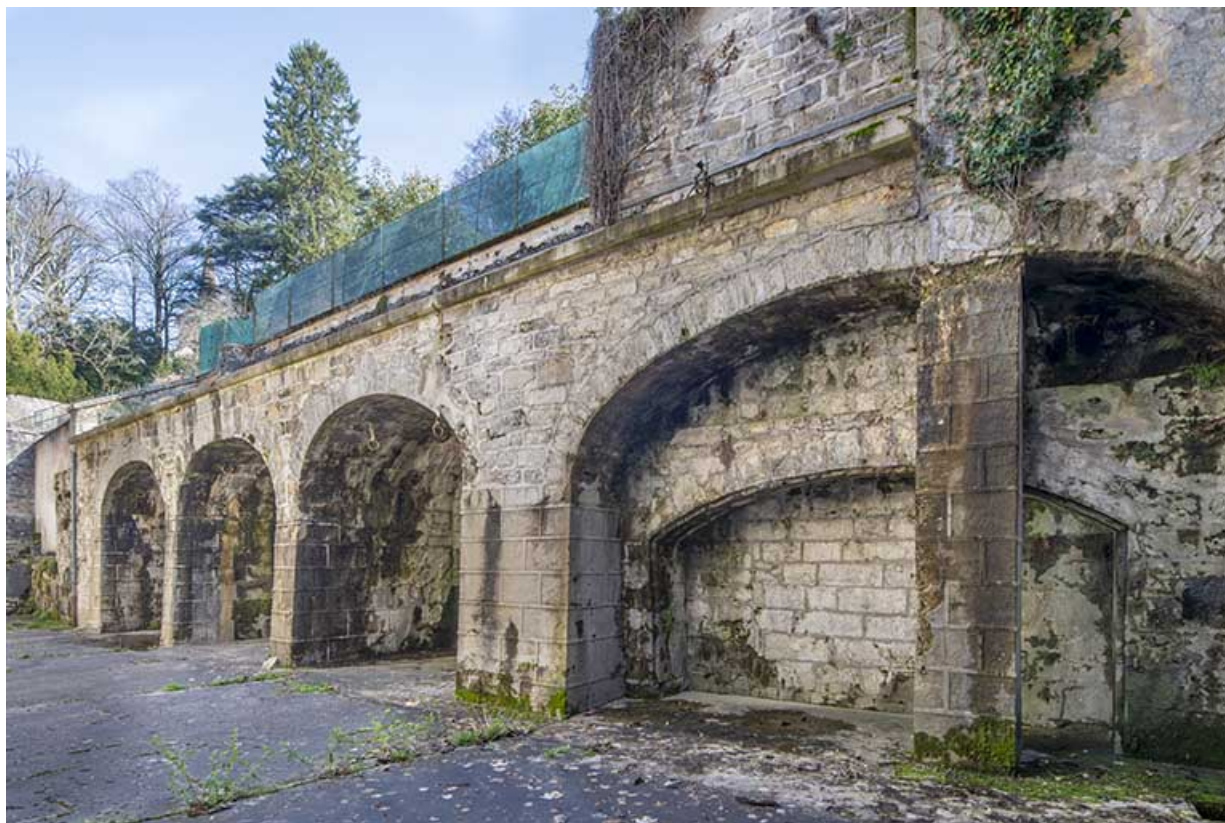
Cour ouest. Construction maçonnée voûtée en berceau en arc segmentaire, formant terrasse.

39, Salins-les-Bains, 85 rue de la République