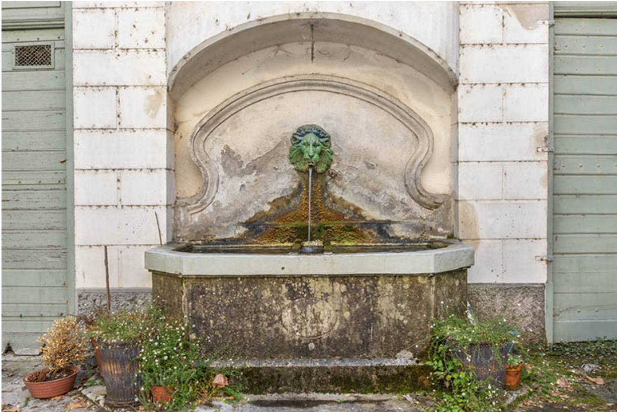
Détail de la fontaine de la cour. La date 1830 figure en façade du bassin.

39, Salins-les-Bains, 73 rue de la République