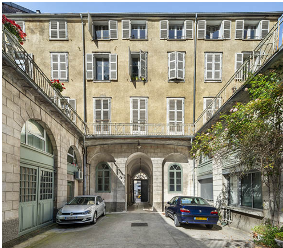
Façade postérieure vue depuis la cour.

39, Salins-les-Bains, 73 rue de la République