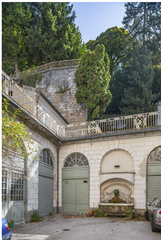
Vue d'ensemble depuis l'entrée de la cour.

39, Salins-les-Bains, 73 rue de la République