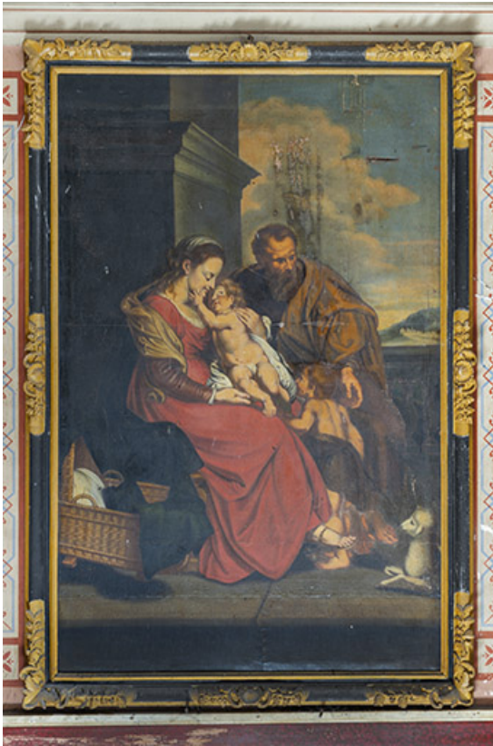
Escalier d'honneur. Tableau situé dans l'axe de la première volée (Sainte Famille). 39, Salins-les-Bains, 73 rue de la République