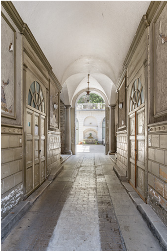
Vue depuis l'entrée du passage couvert.

39, Salins-les-Bains, 73 rue de la République