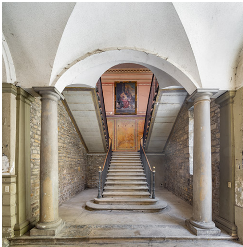
Départ de l'escalier d'honneur, depuis le passage couvert.

39, Salins-les-Bains, 73 rue de la République