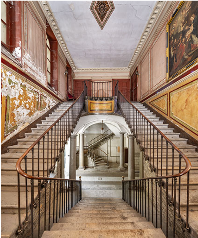
Escalier d'accès à l'étage noble. Vue d'ensemble depuis le premier palier. 39, Salins-les-Bains, 73 rue de la République