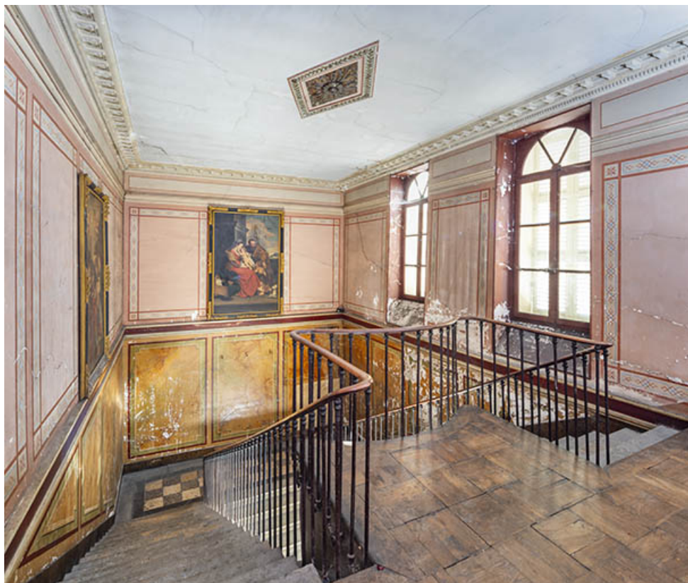
La cage d'escalier vue depuis le premier étage.

39, Salins-les-Bains, 73 rue de la République