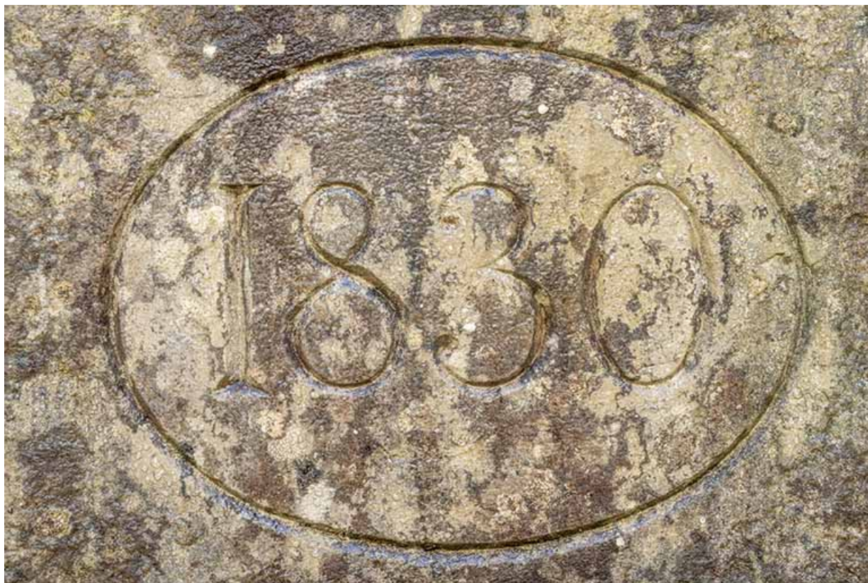
Fontaine de la cour. Détail de la date.

39, Salins-les-Bains, 73 rue de la République