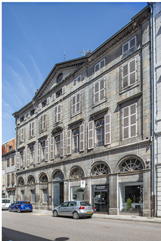
Facade antérieure vue de trois quarts droite.

39, Salins-les-Bains, 73 rue de la République