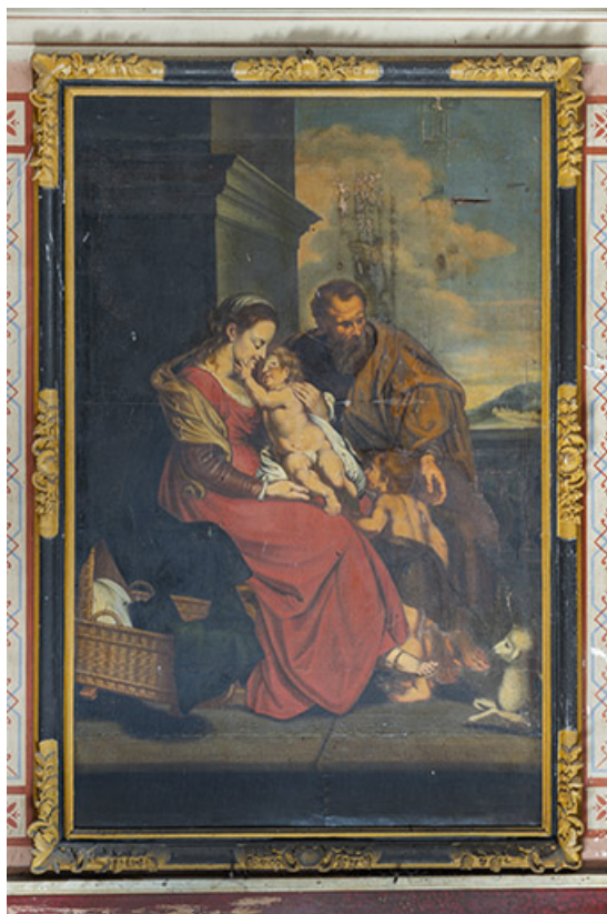
Escalier d'honneur. Tableau situé dans l'axe de la première volée (Sainte Famille). 39, Salins-les-Bains, 73 rue de la République