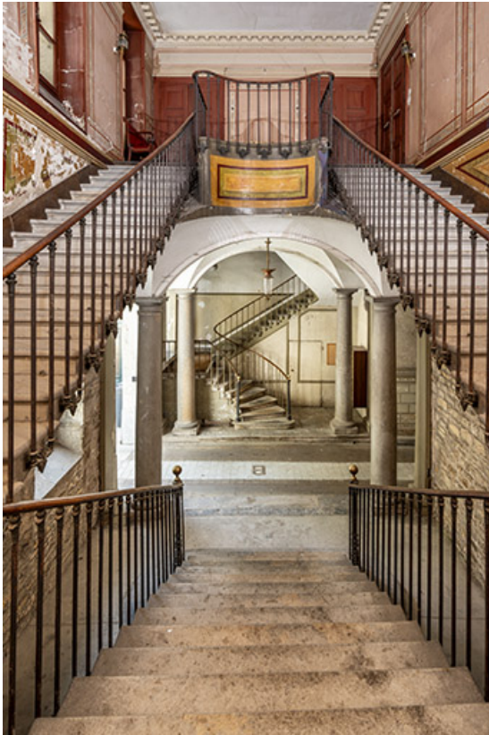
Escalier d'accès à l'étage noble. Vue axiale depuis le premier palier. 39, Salins-les-Bains, 73 rue de la République