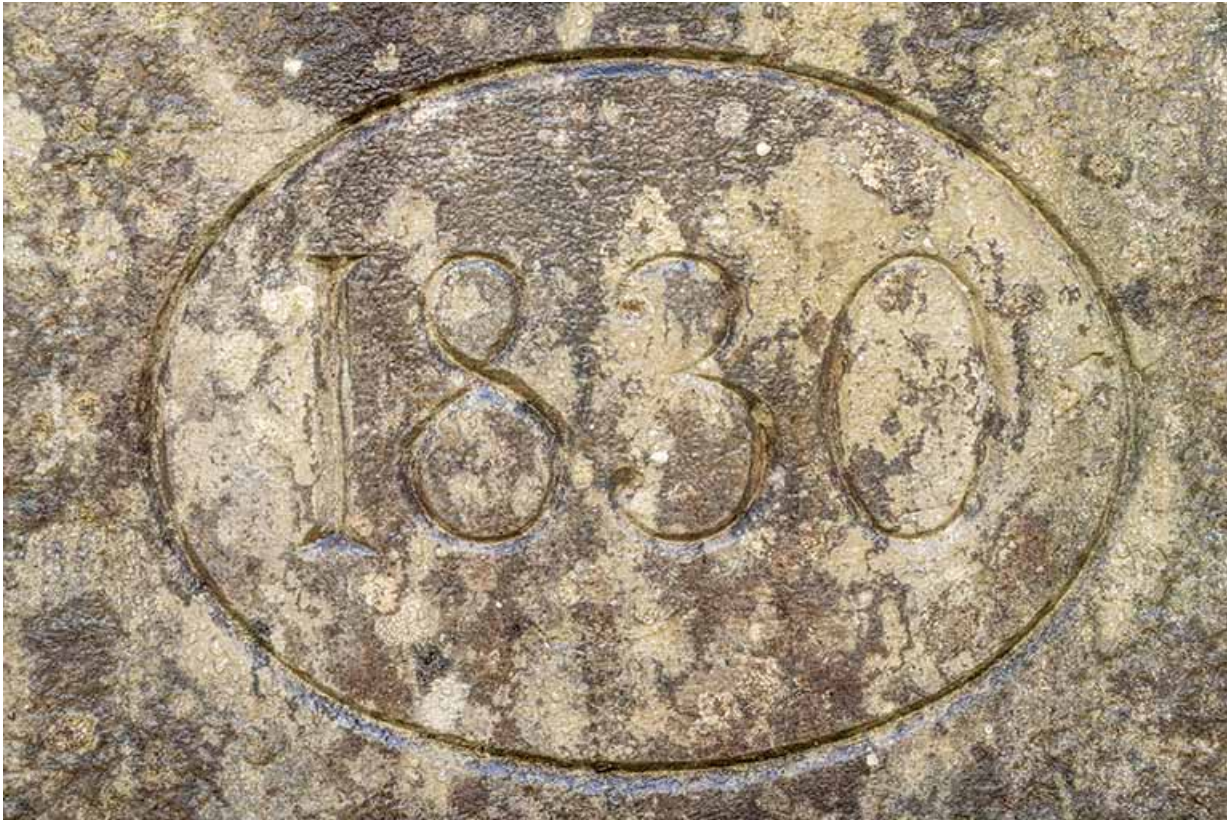
Fontaine de la cour. Détail de la date.

39, Salins-les-Bains, 73 rue de la République