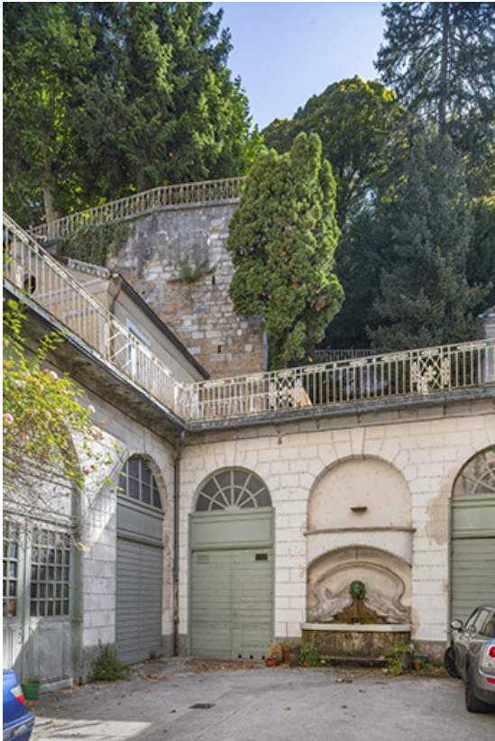
Vue d'ensemble depuis l'entrée de la cour.

39, Salins-les-Bains, 73 rue de la République