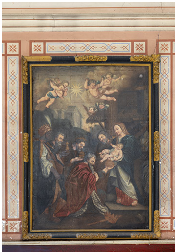
Escalier d'honneur. Tableau situé dans la seconde volée, à l'ouest (Adoration des Mages). 39, Salins-les-Bains, 73 rue de la République