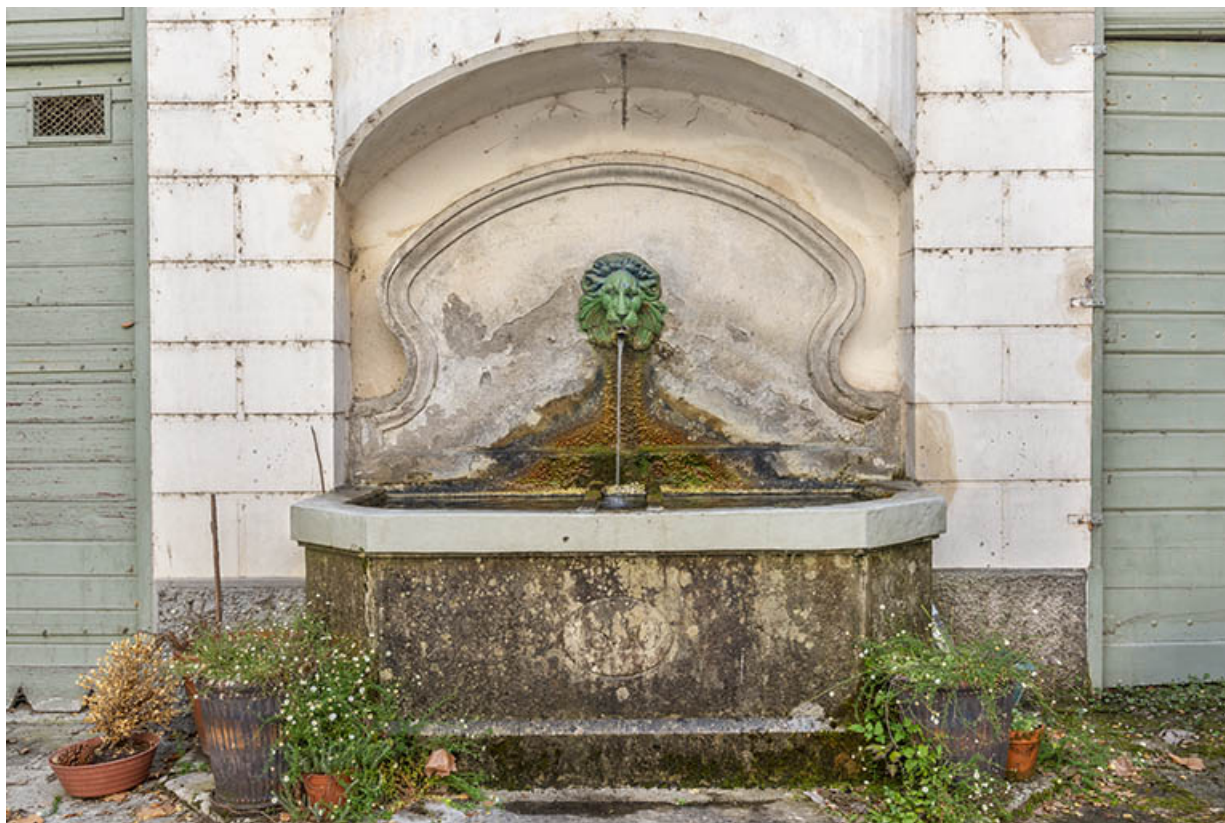
Détail de la fontaine de la cour. La date 1830 figure en façade du bassin.

39, Salins-les-Bains, 73 rue de la République