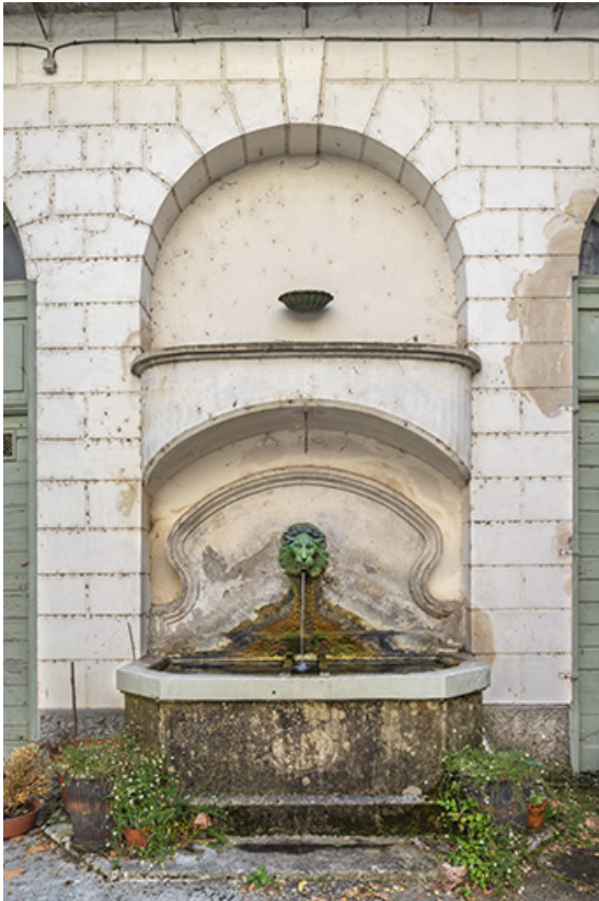
Fontaine située contre le mur est de la cour.

39, Salins-les-Bains, 73 rue de la République