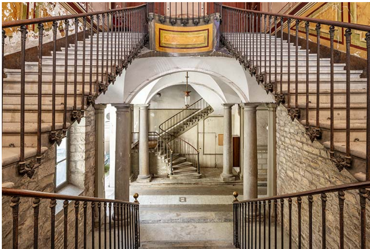
Escalier d'accès à l'étage noble. Vue rapprochée depuis le premier palier.

39, Salins-les-Bains, 73 rue de la République