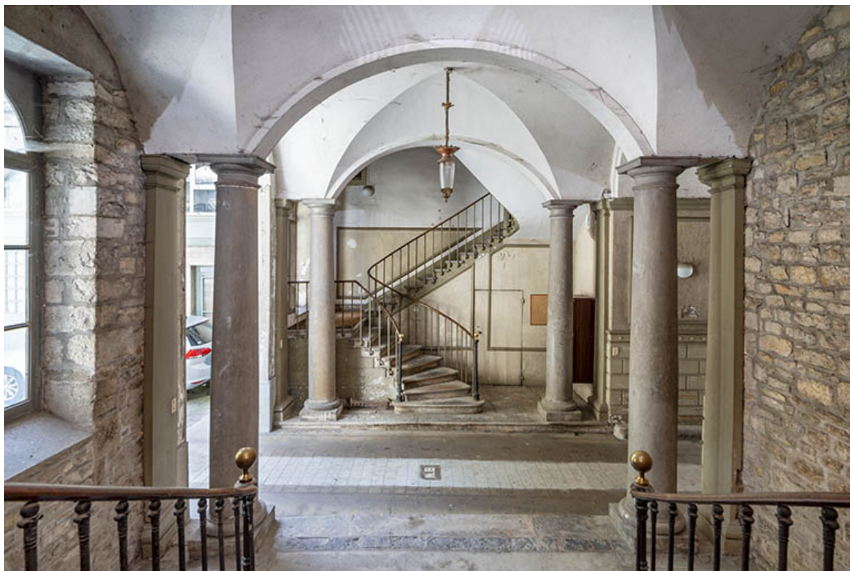
Colonnes du passage couvert et départ de l'escalier de service, depuis les marches de l'escalier d'honneur. 39, Salins-les-Bains, 73 rue de la République