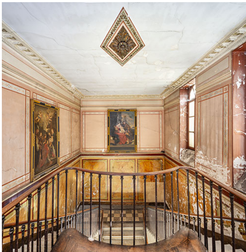
Vue axiale de la cage d'escalier depuis le premier étage.

39, Salins-les-Bains, 73 rue de la République