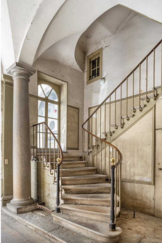
Départ de l'escalier de service, au bout du passage couvert.

39, Salins-les-Bains, 73 rue de la République