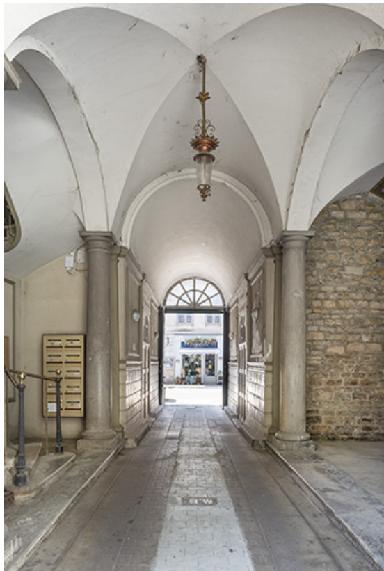
Vue du passage couvert depuis l'entrée de la cour.

39, Salins-les-Bains, 73 rue de la République