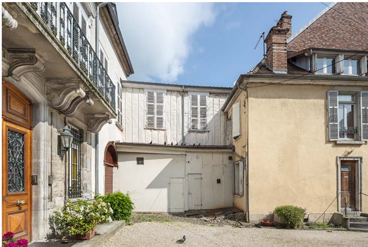
Logement et pavillon nord vus depuis la cour.

39, Salins-les-Bains, 20-22 rue de la République