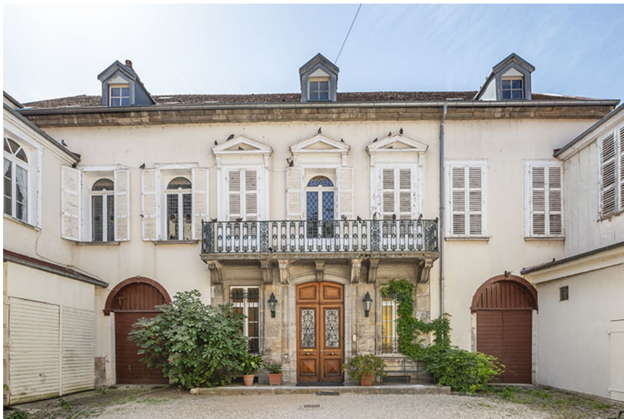
Façade sur cour. Vue de face.

39, Salins-les-Bains, 20-22 rue de la République