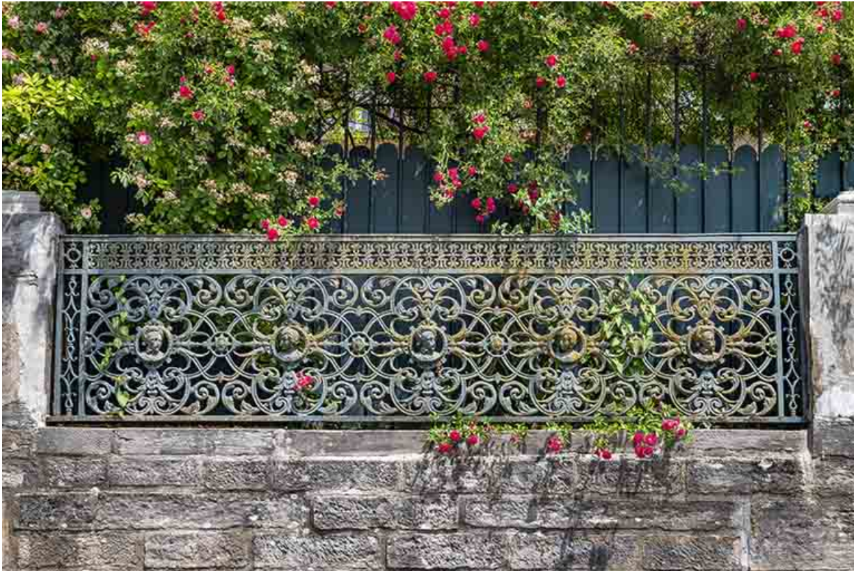
Grille fermant le mur du jardin, sur le quai Valette.

39, Salins-les-Bains, 20-22 rue de la République