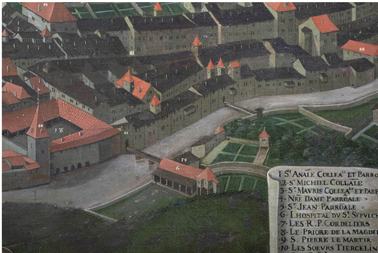
Tableau de Nicolas Richard (2e quart du 17e siècle) : secteur bâti entre la Grande Rue du Bourg-Dessus et la rue des Wallons. 39, Salins-les-Bains, 20-22 rue de la République