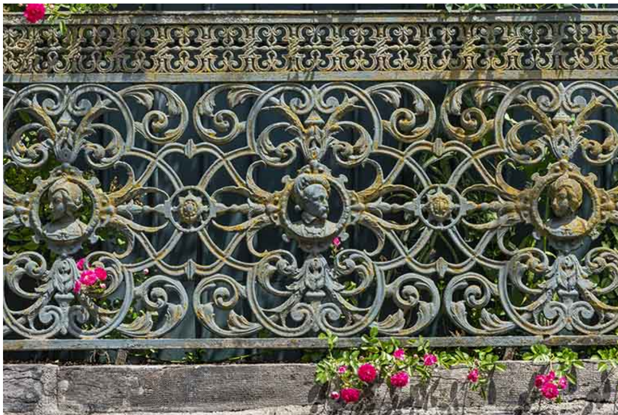
Mur ouest du jardin. Détail de la grille.

39, Salins-les-Bains, 20-22 rue de la République