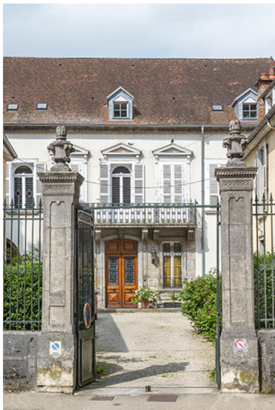
Vue depuis la rue de la République : porte de la cour et façade antérieure.

39, Salins-les-Bains, 20-22 rue de la République