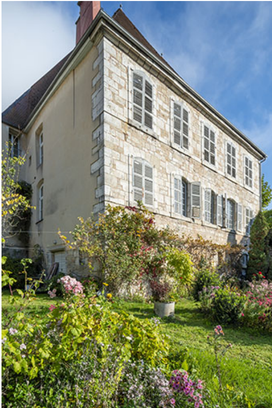
Vue de trois quarts en contre-plongée, depuis le jardin.

39, Salins-les-Bains, 1 place Saint-Anatoile