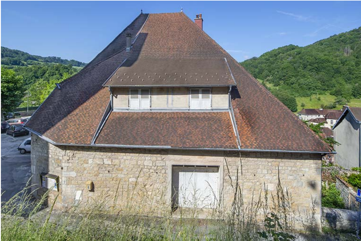
Vue plongeante depuis l'est.

39, Salins-les-Bains, 1 place Saint-Anatoile