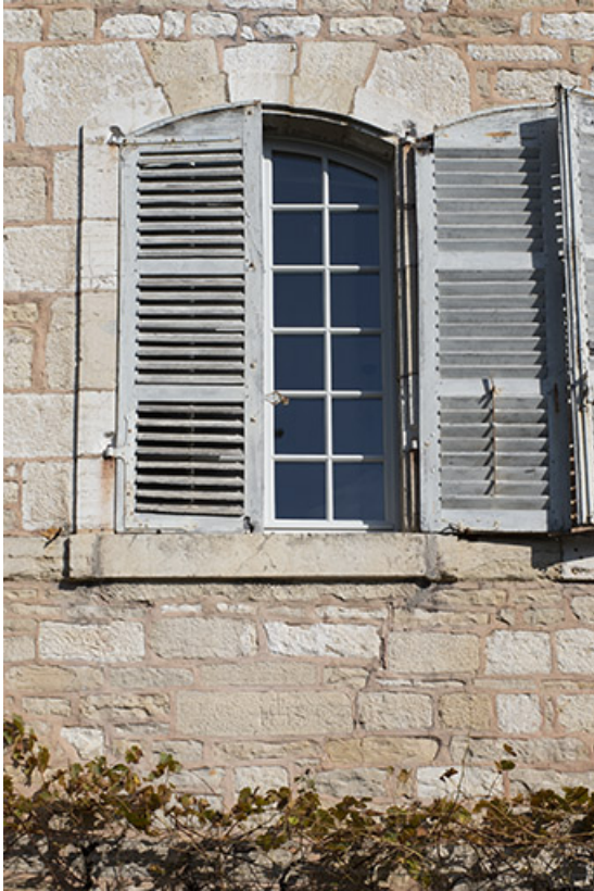
Fenêtre du rez-de-chaussée (façade ouest).

39, Salins-les-Bains, 1 place Saint-Anatoile