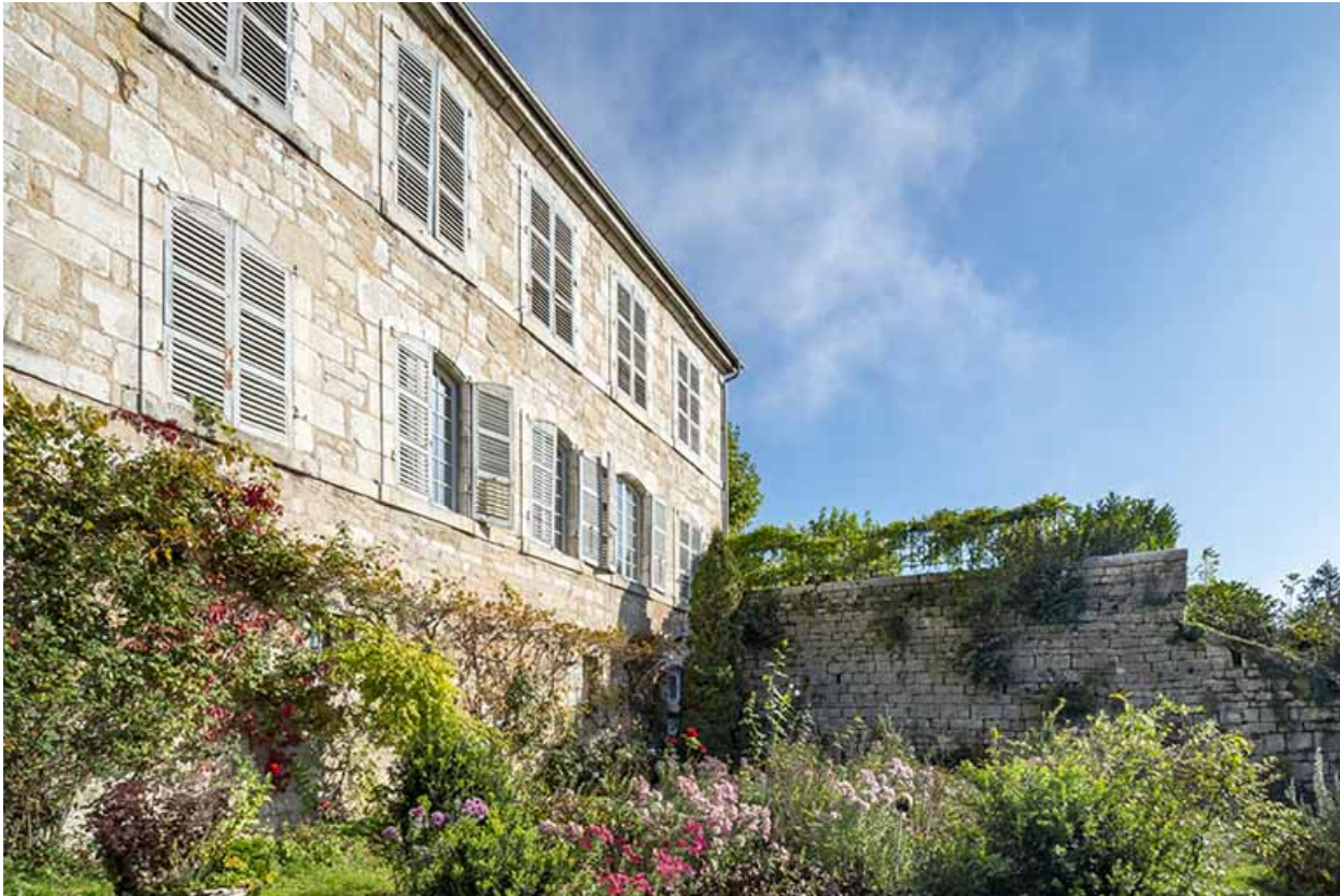
Façade ouest vue de trois quarts droite.

39, Salins-les-Bains, 1 place Saint-Anatoile