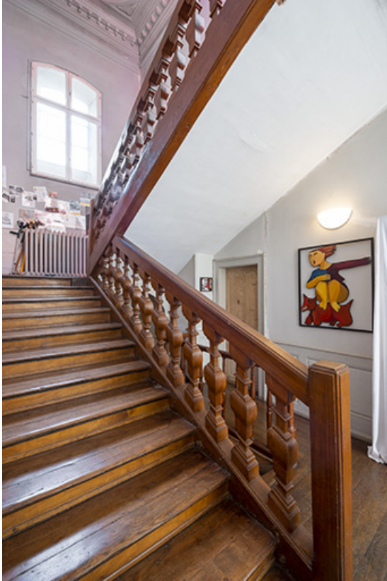
Cage d'escalier ouverte sur la façade sud.

39, Salins-les-Bains, 1 place Saint-Anatoile