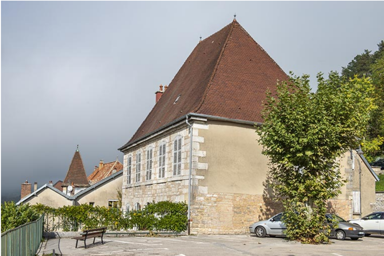
Vue de trois quarts, depuis la place de l'église.

39, Salins-les-Bains, 1 place Saint-Anatoile