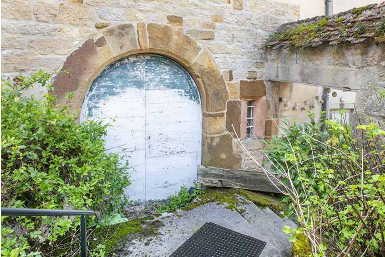
Porte de cave (façade nord).

39, Salins-les-Bains, 1 place Saint-Anatoile